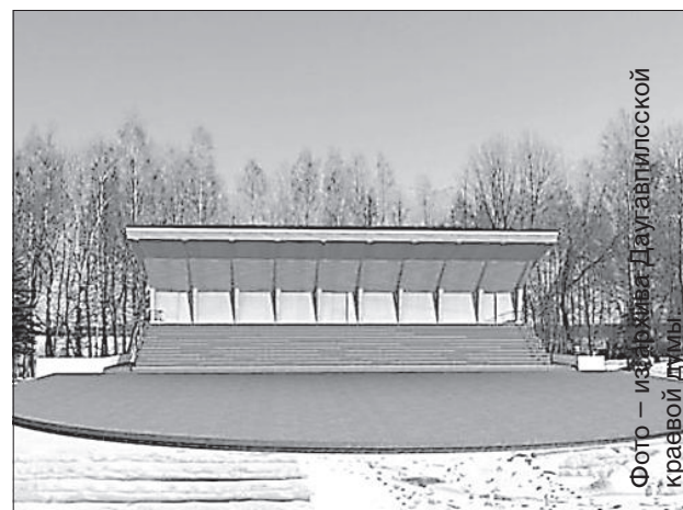
Макет новой эстрады.

Эгита Терезе Йонане В Вишкской волости идет строительство современной эстрады, которую планируется сдать в эксплуатацию осенью.