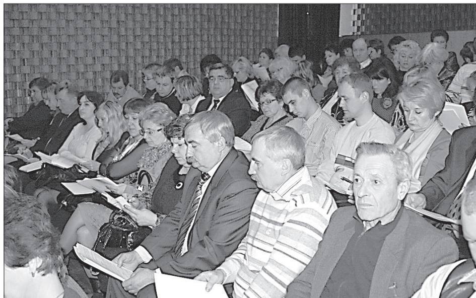
Учредители очень внимательно изучили программу партии.

Большая роль в программе партии отведена народному хозяйству. Первым пунктом значится поддержка и развитие уже существующих в крае предприятий, создание новых, а также продвижение и защита местных товаров на рынке. ДКП будет добиваться особого инвестици-