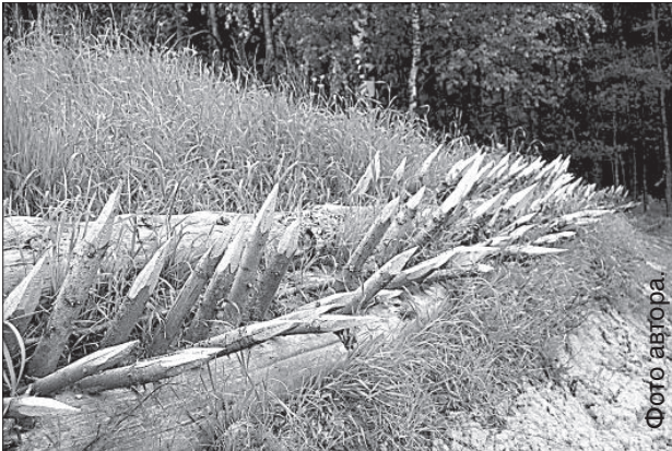
Часть оборонительного рва.

В Зундах Андрупенской волости Дагдского края скоро наступит время, когда Латгалия еще была не поработана крестоносцами, простой люд обрабатывал землю, а воины стоили оборонительные сооружения и совершенствовали навыки боя.