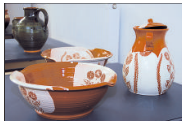
Функциональная и нарядна керамика.