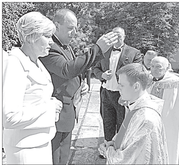
Родители Янина и Юзеф дают свое благословение сыну.

В присутствии более десяти священников и мини-