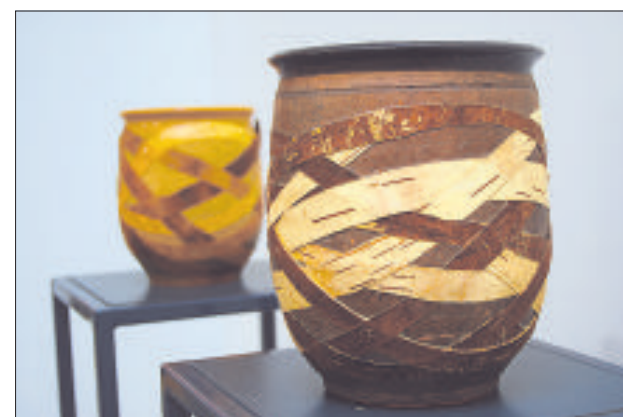
Керамика с берестой.

находить сходства и различия в изделиях литовских авторов и мастеров из соседних стран. Для Литвы больше характерна черная керамика, а также использование в работе природных элементов, прежде всего, бересты.