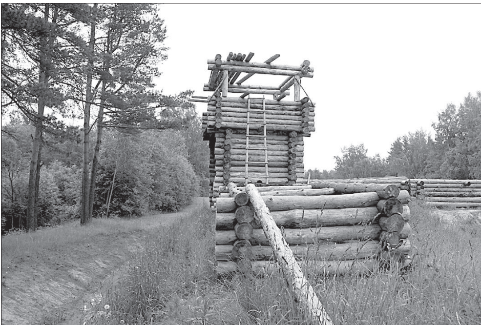
Ров разделяет Дагдский и Резекненский края. Северная башня.