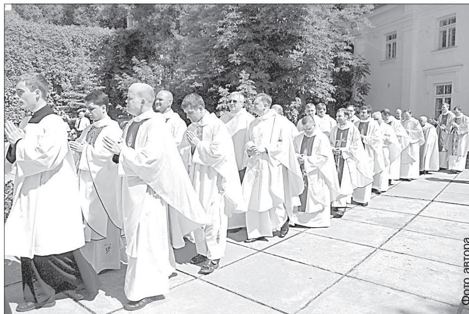
В празднике участвует много священников.