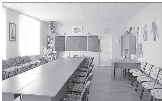
Кабинеты училища и комнаты общежития учащиеся ремонтируют своими руками.