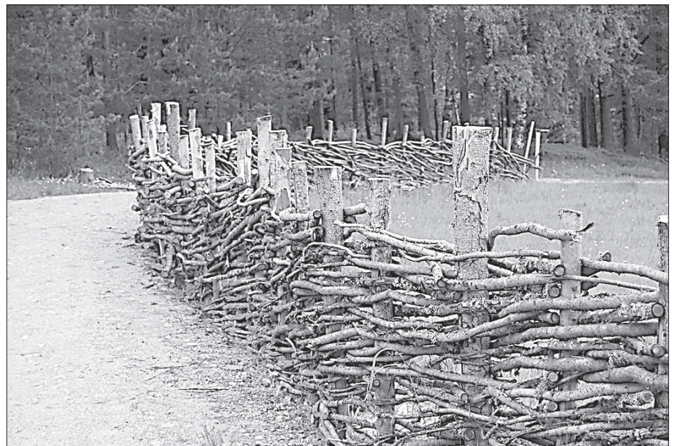
Дорога к замку.