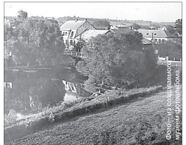
Вид на мельницу со стороны Илукстского Дома культуры.