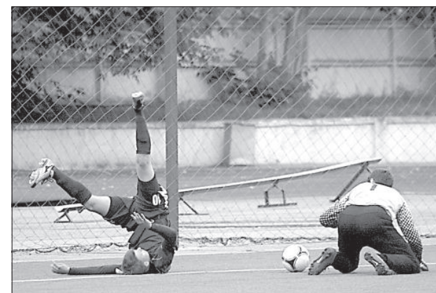
Как ни крутились игроки «Даугавы», а спасти матч не удалось.

А «РФШ», в чьих рядах было несколько игроков, поведавших более серь-