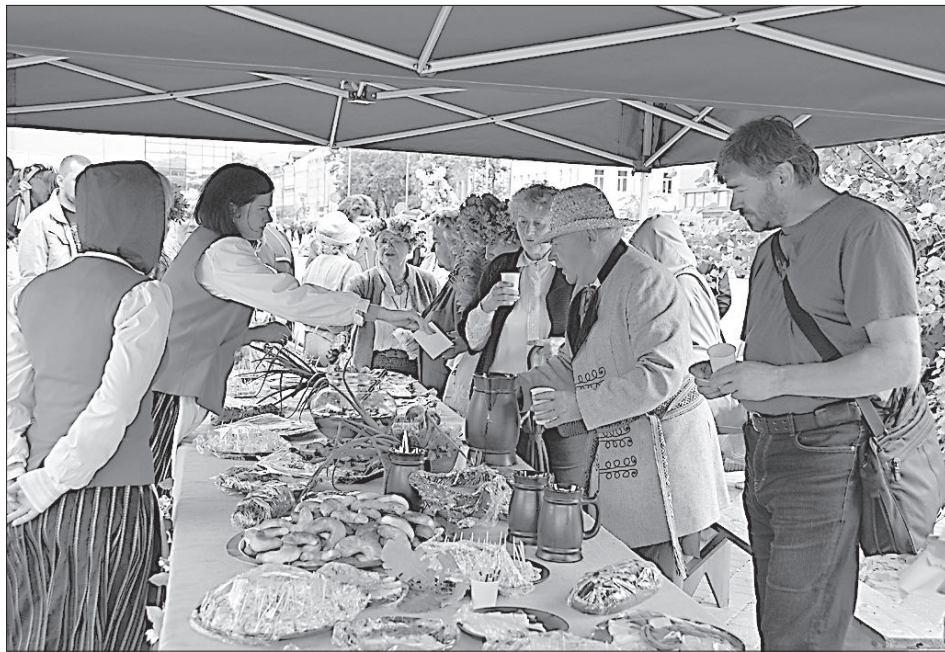
На площади Виенибас блюда Янова дня приглашало отведать Даугавпилское латышское общество.