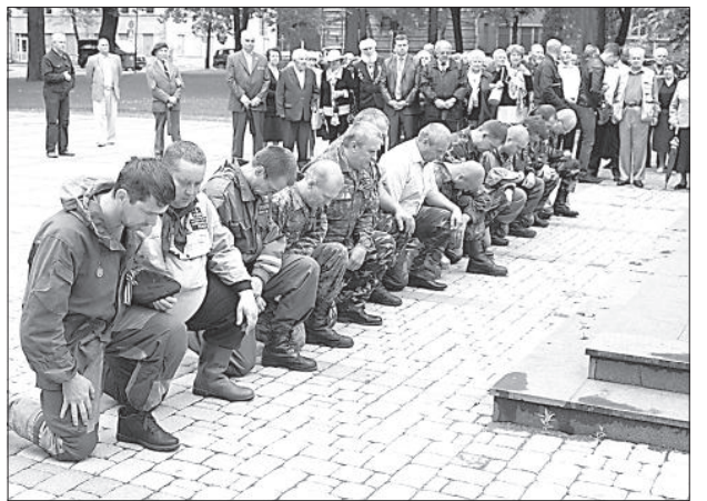
Члены поисковых отрядов преклонили колени.