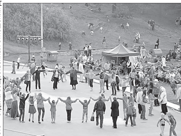
На празднике Лиго танцевали все.