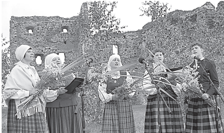
Поет коллектив «Rīkšova» из Нюкш Лудзенского края.