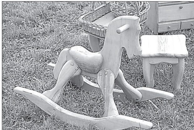
Деревянные изделия привезли литовские ремесленники.