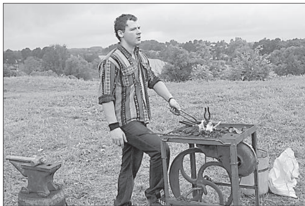
Кузнечные изделия с пылу с жару.