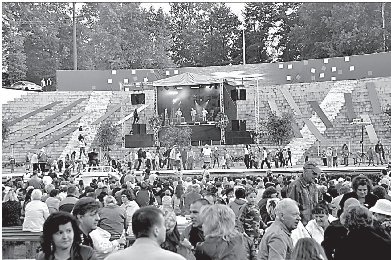
Выступают популярные артисты.