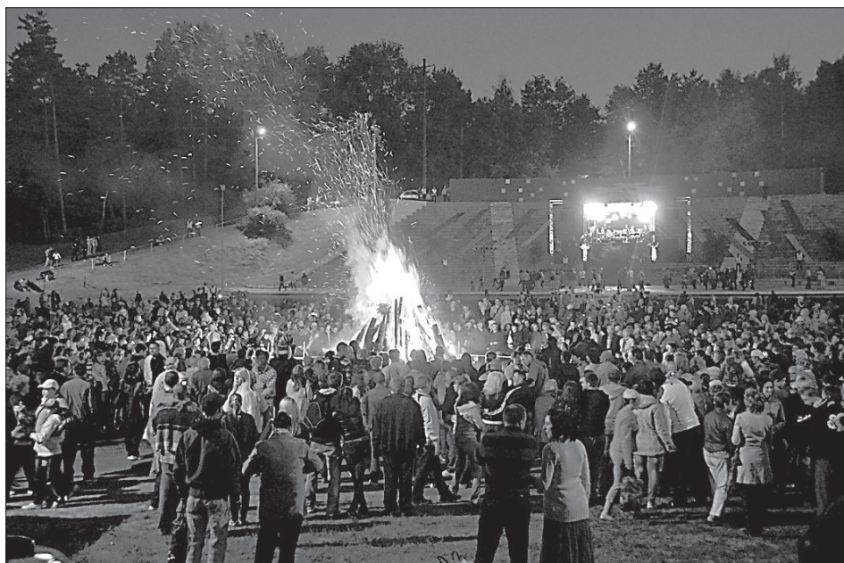
Костер Лиго в Стропах.

Одновременно с закатом солнца зажгли праздничный костер, вокруг которого даугавпилчане и гости города наслаждались волшебством ночи праздника Лиго.