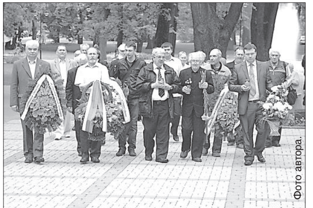
Дипломаты и представители общественных организаций возложили венки к Вечному огню.

Артём Дубовиков 22 июня в Даугавпилсе состоялись мероприятия, приуроченные к трагическим событиям 1941 года — началу Великой Отечественной войны. Утром в часовне Св. Александра Невского состоялся молебен.