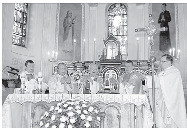
Епископ и священники на благодарственном богослужении.