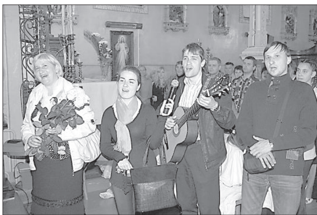
Декана поздравляют верующие прихода.