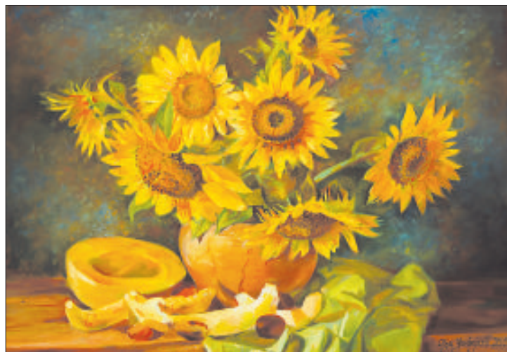
Цветы из сада.

техникам постоянно растет, в Риге это особенно заметно по посещаемости курсов. Каждый может найти занятие по душе, чего пока нельзя сказать о Даугавпилсе.