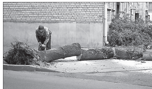
Работы по ликвидации последствий проходили в течение всей недели.

В первые минуты после окончания бури над ликвидацией последствий начали трудиться четыре бригады, помимо этого была задействована вся спецтехника предприятий «Labiekārtošana-D» и «CKDD». Благодаря этому уже вечером 30 июля магистральные улицы города были освобождены от упавших деревьев и веток. Коммунальные службы обнаружили на улицах куски шифера, что свидетельствует о повреждениях крыш на некоторых домах. ■