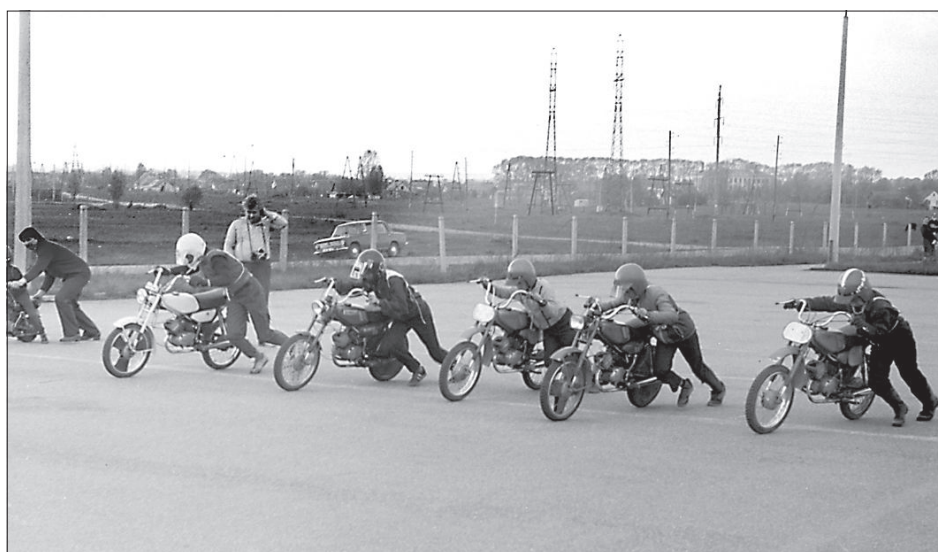
На соревнованиях «Золотой мопед» в конце 80-х (картодром «Блазма»).