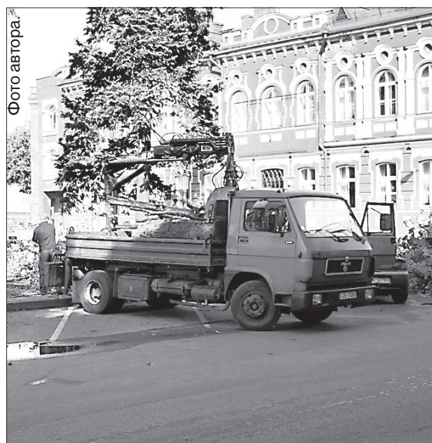
Коммунальные службы работают над уборкой улиц.