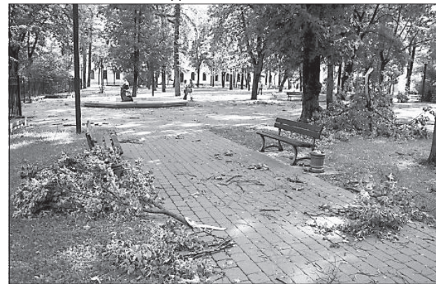
Так выглядел сквер А. Пумпура после ненастья.