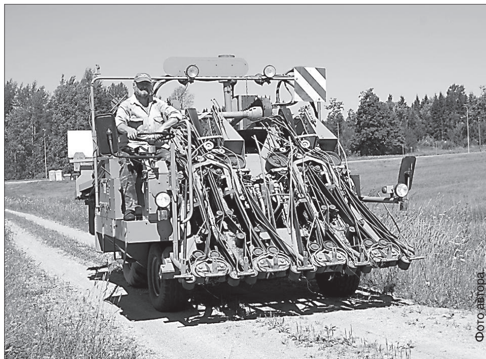
Бельгийская техника убирает поле в два раза быстрее.