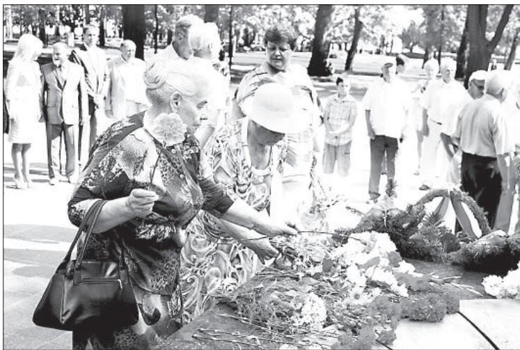
По традиции горожане возложили цветы к Вечному огню.