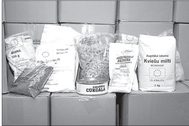
Содержимое продуктового пакета.

В первые дни июля в Даугавпилсе было выдано более 3 000 продуктовых пакетов ЕС для малоимущих и малообеспеченных жителей.