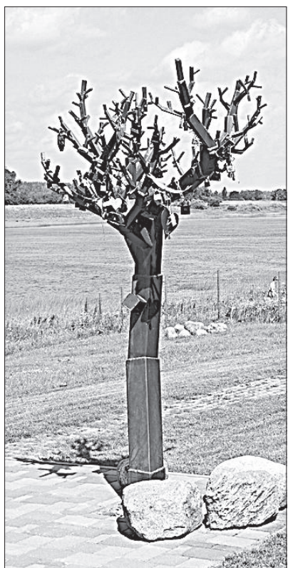
Дерево для молодоженов на берегу Даугавы.

Сейчас возле Ливанского центра активного туризма строится лестница, чтобы к Даугаве можно было удобно и безопасно спуститься. В городе пока нет ни одного благоустроенного пляжа, потому что это требует обязательного наличия спасателей. Но, по просьбам любителей купаться, берег реки по возможности будет благоустроен. ■