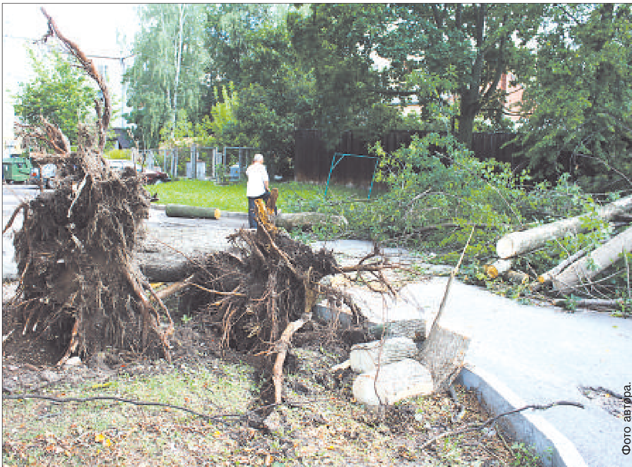
Дерево перегородило въезд во двор на ул. Лачплеша.

Артём Дубовиков В жаркий летний день, 30 июля, Латгалию накрыла одна из самых сильных бурь за последние годы. Гроза, град, ливень и порывистый ветер со скоростью более 20 м/с в течение шести минут основательно потрепали Даугавпилс. Были вырваны с корнем десятки деревьев и поломаны рекламные щиты и крыши.