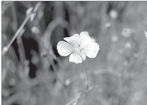
Синие цветы навсегда запали в душу агронома.