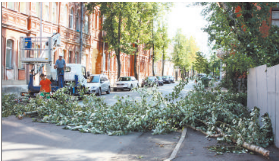
Нависавшее над улицей Кр. Валдемара дерево быстро опустили на землю.

Артём Дубовиков В жаркий летний день, 30 июля, Латгалию накрыла одна из самых сильных бурь за последние годы. Гроза, град, ливень и порывистый ветер со скоростью более 20 м/с в течение шести минут основательно потрепали Даугавпилс. Были вырваны с корнем десятки деревьев и поломаны рекламные щиты и крыши.