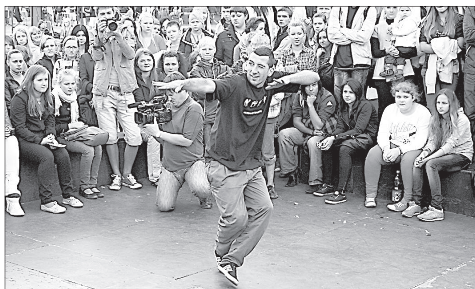
Безопаснее всего выяснять отношения в танце.

жонглированием, вращением и контролем равновесия различных предметов, а вот вечером ребята устроили на сцене фестиваля огненное шоу.