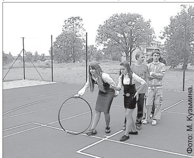
Подростки участвуют в эстафетах.

Праздник волости состоялся в Таборе второй раз, в прошлом году он был посвящен семьям, а в следующем году будут чествовать крестьян. ■