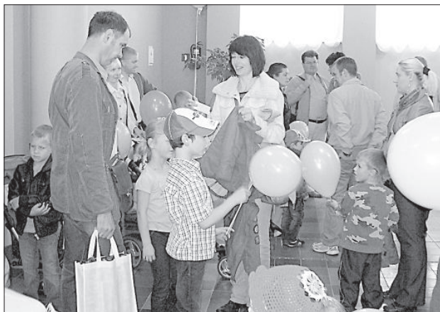
В День отца Даугавпилский театр всех приглашал на мероприятие «Я и мой папа».