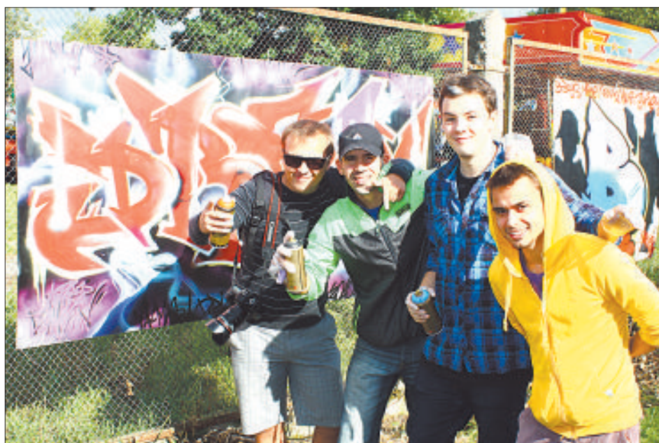
Красивые граффити радуют глаз.