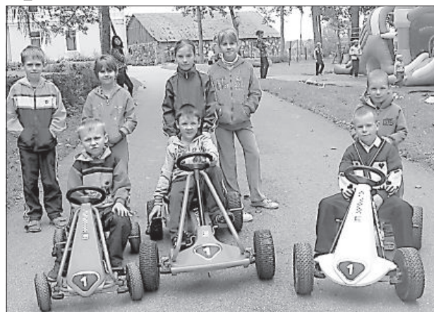
Детям понравилось кататься на картингах.

Возле школы был установлен надувной городок с горками и лабиринтами,