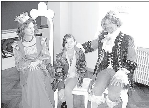
В театре можно было сфотографироваться вместе с героями любимых спектаклей.