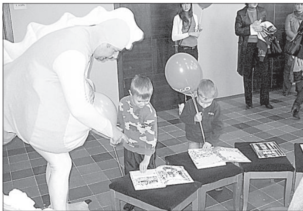
Читать книжки вместе с Драконом интереснее.