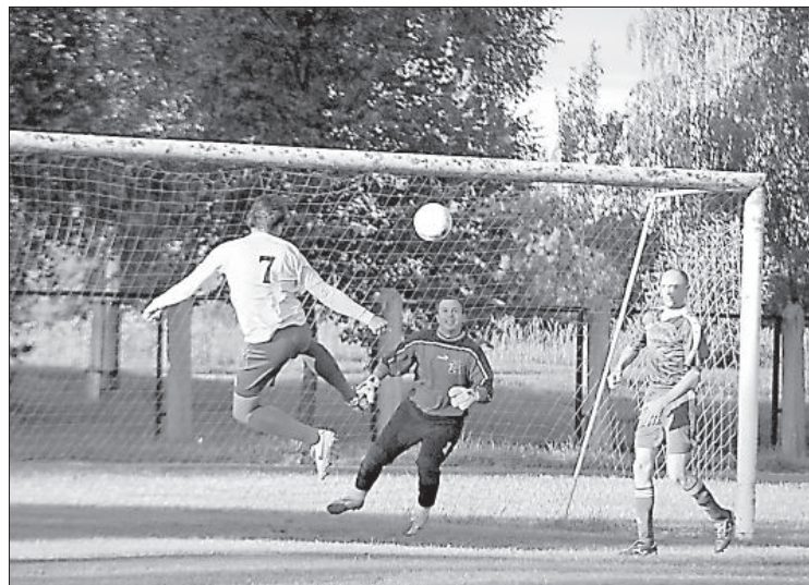
Гол нужно забивать красиво.