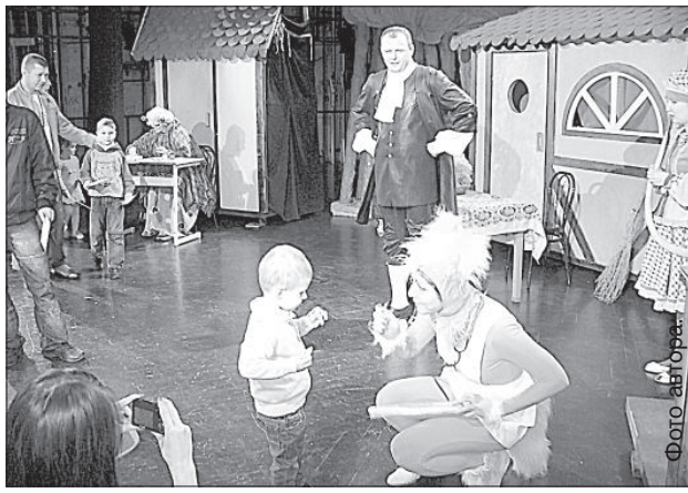
На празднике можно было подняться на сцену.

Семьи хорошо провели день, а у театра была возможность больше рассказать о себе. Думается, что многие в дальнейшем станут постоянными посетителями театра, где сейчас начинается новый сезон с множеством интересных спектаклей на любой вкус для зрителей всех возрастов. В День отца в кассе театра была возможность по особой цене купить билеты на спектакли, которые состоятся в сентябре и октябре. При покупке хотя бы одного билета на любой детский спектакль, второй билет получали бесплатно.