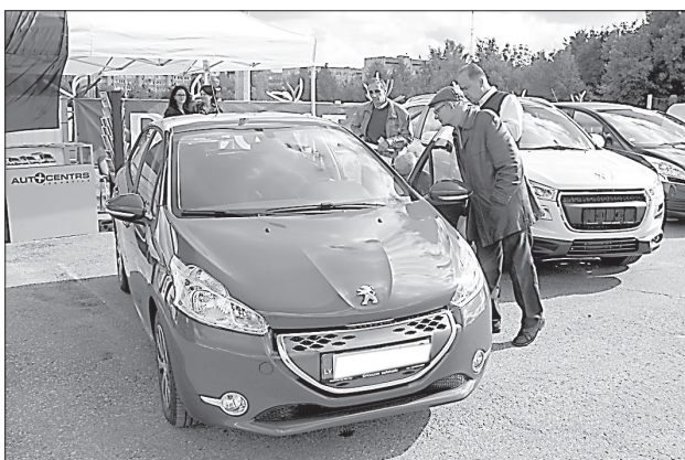
Компактная и популярная модель «208».