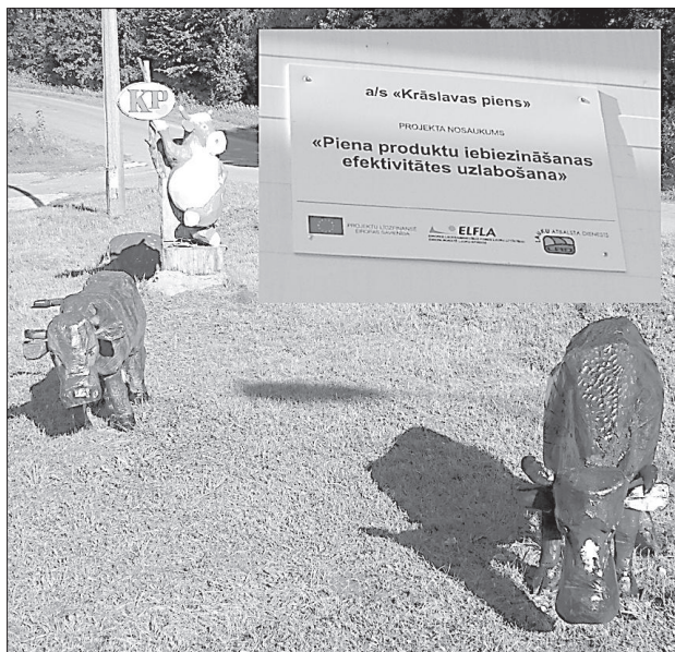
Проект реализован при поддержке Европейского сельскохозяйственного фонда для развития села.