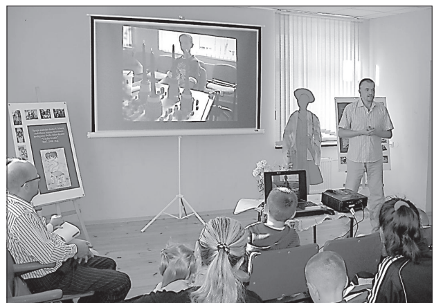
А.Репин рассказывает, чему калкунские дети будут учиться в новой школе.