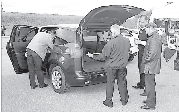
Большой интерес вызвала модель семейного авто «5008».