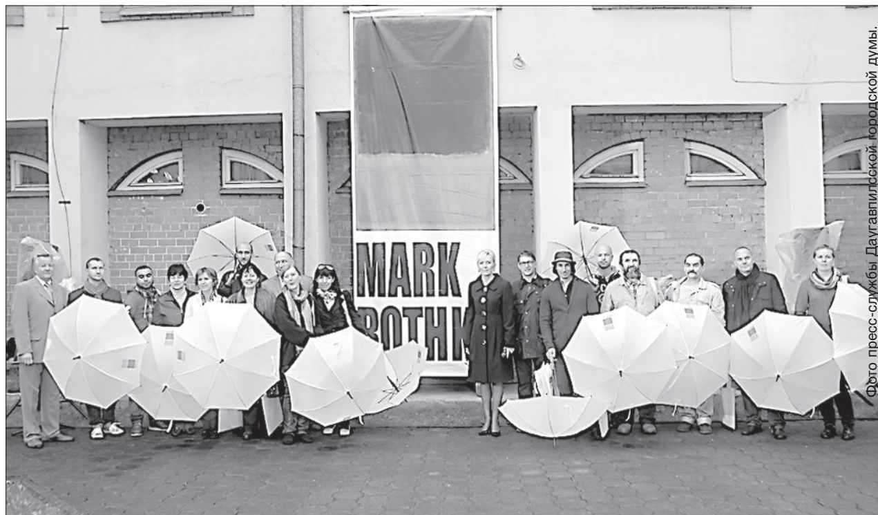
Участники пленэра М. Ротко вместе с руководством городской думы.

15 сентября в Даугавпилсе открылся 8-й по счету Международный пленэр Марка Ротко. Перед тем, как 15 художников из девяти стран начали творить, для знакомства была организована пресс-конференция.