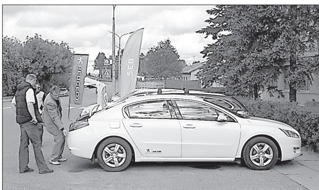
Посетители с интересом знакомились с новыми моделями.