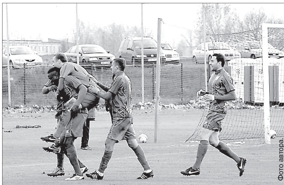
Празднование второго гола.