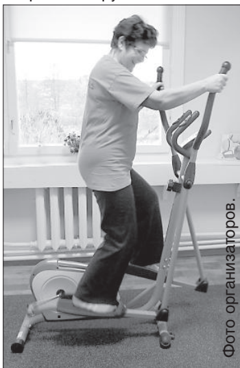
Жители волости с интересом опробовали новые тренажеры.

Проект поддержали «Латвийский фонд общественных инициатив», предоставивший для его реализации 3 000 латов, краевая дума, доля финансирования которой составила 800 латов, и Скрудалиенское волостное управление – 1600 латов. В результате реализации проекта были приведены в порядок и оборудованы различными типами тренажеров 4 помещения (общая площадь 45 кв. м.). Всего же для занятий спортом закуплено 8 тренажеров. ■