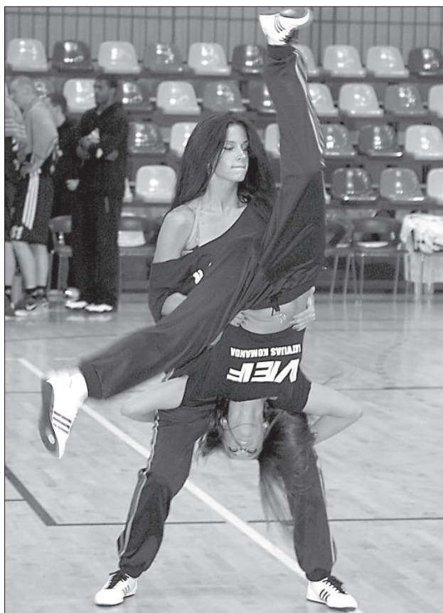
Группа поддержки ВЭФ.