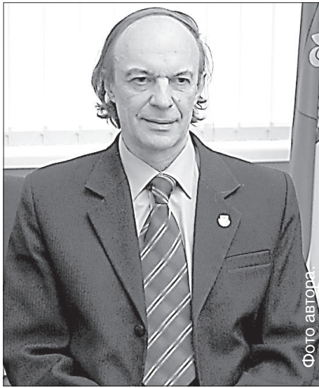
Лучший учитель Латгалии.