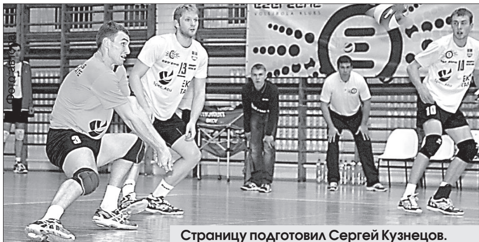
Страницу подготовил Сергей Кузнецов.

С девятью очками «ДУ» идёт на седьмом месте из десяти команд-участниц.