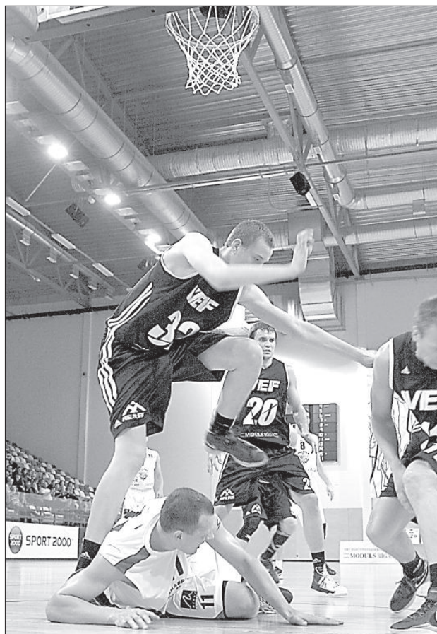
Безжалостный мужской баскетбол: затопнут сразу.