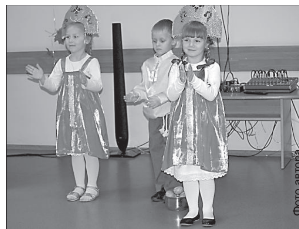
Юбиляров поздравляют воспитанники 27-го детского сада.

ральной нервной системы, для которого характерны нарушения координации, зрения, речи, движения. Особенностью болезни является одновременное поражение нескольких различных отделов нервной системы, что приводит к появлению у больных разнообразных неврологических симптомов. По статистике, рассеянным склерозом заболевают чаще всего в возрасте с 15 до 40 лет, болезнь в 2/3 случаев поражает женщин. Это не смертельная, не заразная и не наследственная болезнь. В мире насчитывается около 2-х милли-