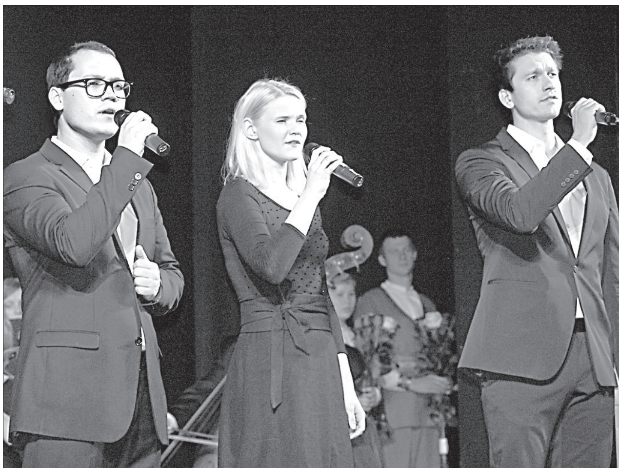
Выступает группа «Framest».