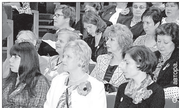
Многие социальные работники трудятся в своей сфере все 20 лет.

14 ноября большой зал городской думы заполнили работники социальной сферы, чтобы вместе отметить профессиональный праздник и 20-летие социальной службы города.