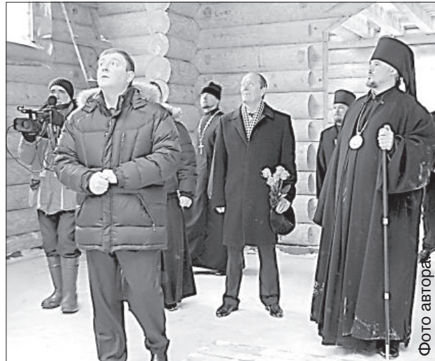
Внутри храм светлый и просторный.

Только в начале 2000-х годов за восстановление храма сообща взялись неравнодушные жители Балви, обратившиеся за помощью в краевую думу, Посольство России, Латвийскую православную церковь и другие инстанции. Ответственность за строительство взял на себя де-