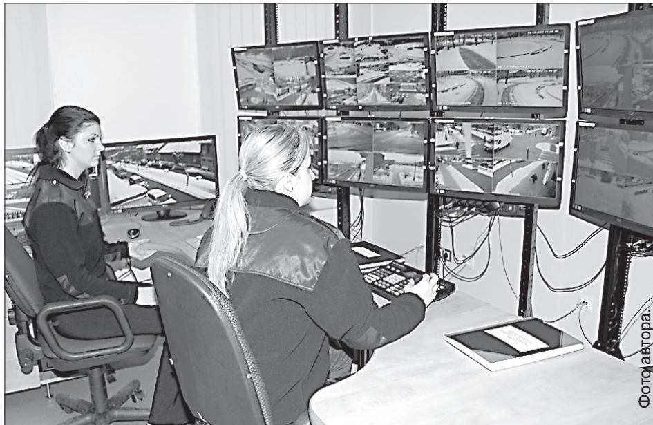
За мониторами следят двое сотрудников муниципальной полиции.

Официально на полную мощность камеры стали работать 9 ноября, в тестовом режиме они начали действовать в конце июля. Всего на 28 объектах установлены 55 камер, это, в первую очередь, площадь Виенибас, вокзал и автостанция, оживленные перекрестки. По словам инспектора полиции самоуправления Язепса Островского, за три недели работы камер в полноцен-