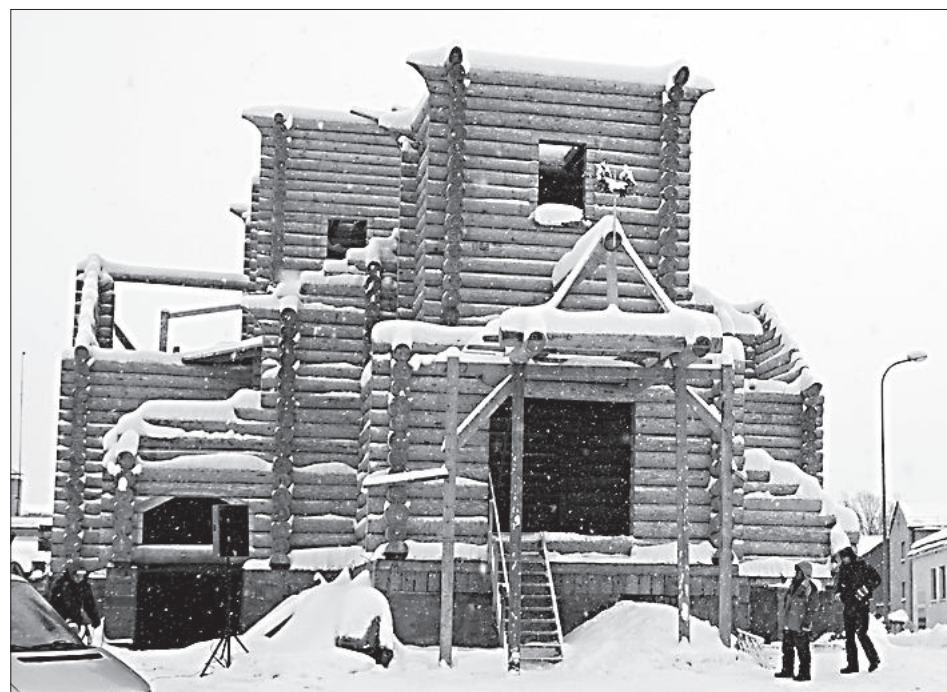
Деревянный сруб будущего храма.