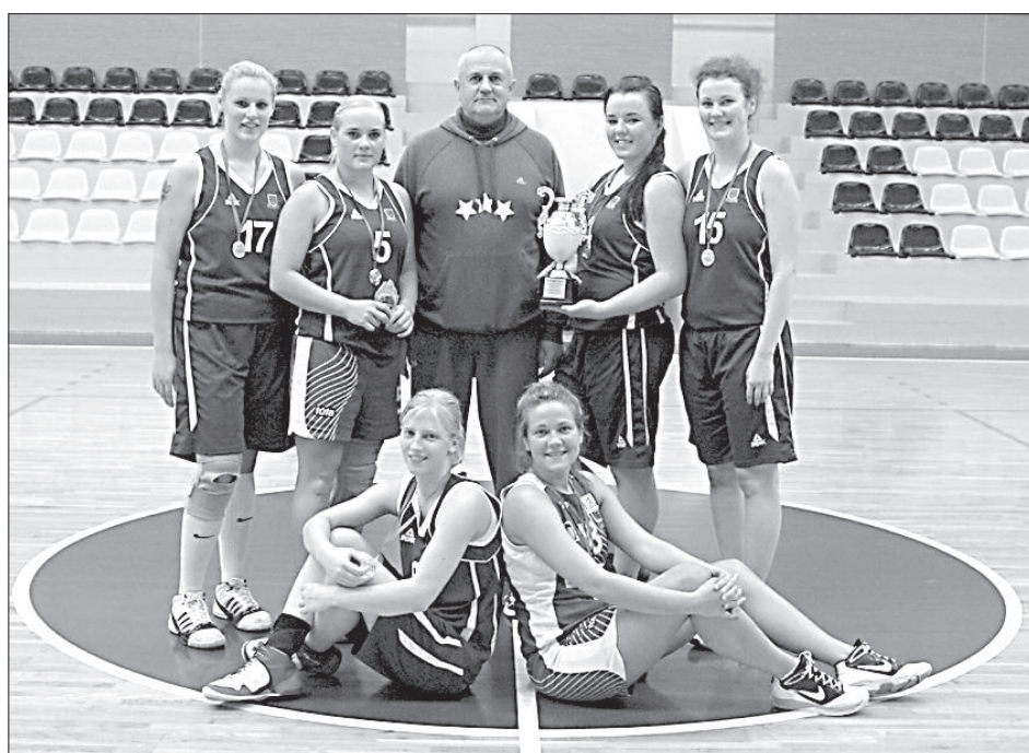
Чемпионки Даугавпилса-2012 – команда «ДУ».