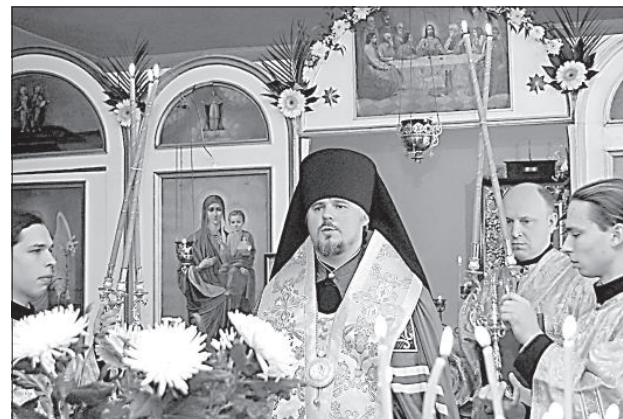
Уже 30 лет службы проходят в помещении бывшего книжного магазина.

Планируется, что полностью строительство церкви завершится летом 2013 года, и она будет освящена в свой престольный праздник Успения Богородицы 28 августа.