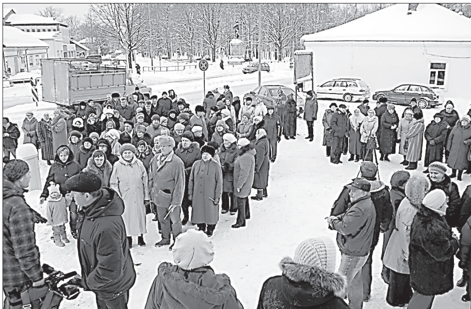
Прихожане рады восстановлению храма.

18.12.2012. •• LATVIJAS BANKAS NAUDAS ZIME