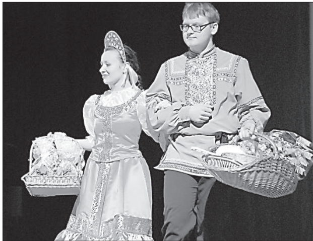
Скоморохи раздают подарки.