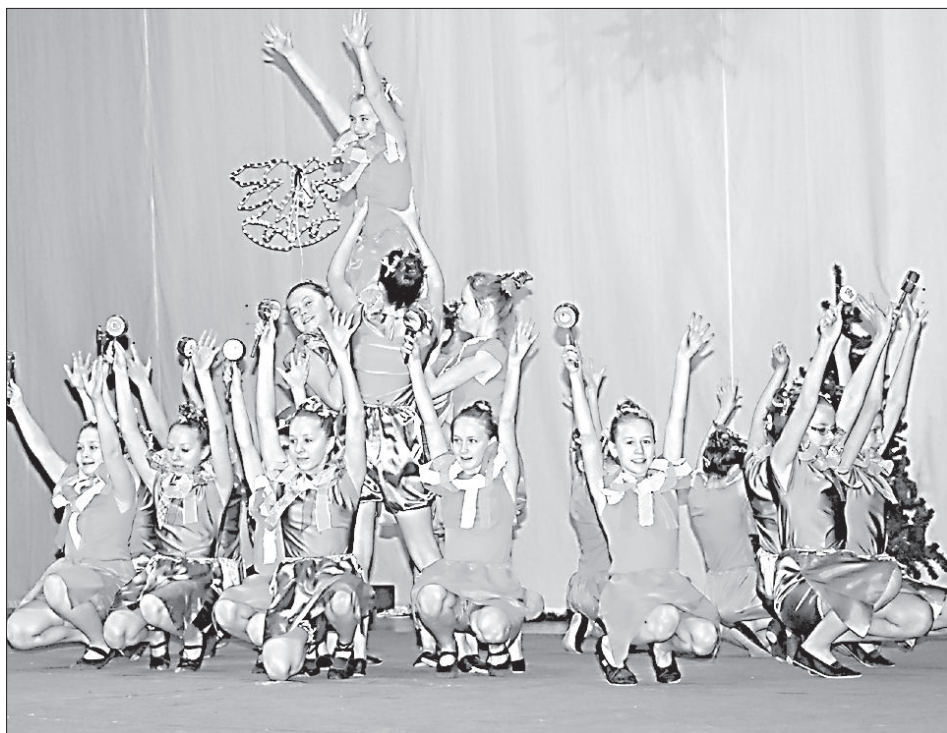
Танцевальный коллектив «Фантазия».