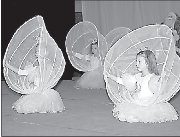
Театр танца «Jūras pērles».

За щедрые аплодисменты скоморохи дарили зрителям сладкие подарки, а юные артисты награждались кренделями от Генерального консульства России.