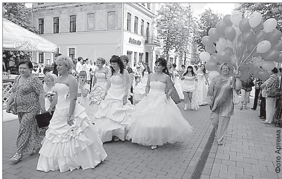
Парад невест на ул. Ригас.