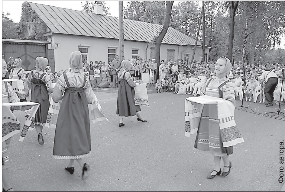
Гости из Владимира приехали с хлебом-солью.

Перед зрителями и участниками выступила руководитель Пушкинского общества Даугавпилса, обладатель почетного звания «народная пушкинис-