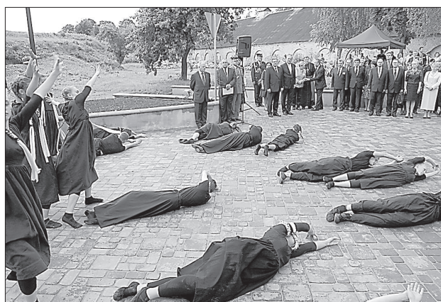
Драматичное представление из книги «Без названия».