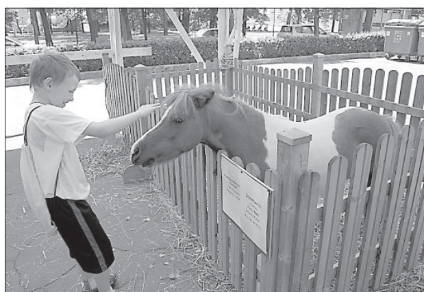
От желающих покормить пони не было отбоя.