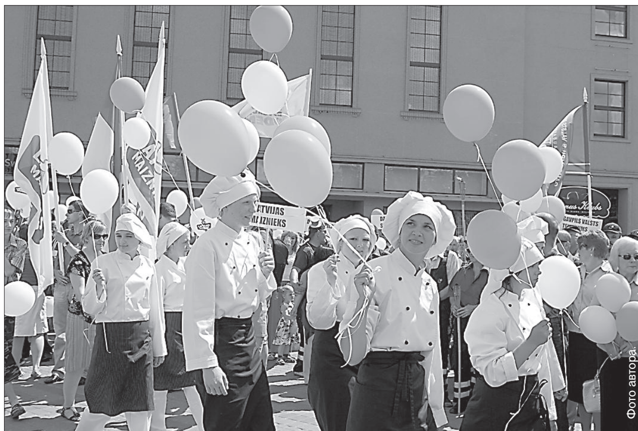
Учащиеся торговой школы на шествии предпринимателей.