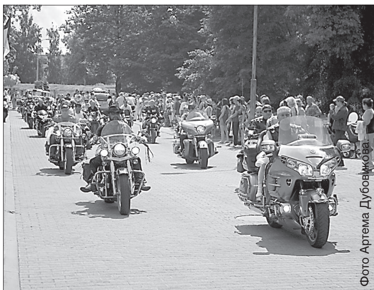
Байкеры возглавили парад невест.