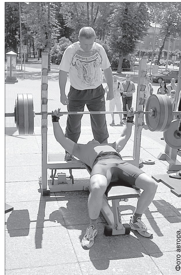
Атлет идет к новому рекорду.