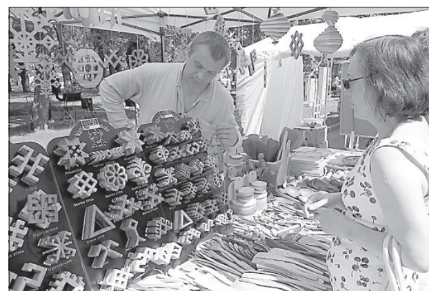
Латвийские знаки от мастеров из Талси.