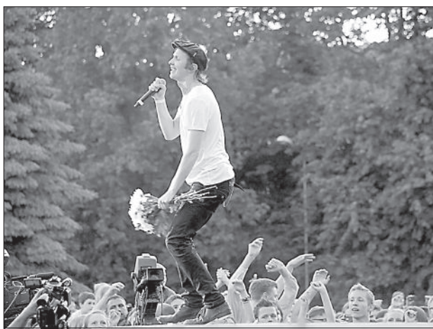
Солисту «Prāta Vētra» Ренарсу Кауперсу поклонники дарили цветы прямо во время выступления.

Более 250 солистов и коллективов, тысячи работников местных предприятий и торговцев, десятки тысяч зрителей со всей Латгалии вместе отмечали 738-й день рожде-