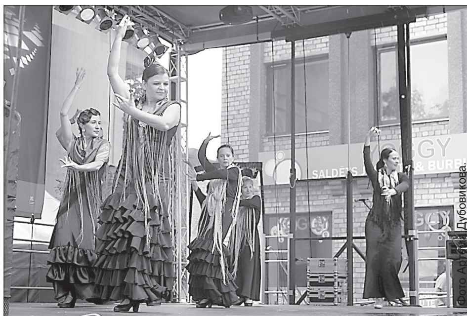
Студия танца фламенко «Un Dos Tres».

В два часа дня состоялось праздничное шествие предпринимателей и производителей Даугавпилса. В нем приняли участие около 40 крупных и небольших местных предприятий. Самыми многочисленными были ряды लोकомоторемонтного завода, предприятия «Latvijas Maiznieks», автобусного парка, медицинского колледжа, торговой школы. Многие подошли к ответственному выходу с фантазией: придумывали интересные костюмы и другие креативные ходы.