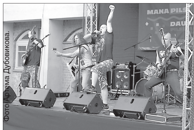
Даугавпилсская треш-металл группа «Asthma».

В воскресенье торжества продолжились. В течение всего дня работала ярмарка. На площади Виенибас, в парке Дубровина и во дворе музея выступали латвийские и приезжие коллективы, работающие в самых разных музыкальных стилях. Среди них популярные груп-