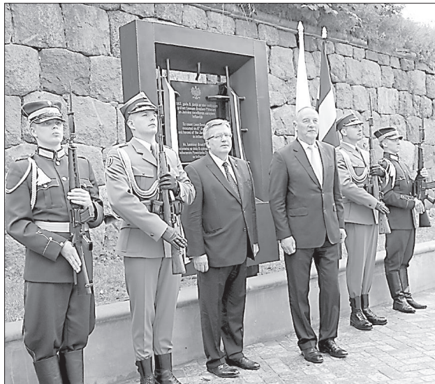
Президенты поклонились памятной плите.