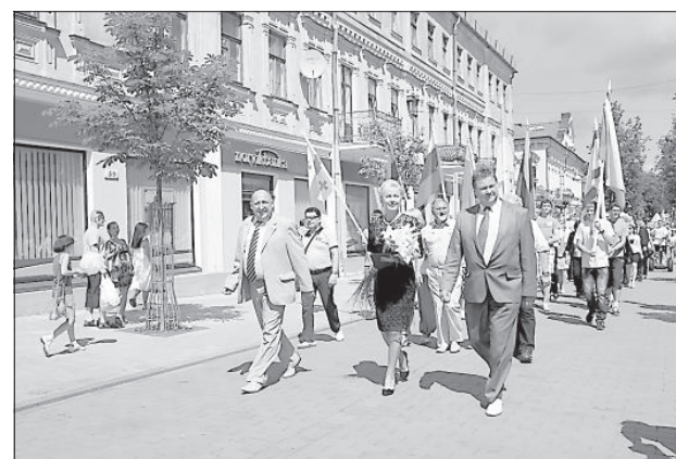
В праздничном шествии приняли участие около 40 предприятий и учебных заведений Даугавпилса.