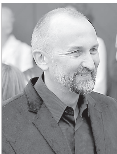
Автор монумента Ромуальд Гибовский.

Елена Иванцова 9 июня Даугавпилс и Даугавпилсский край посетили сразу два высших должностных лица – президенты Латвии и Польши Андрис Берзиньш и Бронислав Комаровский.