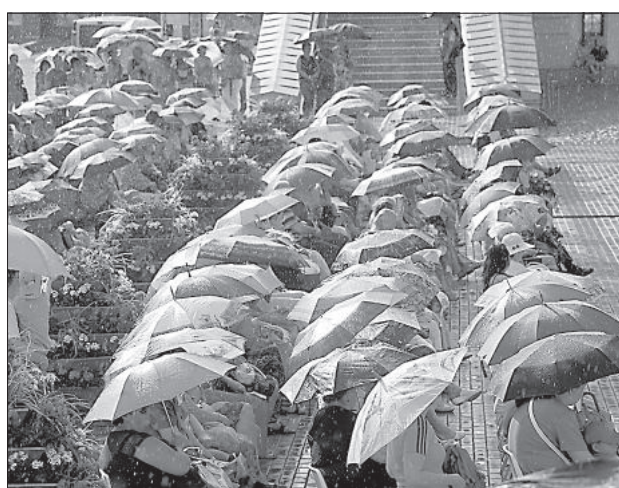
Даже дождь не помешал концерту в крепости.

После дневной грозы на небе вновь засияло солнце, чтобы ничто не помешало еще невиданному для Даугавпилса зрелищу. С праздником города даугавпилчан поздравили летчики из Тукумса из группы «Балтийские пчелы». Авиашоу реактивных самолетов «L-39» над Даугавой никого не оставило равнодушным.