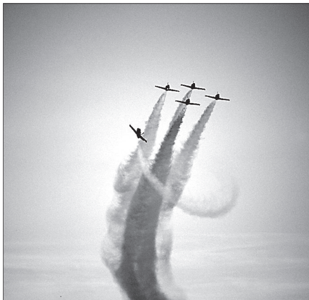
Самолеты взмыли на 100 метров над рекой.

Даугавпилс отметил один из самых грандиозных дней рождения за последние годы.