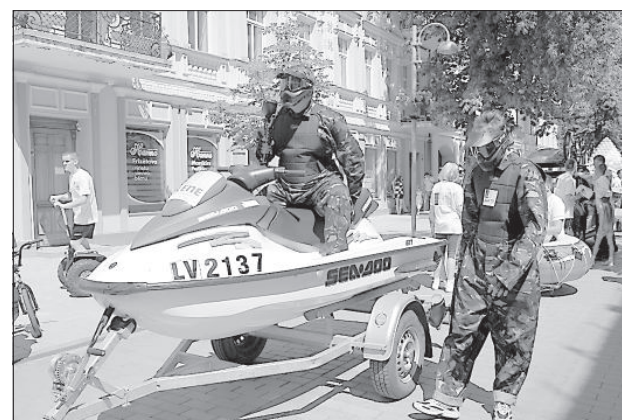
Экипированные для игры в пейнтбол работники базы отдыха «Силене».