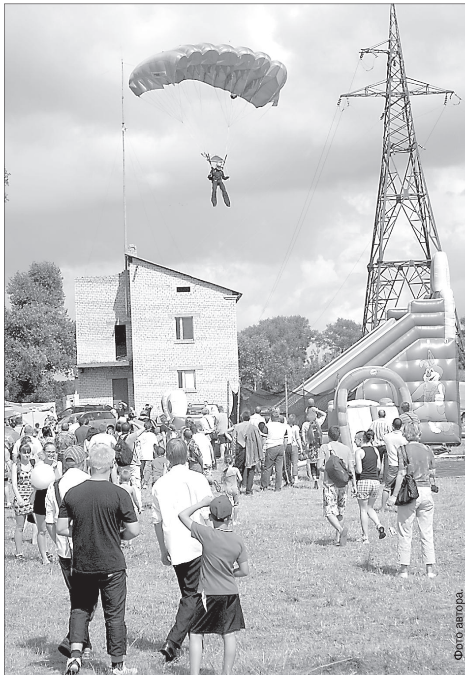
Парашютисты команды Вооруженных сил Латвии приземляются точно в цель.