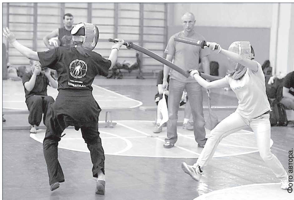
Поединок в женской категории.