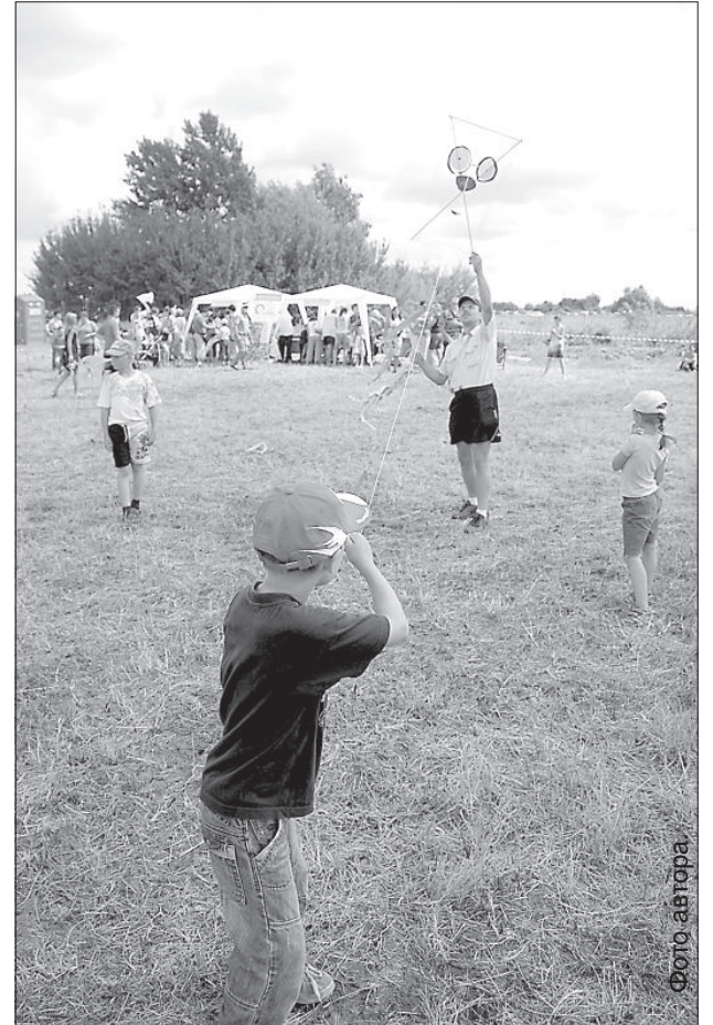
Участникам не всегда удавалось обойтись без помощи взрослых.

ежегодным и будет соби- рать все больше и больше зрителей, а его программа — с каждым разом еще более увлекательной и ин- тересной.