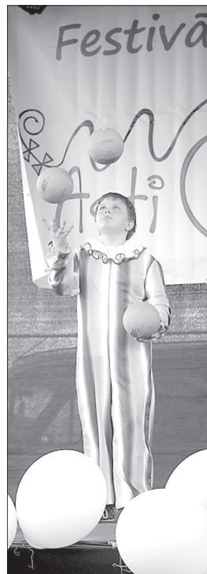
Артист Даугавпилской цирковой студии.