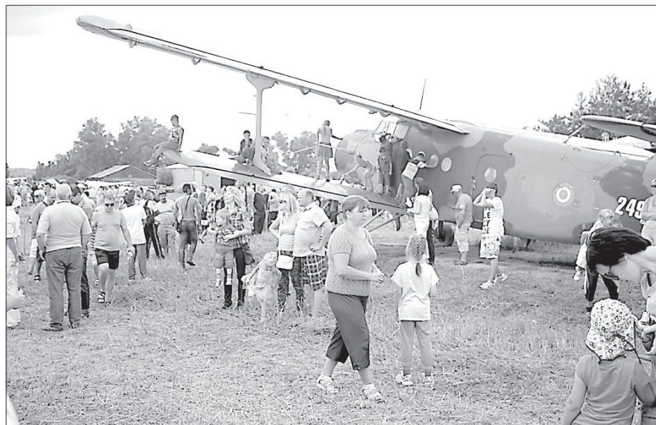
От палящего солнца можно было спрятаться под крылом самолета.