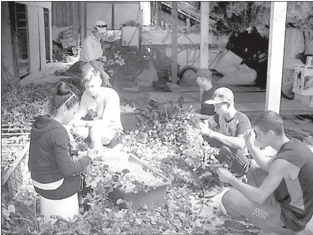
Школьники собирают цветки липы.

Многие хозяйства занимаются зерноводством или молочным животноводством, а у крестьянского хозяйства «Курмиши» Удришской волости Краславского края – свой, особенный выбор.