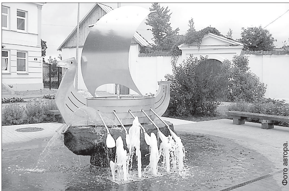
Краслава в ожидании праздника города.

Краслава — спортивный город. В 10.00 в парке начнется футбольный турнир, а