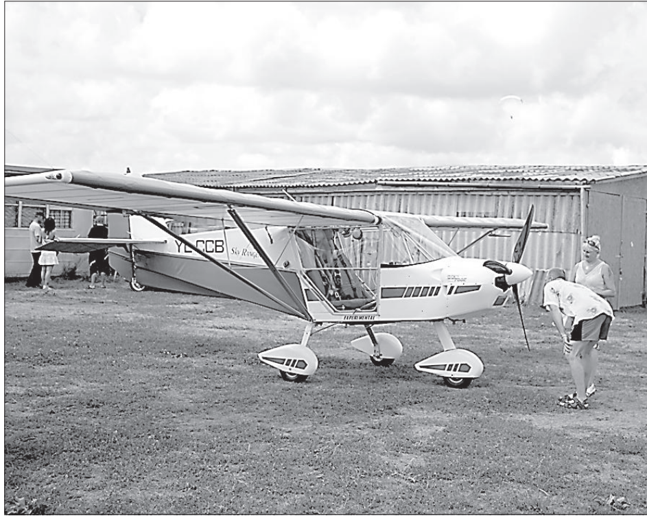
Зрители с интересом изучали различные модели самолетов.

Конечно же, все внимание гостей праздника приковали показательные выступления. Здесь были и точечные и скоростные приземления парашютистов, фигуры высшего пилота-