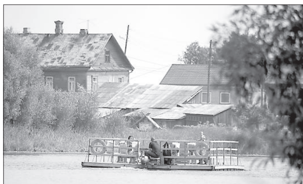
Прогулка на плоту.