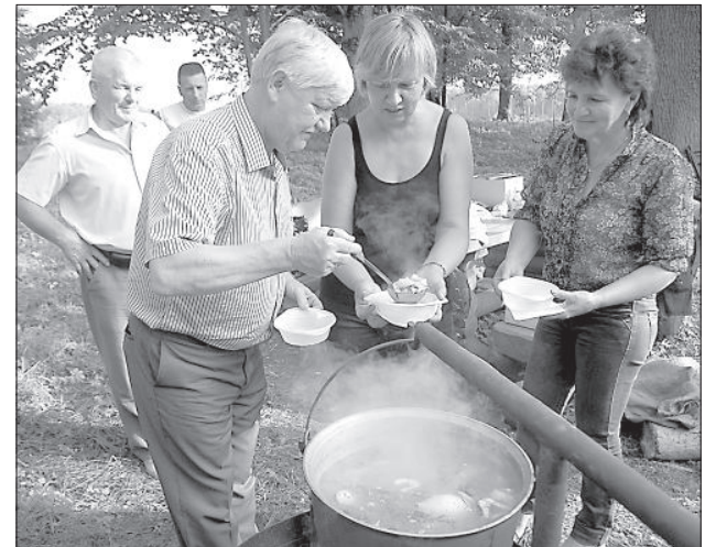
Всех угощали ухой.

Лучшим участником спортивных соревнований были вручены стеклянные кубки и дипломы, подготовленные волостным управлением. Веселыми песнями праздник украсил фольклорный коллектив Даугавпилсского литовского общества «Раса». До раннего утра можно было танцевать в ритмах диско. ■