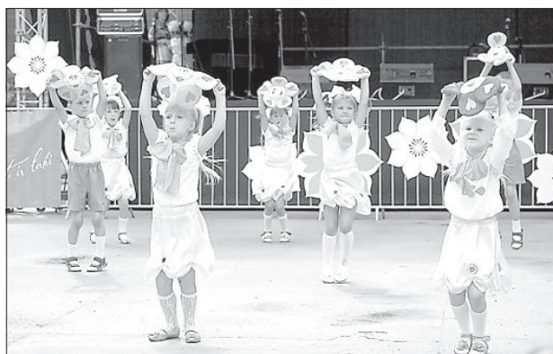
«Цветочный танец» от воспитанников детского сада.