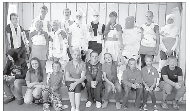
Ребята на параде нарядов из туалетной бумаги.