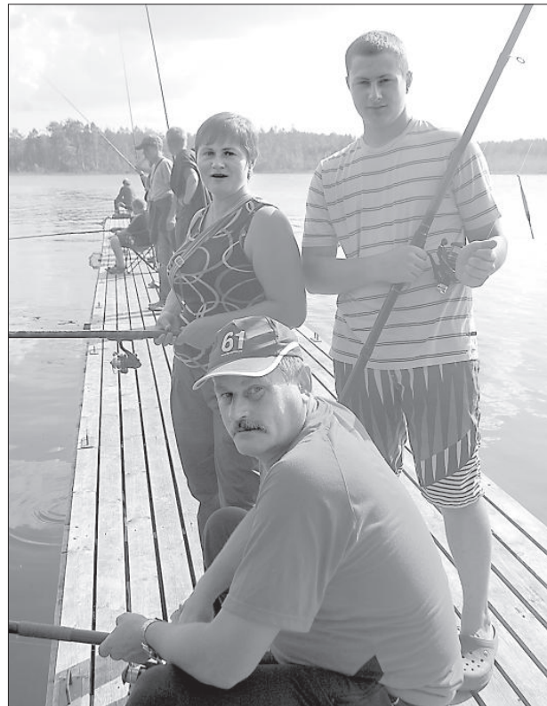
Семья Дубовских из Демене — среди лучших рыболовов.