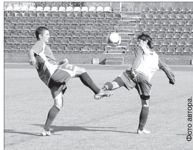
BFC „Daugava” в отсутствие соперника сгоняла двусторонку.

Чемпионат Германии ещё только готовится к старту, в минувшие выходные прошли кубковые матчи страны. «Гамбург» в первом круге разгромил «Schott Jena» – команду пятого дивизиона со счётом 4:0. Дублем отметился Артём Руднев. ■