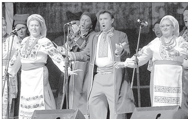
Украинцы быстро разогрели публику.