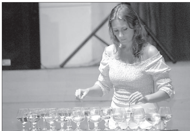
Музыка Моцарта, исполняемая на винных бокалах.