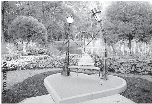
Влюбленные фонарики для всех любящих сердец.