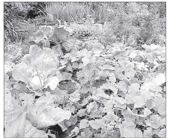
На маленьких участках овощные культуры соседствуют друг с другом.

«Участок у нас всего 6 соток, а ведь, кроме огорода и сада, нужны хозяйственные постройки. Я пытаюсь сажать много разных