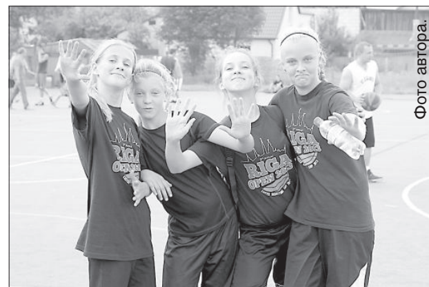
«Чёрная борода» вновь первые.

Вся борьба за звание чемпиона города ещё впереди. Следующий этап пройдёт 24 августа на площадке около средней школы №16, заключительные два этапа пройдут в центре Даугавпилса в сентябре. ■