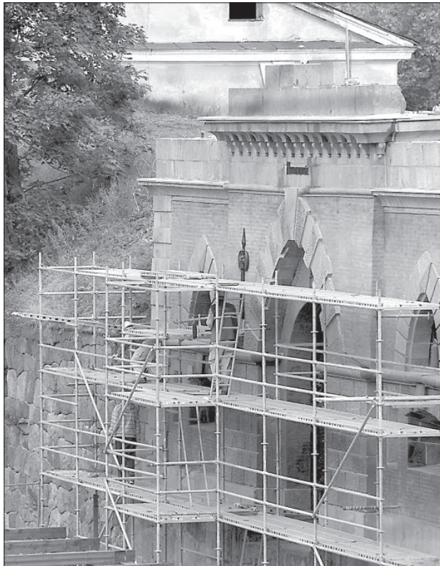
Фасад южной стороны Николаевских ворот.