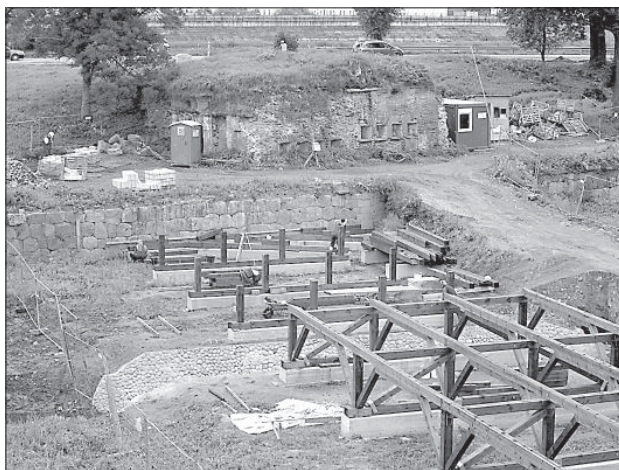
Строители завершают возведение опор будущего моста.