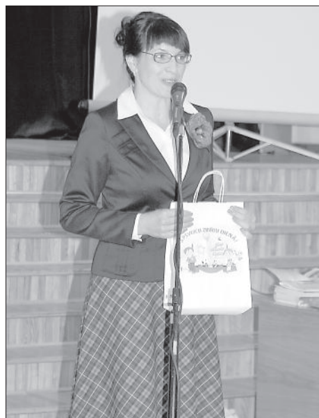
Директор школы свой наряд подобрала в соответствии со школьной формой.