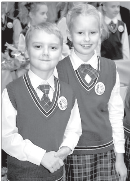
Школьную форму будут носить все ученики начальной школы.