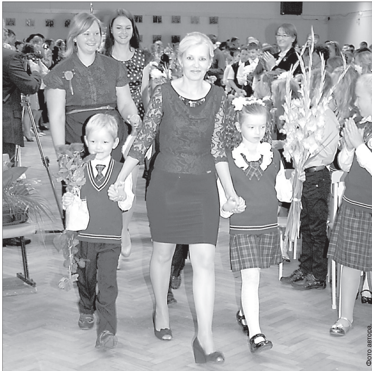
Первоклашки заходят зал.