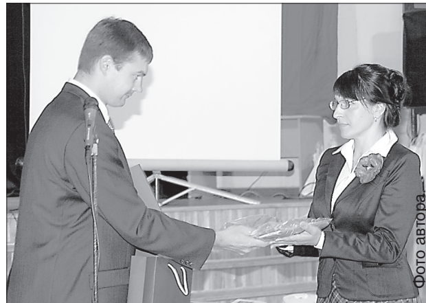
П. Дзалбе дарит школе флаг города.

За форму платят родители. Например, праздничная форма стоит примерно 30