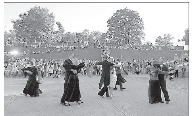
Танго над городом.