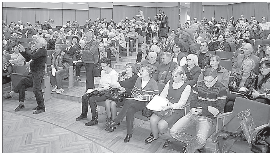
Встречи с представителями ПЖКХ всегда вызывают у даугавпилчан большой интерес.

«ПЖКХ нужно заниматься решением глобальных вопросов, а не сколками жильцов, которые не могут договориться. Очень важно привести в порядок производственную базу. Сей-