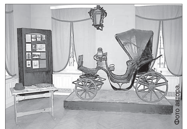
В постоянной экспозиции музея тоже можно найти предметы, связанные с профессиями.

Учащиеся с интересом отнеслись к выставке. Многие из них, например, никогда не видели безмена и не знают, как им пользоваться. После экскурсии