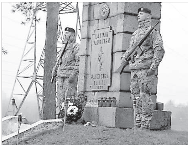
Почётный караул в День Лачплесиса.