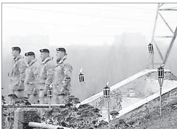
Факелы горят в память о павших в боях за независимость.