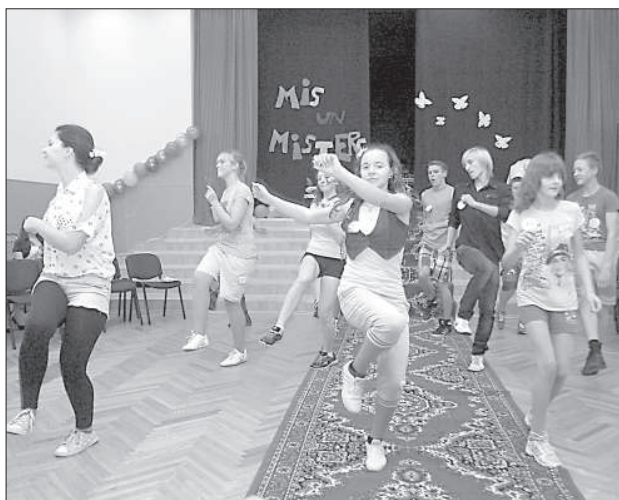
Конкурсанты во время танцевального конкурса.

Началась подписка на газету "Латгалес Лайкс"!