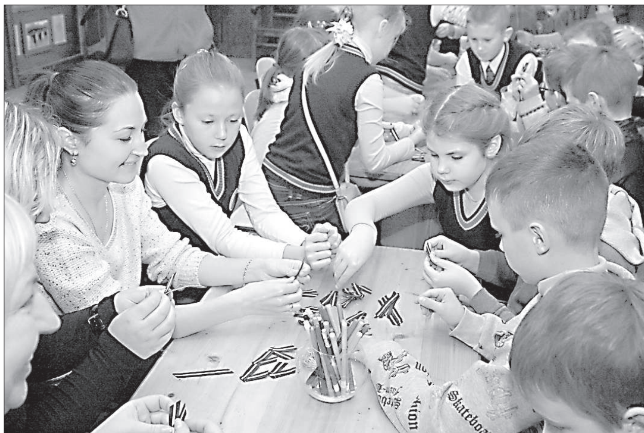
Школьники активно складывали ленточки.