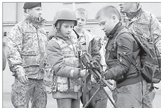
К бою готовы!

реть каску и разгруз, оценить вес боевого оружия, посмотреть в боевой бинокль. Ребята с восторгом в глаза рассматривали оборудование, пробовали вести переговоры по армейской рации.