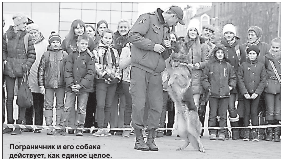
Пограничник и его собака действует, как единое целое.