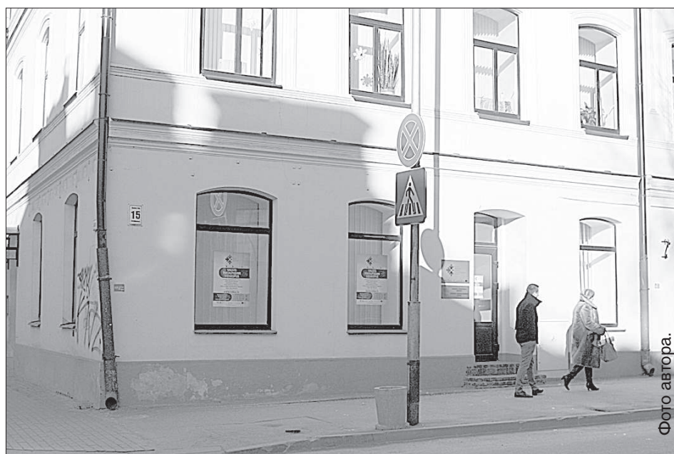
Новый центр на ул. Саулес в Даугавпилсе.