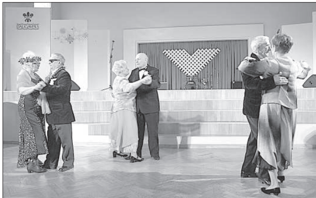
Конкурс «Самый красивый вальс».