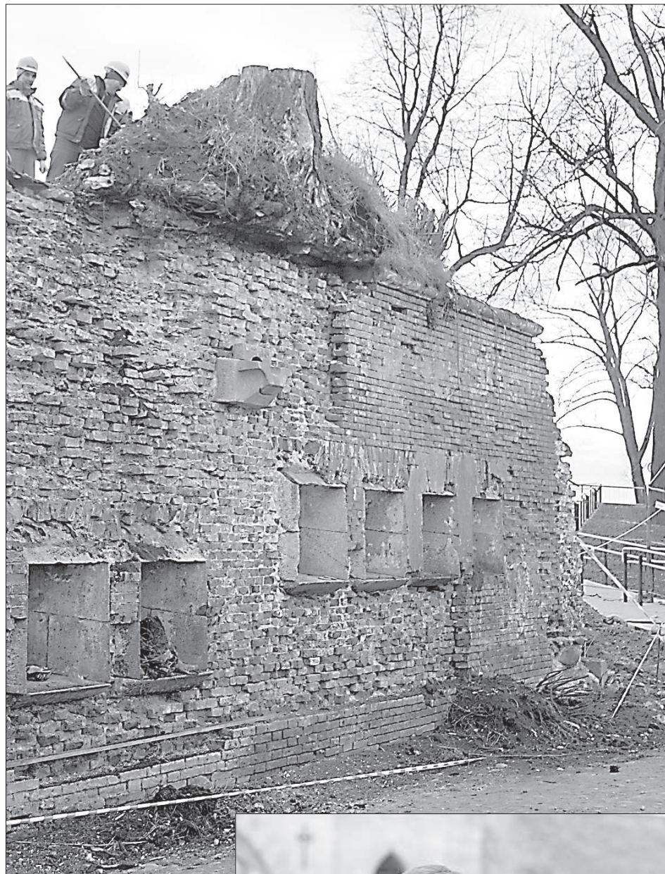
Строители убирают грунт и деревья.

В рамках этого проекта 75% всех средств предусмотрено на так называемую «твердую часть проекта»: строительные работы и связанные с ними технический и авторский надзор. Запланированы также различные мероприятия по развитию туризма и маркетинга крепости. В частности, разработка туристического маршрута, соединяющего Латгалию и Гродненщину, издание туристических буклетов, реклами-