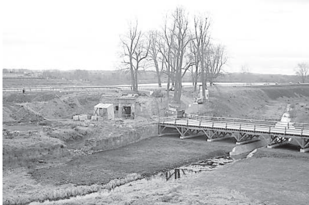
На объекте уже кипит работа.