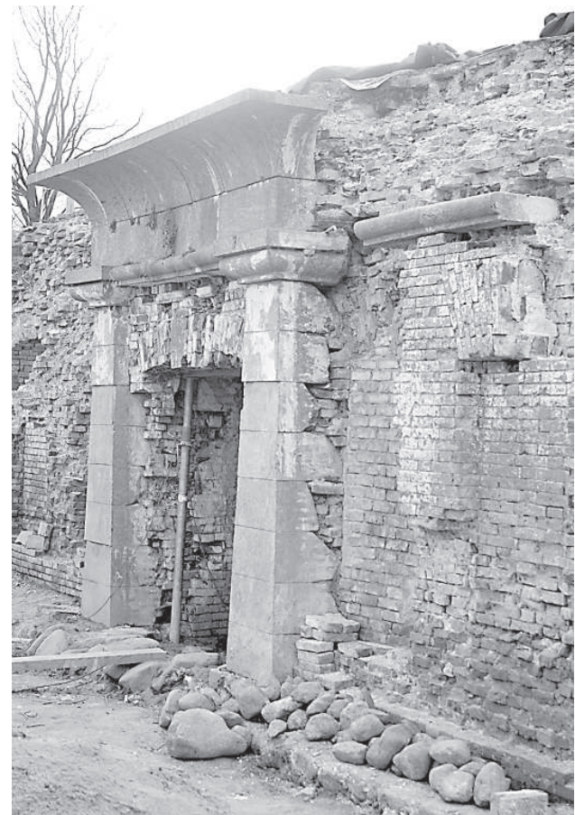
Вход в кордегардию.

«Сейчас сложно говорить о дальнейшем развитии крепости, так как начинается новый период планирования. Нам нужно планировать новые объекты, создавать техническую документацию, для этого требуется время. Предполагаем, что в крепости пока будет затишье», — поделил-