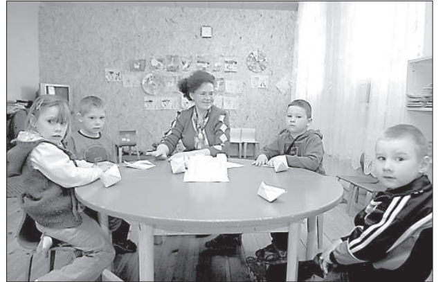
Пятилетки и шестилетки занимаются в малом зале.

Эгита Терезе Йонане Сто учеников Бикерниекской основной школы переехали учиться в свой временный дом – волостной Дом культуры, пока в родном здании идут масштабные работы по реконструкции и утеплению.