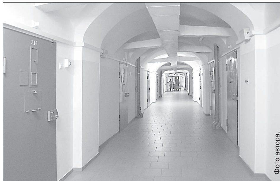
1-й и 2-й этажи отремонтированы.

Байба Брока сказала, что слышала об этой истории, и выразила искреннее сочувствие родителям, однако как министр юстиции не имеет права вмешиваться в процесс, министерство отделено от исполнительной власти. Она вспомнила тра-