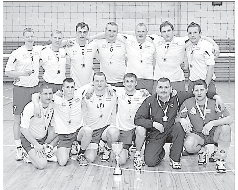
Чемпионы Даугавпилса-2014 – «Погранохрана».

Игра складывалась тяжело. Воспитанники спортшколы выиграли первый сет, но соперник отыгрался, затем вышел вперёд. При результате 1:2 они смогли переломить события и выиграть первую встречу – 3:2. Однако в ответной игре «Kalnupõpoli.lv» исправил ситуацию – 3:0. В «золотом сете» команда «Kalnupõpoli.lv» дождала со-