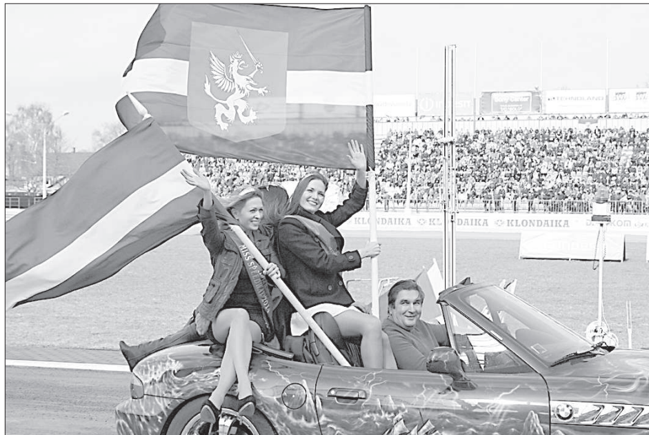
Новые «Мисс спидвей».