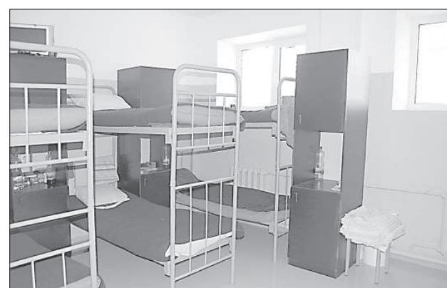
Отремонтированные камеры, в каждой есть телевизор.