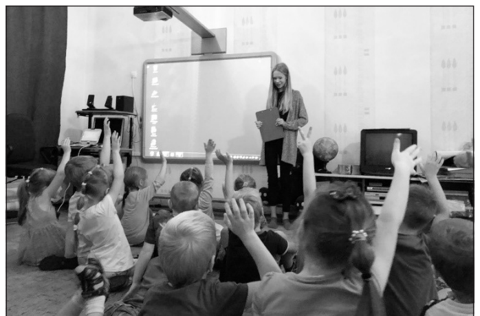
Eko padome PII "Māllēpīte"