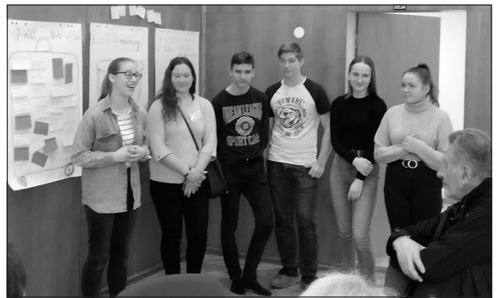
Projekta sanāksmē aktīvi iesaistījās Mālpils novada vidusskolas skolēni