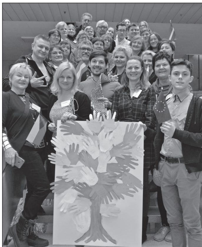
Kopā ar mālpiliešiem