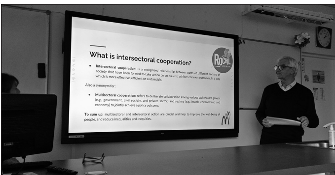
Zināšanu un pieredzes apmaiņa