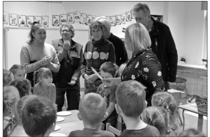
Darbošanās kopā ar Mālpils PII "Māllēpīte" bērniem