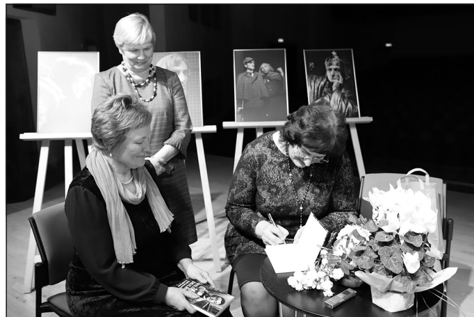
Autores autogrāfs arī Mālpils novada bibliotēkas eksemplārā