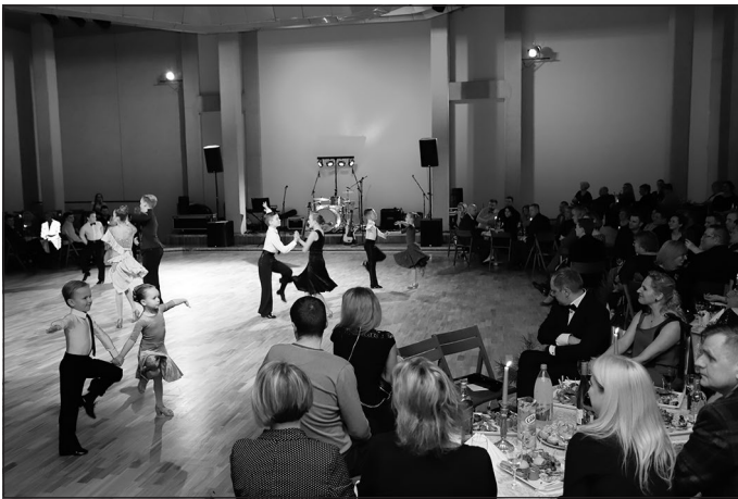
Uzstājas Sporta deju kluba "Zīle" dejotāji