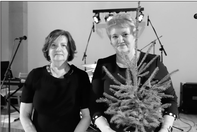
SIA "SP FOODS", Santa Strazdiņa