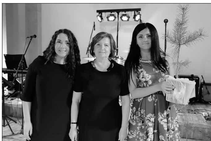
SIA "HB TEXTILES LATVIA"