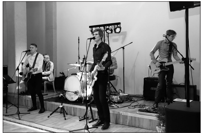
Balli spēlē "Zelta kniede"