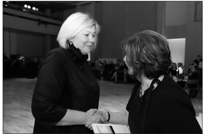
"ANIMA CANDLES", Sirja Neimane