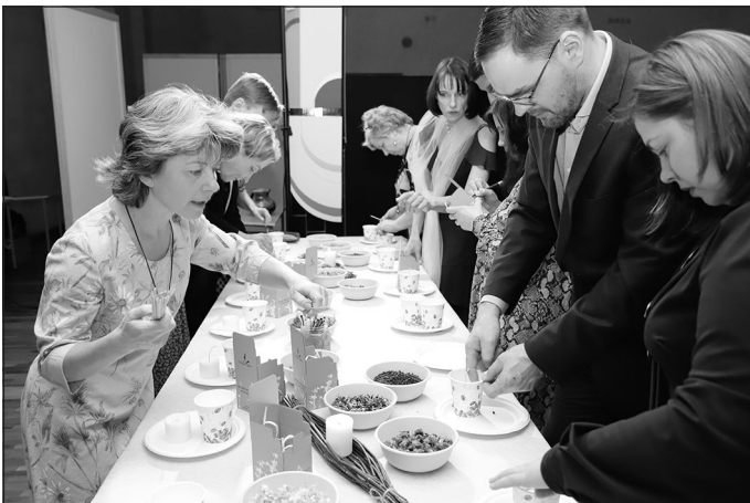
Sveču liešanas darbnīca