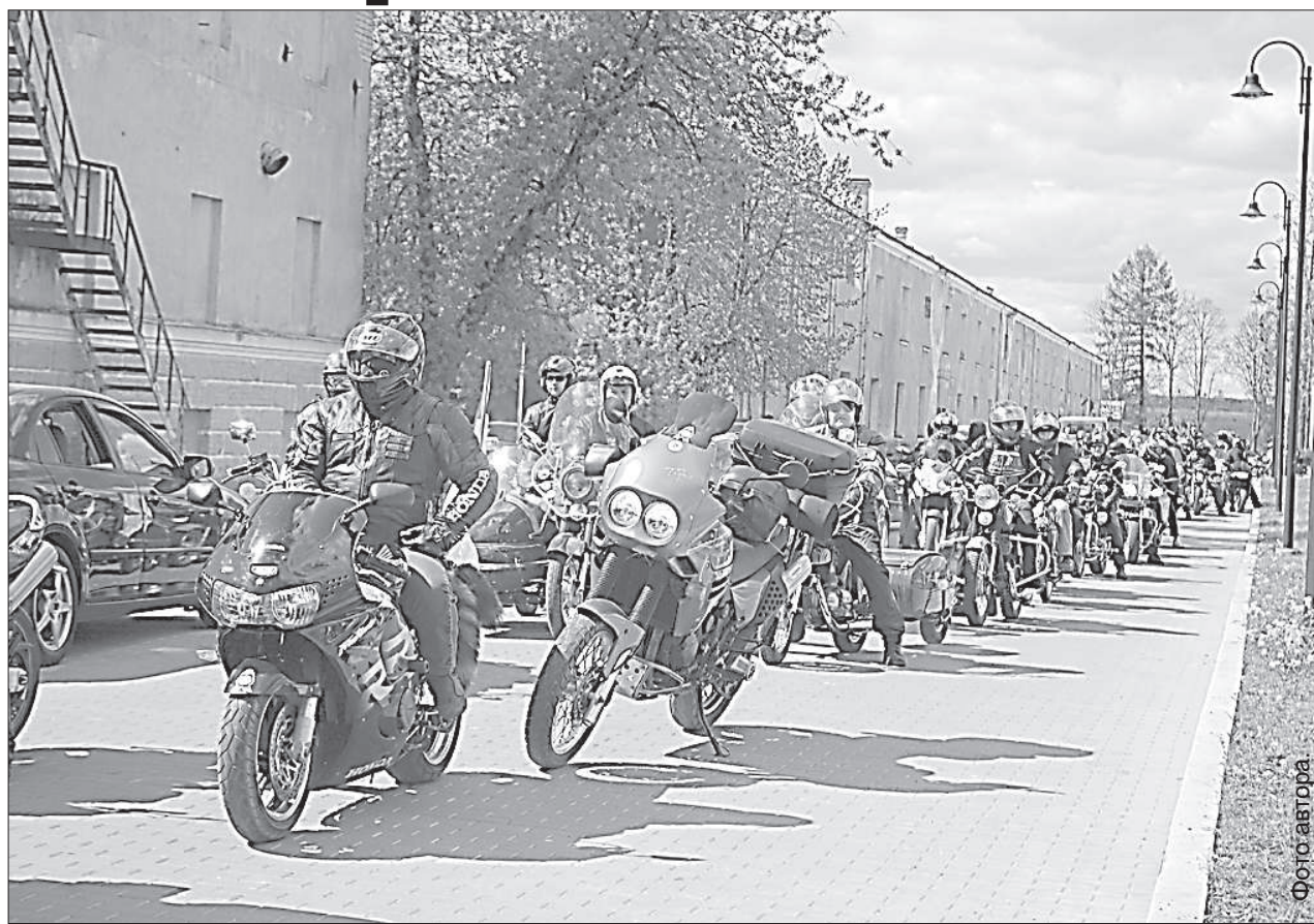
Байкеры отправляются в дорогу.