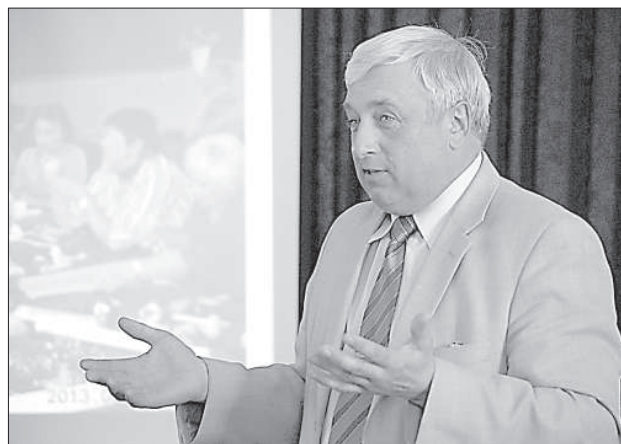
Руководство края представлял Арвид Куцинс.

вать их крестьянам, которые охотно приобретут данную землю. В выгоде будут все – и владельцы земли, и арендаторы. Увы, далеко не все владельцы земель платят налоги, долг одного из них достиг 1,5 тыс. евро, и вопрос придется решать с помощью судебного исполнителя.