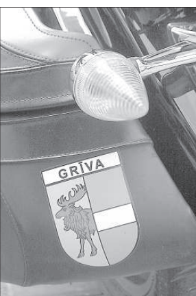
По наклейкам можно узнать, откуда приехал мотоциклист.