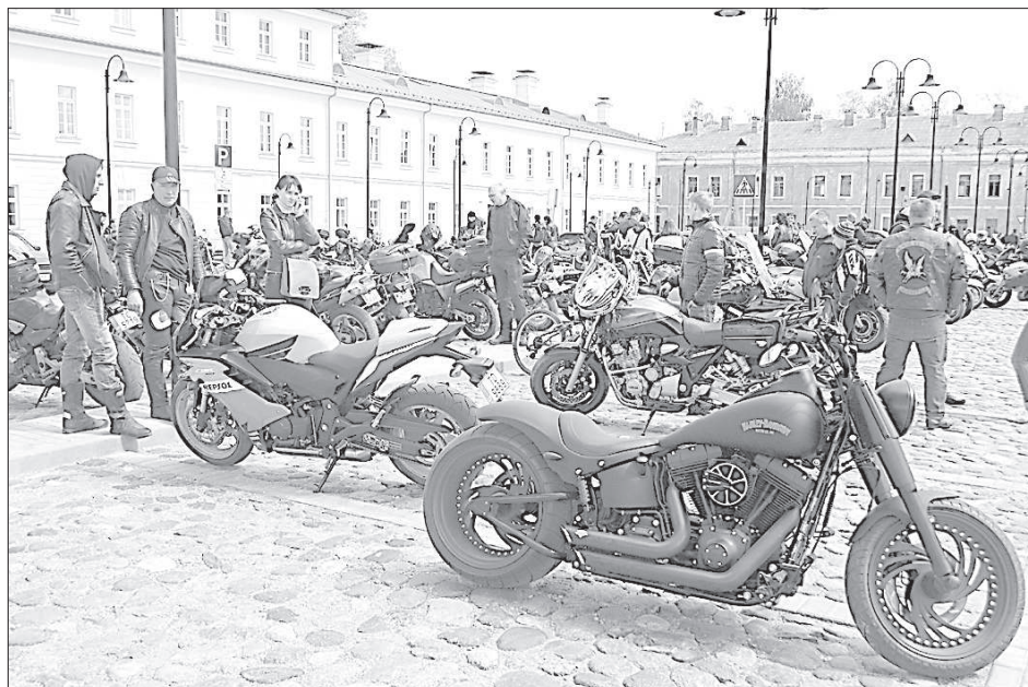
Новый «Harley Davidson».