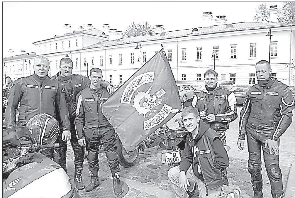
В дорогу отправляются мотоциклисты клуба «Urban Bullets».

Большинство зрителей в этот день пришли посмотреть на парад уникальных, старых и новых мотоциклов. Проехав почти 200 км по маршруту Прейли – Ливаны – Пилскальская волость Илукстского края, на базе отдыха «Dubezers» байкеры соревновались в конкурсах и наслаждались блюдами латгальской кухни.