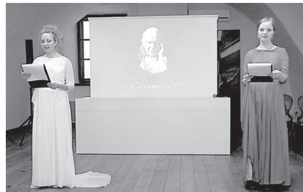
Рассказ Милены и Кристины об Иоанне Павле II.

Интересно, что Иоанн Павел II изображен сидящим с открытой Библией в руках, открытую страницу украшают слова Евангелия от Иоанна «Вначале было Слово». Это единственный монумент (там же находятся памятники Леонардо да Винчи, Юрию Лотману, Махатме Ганди, Джойсу и другим), возле которого установлены две скамьи,