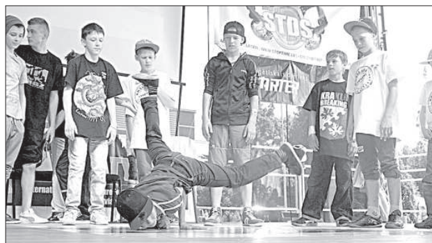
Даже во время разминки ребята успевают продемонстрировать разные «фишки».

24 мая в Центральном парке около ледового дворца, а также на территории скейтпарка, проходил 6 международный фестиваль уличной культуры «Urbanstyle 2014».