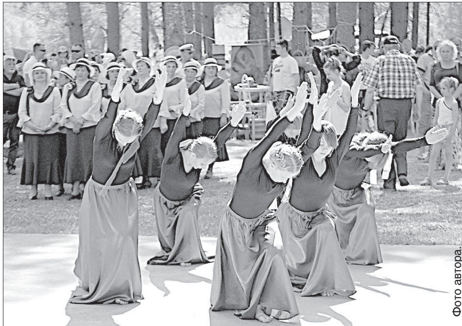
Танцевальный коллектив Силенского Дома культуры «Tornado».