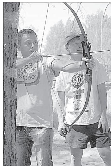
Посетители фестиваля участвуют в разных аттракционах.