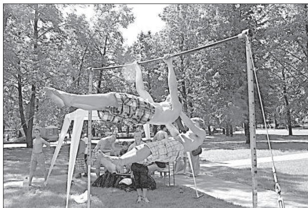
Мастерство уличных гимнастов растет год от года.

Впервые в рамках фестиваля был организован специальный «марафон» с дистанцией 1,5 километра, в котором могли принять участие все желающие. По традиции фестиваль объединил такие направления, как экстремальные виды спорта, стритбол и уличную гимнастику, граффити, – танцы и многое другое. Многие направления были представлены в виде соревнования, другие же, – как эффектные шоу и мастер-классы. ■