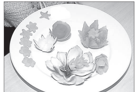
Украшения из овощей.