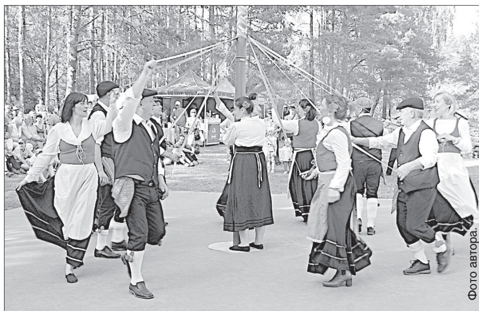
Танцует итальянский коллектив.

На фестивале отметили еще два культурных знака, которые завтра или послезавтра тоже кто-то вплетет во фрагменты покрывала. Это начало на-