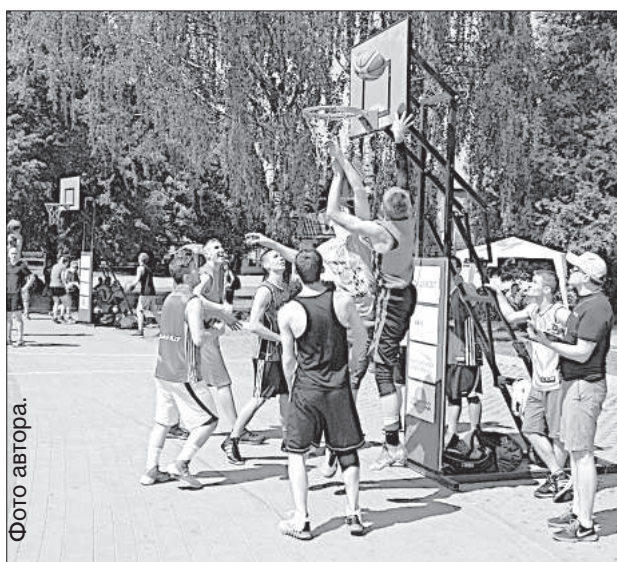
Одним из главных составляющих фестиваля являются соревнования по стритболу.