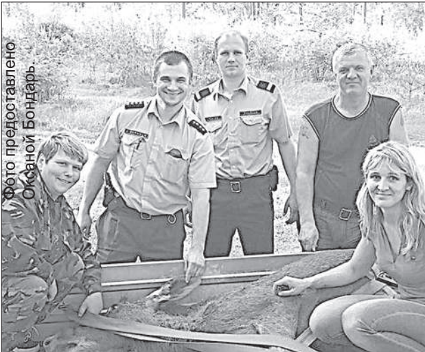
Операция по спасению лосенка прошла успешно.

В пятницу рано утром в Даугавпилсе прошла настоящая спецоперация по спасению маленького лосенка, который забрел в город. Зайдя в подъезд дома около Даугавпилсского центра детского здоровья, животное оказалось в ловушке, и извлекать его оттуда пришлось силами многих служб.