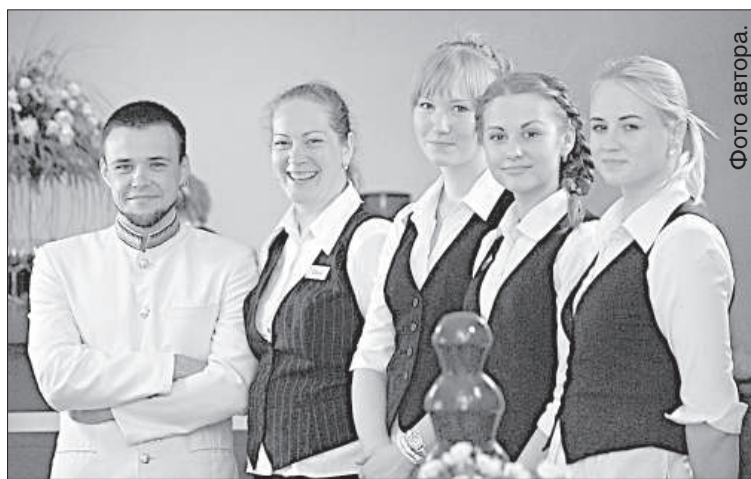
Коллектив ресторана «Арсенал».