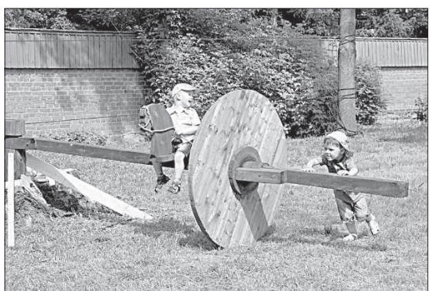
У детей на фестивале свое занятие.

то уставший рыцарь отдыхает тут же возле костра, другие после сытного обеда уснули прямо за столом. В лагере царит веселье, мужчины обсуждают ход турнира, а женщины отвечают за хозяйство, они суеются возле котлов, столов, присматривают детей и ухаживают за своими бойцами.