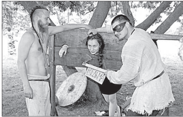
Зрители могли ощутить, что значит, когда пытаются.

На улице – жара в 30 градусов, поэтому все ходили в льняных одеждах. Какой-