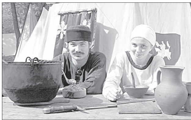
Клуб «Isangrim» приглашает на обед.