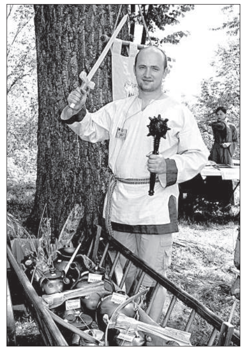
На ярмарке можно было приобрести боевые средства.