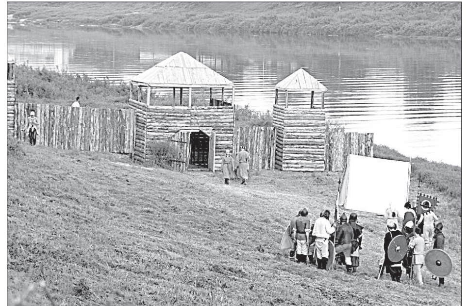
Театрализованное взятие крепости.

Среди рыцарей особенно выделяются мужчины в