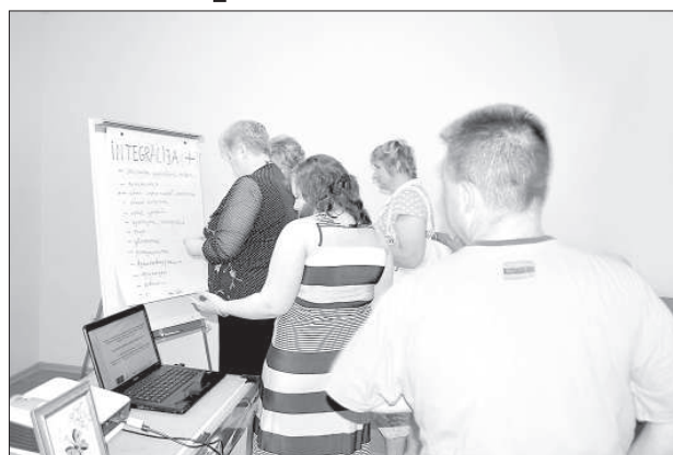
Участники мероприятия в Дагде оценивают «плюсы» интеграции.

Общество «Baltā māja» продолжает осуществление подержанного Европейским фондом интеграции поданных третьих стран проекта «Обучение и мероприятия для вовлечения поданных третьих стран в процессы развития сплоченного общества в Латгальском регионе» (договор о гранте № IF/2012/1.a./11). Цель проекта — способствовать процессам интеграции в Латгальском регионе.