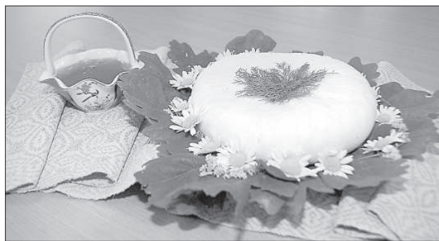
Сыр Яновых детей.

лаем так, как рассказала Мария, то уже через 3 часа сыр можно будет ставить на стол или нести в гости. Чтобы был такой же большой круг, как виден на фотографии, понадобится 10 л свежего молока. Молоко наливают в кастрюлю, добавляют 3 чайные ложки соли и томят на небольшом огне. Когда молоко согреться до 35 градусов, то в молоко постепенно добавляют 3-4 взбитых яйца. Далее, когда молоко нагреется до 75-80 градусов, добавляют большую ложку уксусной эссенции. В короткое время сырная масса поднимется (сырная масса поднимается вверх), тогда следует выключить огонь, сыр проце-