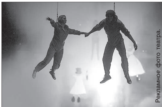
Рекламное фото театра.

17 июня были названы номинанты профессиональной театральной награды Латвии «Spēlmaņu nakts» в 17-ти категориях.