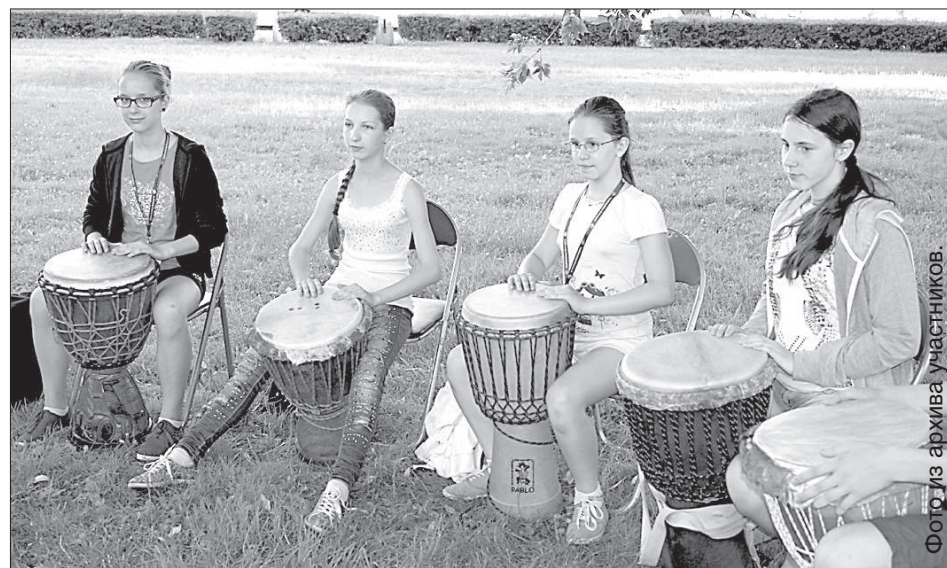
Мастер-класс на африканских барабанах.

Коллектив «Кукулочка» выражает огромную благодарность Посольству Республики Польша в Риге и Министерству иностранных дел Польши за финансовую поддержку.