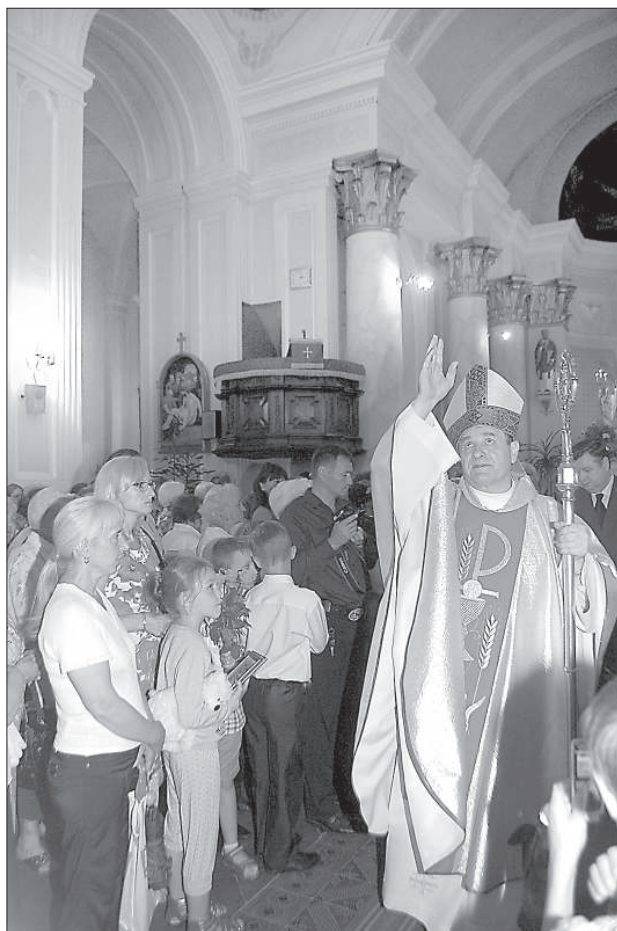
Благословение приходу и хористам.