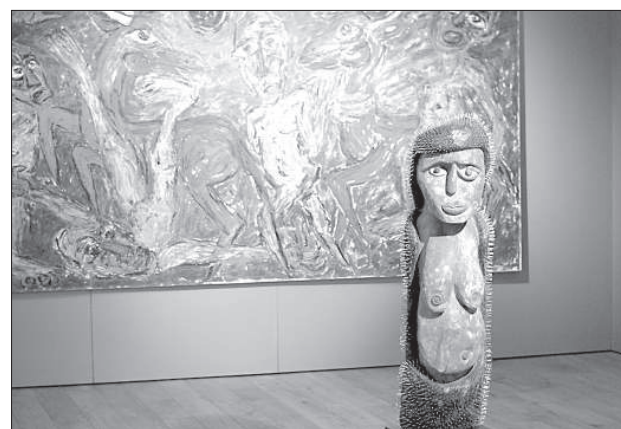
Работы рижского художника.