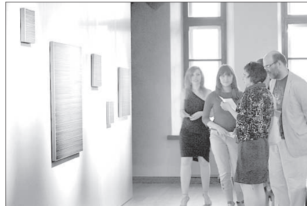
Зрители у работ норвежца.

Летом наши горизонты расширяются: кто-то путешествует, кто-то любит природу. Вот и норвежский художник шведского происхождения Ларс Странд тоже занимается исследованием горизонтов. Изучая цвет как таковой, художник создает работы, которые издавна кажутся однотонными, однако вблизи они становятся многоцветными, различными по текстуре. С первого взгляда кажется, что работы Странда, объединенные названием «За горизонтом» — лишь однотонные холсты, но это впечатление обманчиво, и отсутствие лиц и предметов на полотне заставляет зрителя испытывать интересные, не повседневные эмоции. Ларс Странд был в Даугавпилсе несколько лет назад, тогда он, как и многие другие, не мог до конца поверить, что центр Ротко начнет успешно работать.