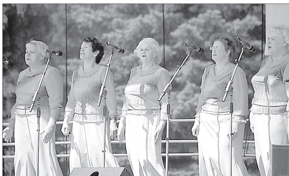
Выступает ансамбль «Kamenes».