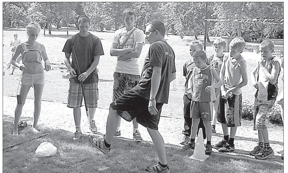
Малиновская молодежь готовится к броскам в цель.