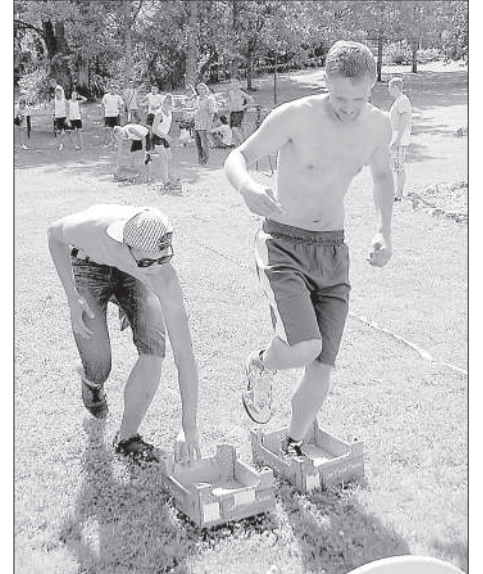
В эстафете используются ящики для фруктов.