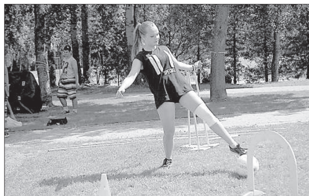
Футбольный мяч может быть неуправляемым.