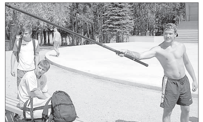
Свентская молодежь ловит «рыбу».