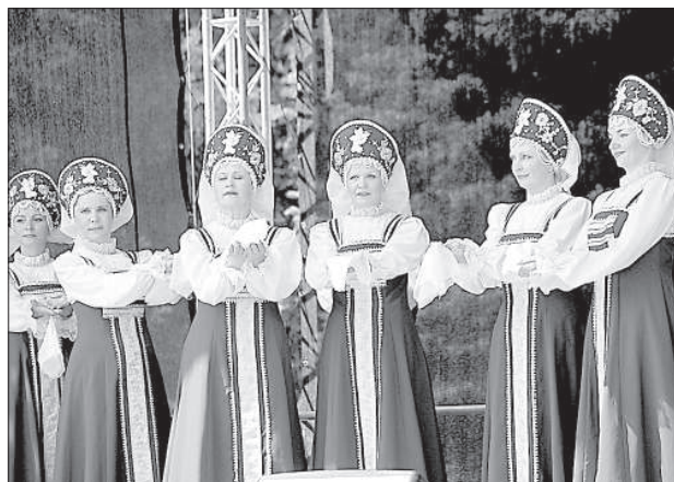
Выступает ансамбль «Псковские кружева».

кварталы центральной части. Восстанавливали город все жители.