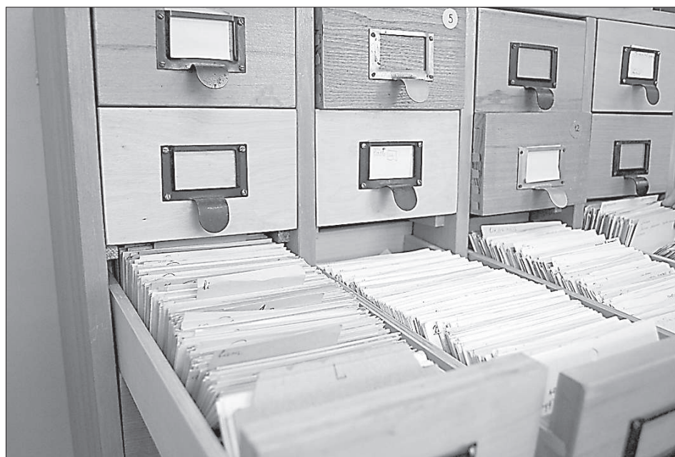
В картотеке около 200 тыс. карточек.