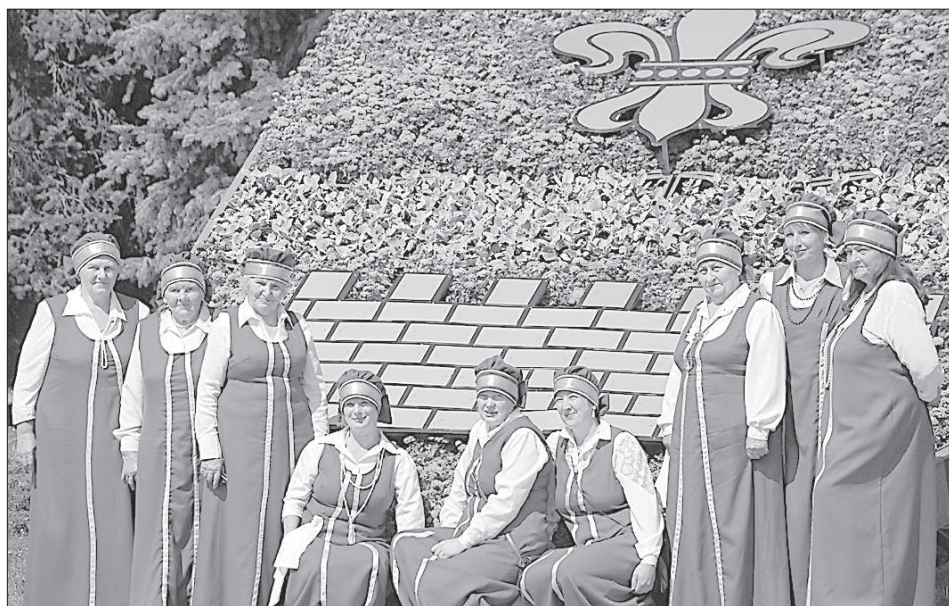
Коллектив «Сударушка» из Виляки фотографируется на фоне герба Даугавпилса.