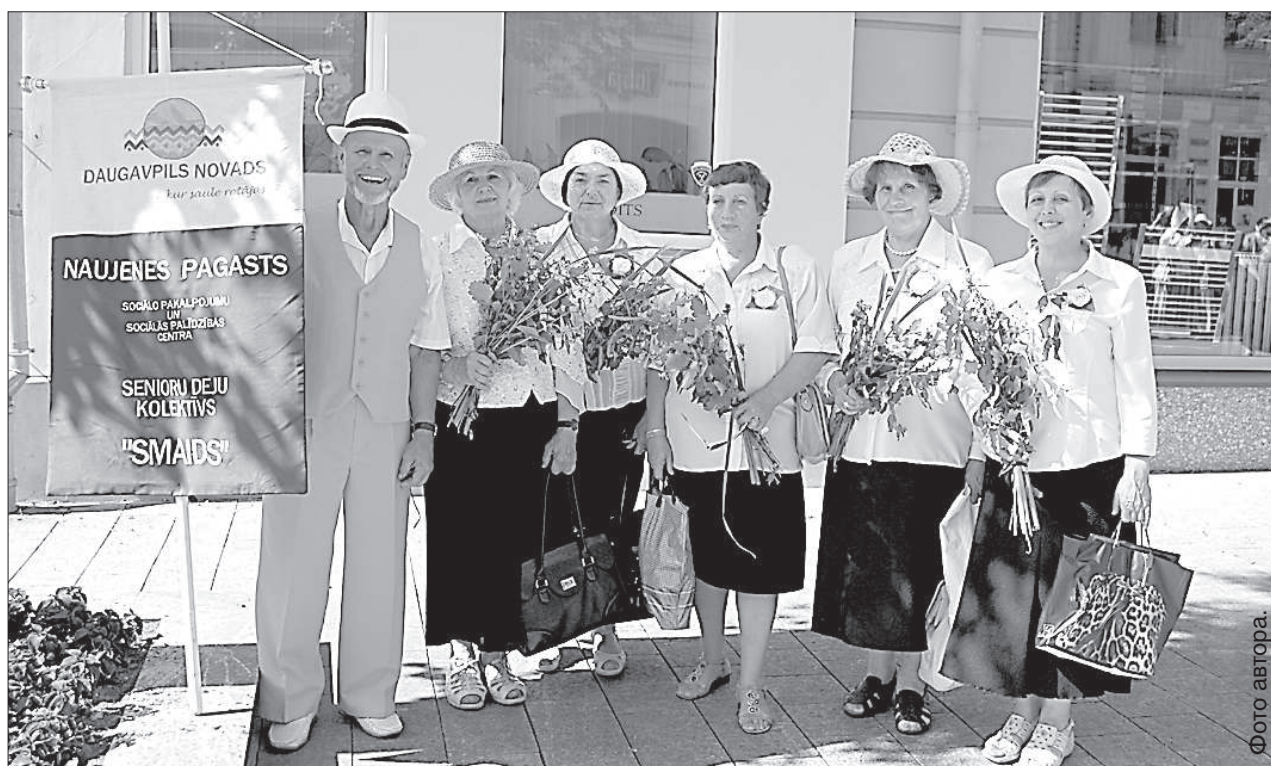
Улыбаются участники коллектива «Smads».