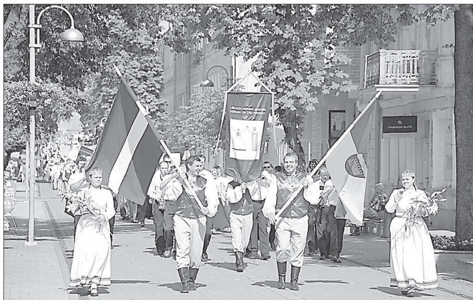
Шествие по ул. Ригас.

Несмотря на июльский зной, на концерт коллективов на площадь Виенибас пришли зрители.