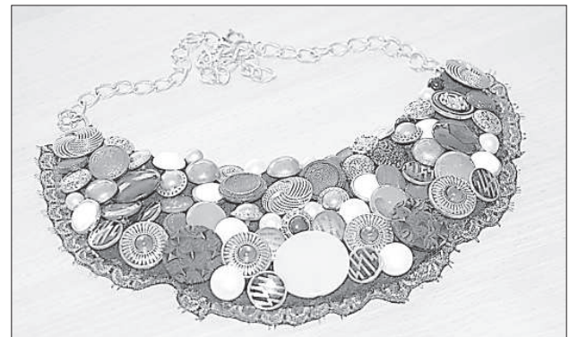
Ожерелье из пуговиц.