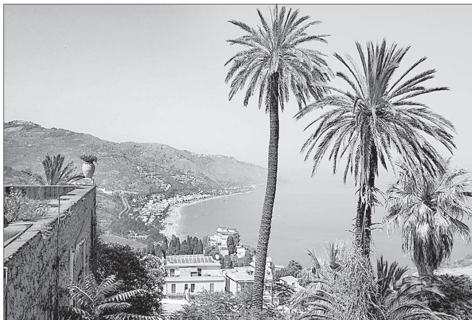
Жизнь у подножья вулкана.

Издали кажется, что домики, словно прилепленные к скале на высоте одного-двух километров, вот-вот обвалятся вниз, но когда оказываешься среди