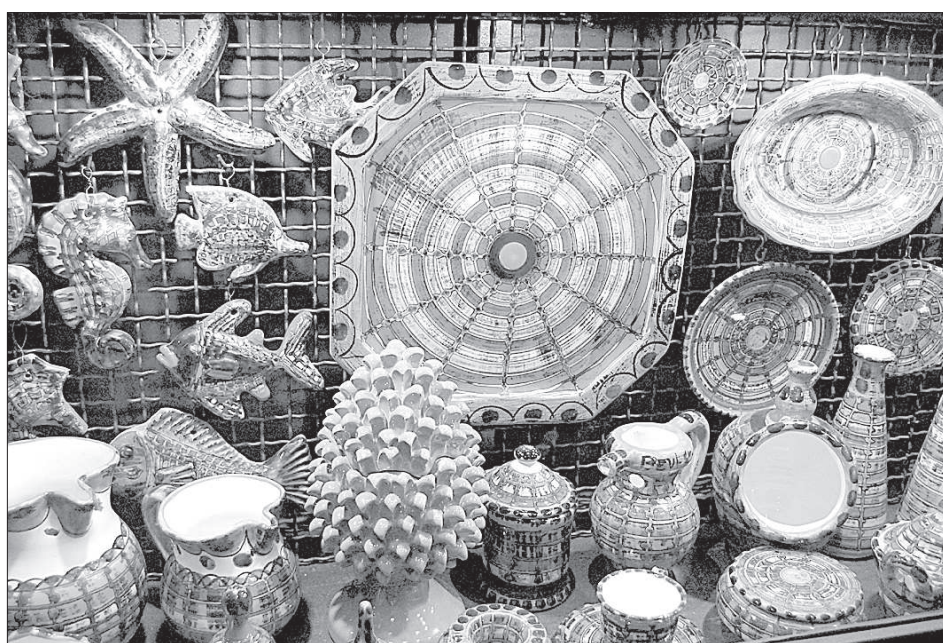
Сицилия славится посудой с ручной росписью.

Вся жизнь обитателей восточной части острова неразрывно связана с вулканом Этна, сицилийцы относятся к нему как к живому существу.