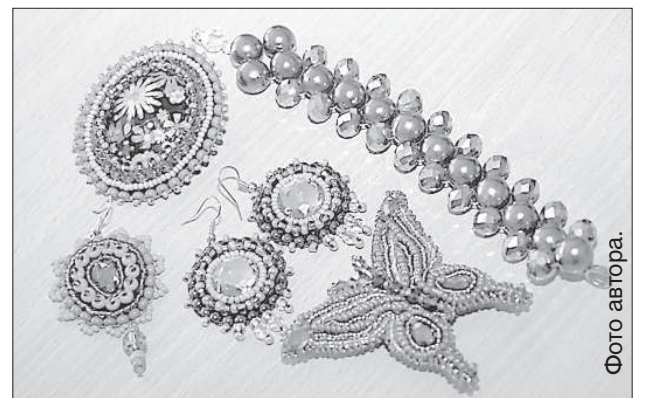
Украшения на любой вкус.

каждый день ее руки заняты новой работой. Папа часто подшучивает над ней: мол, Лиене, «опять делаешь свои побрякушки». Сама Лиене свои украшения каждый день не носит, потому что они кажутся ей слишком особенными, подходящими только для праздничных выходов.