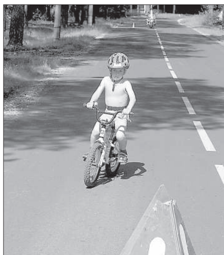
Юный возраст – не помеха!