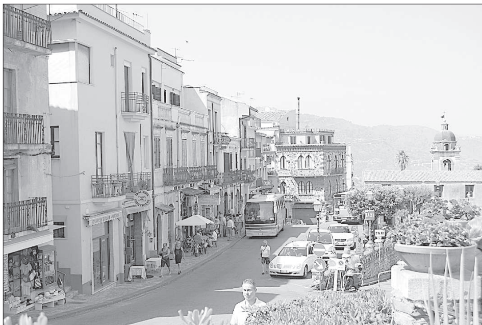
На улочках города Таормина.