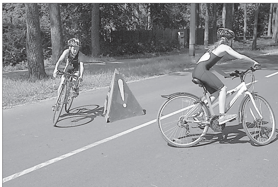
Велогонка на дистанции для самых юных участников.