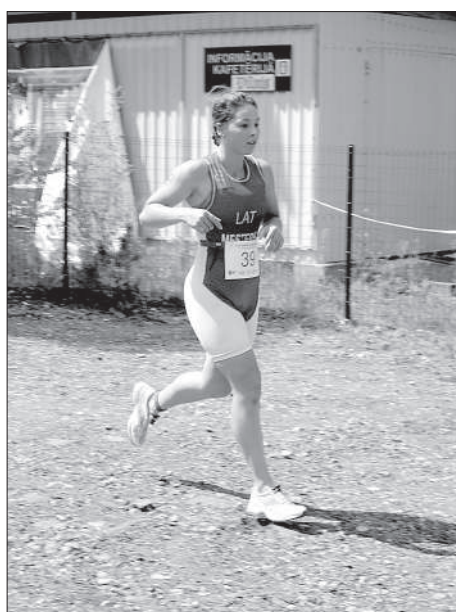
Перед финишем на средней дистанции.