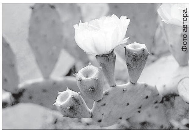
Кактусы цветут на каждом шагу.

Сицилийцы называют Этну добрым вулканом – он позволяет им здесь, в этом солнечном краю, ра-