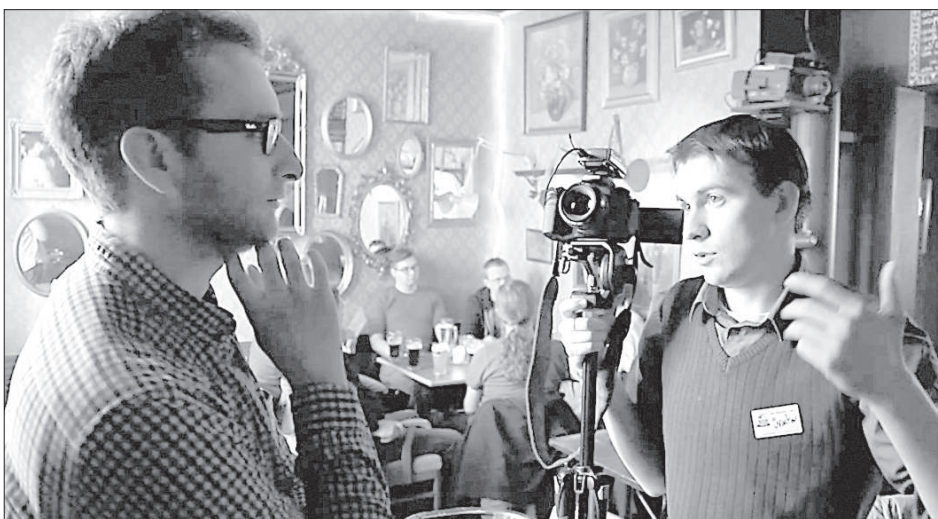
Съемки на одном из заказов.