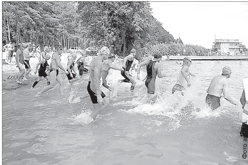
Водный старт на олимпийской дистанции.