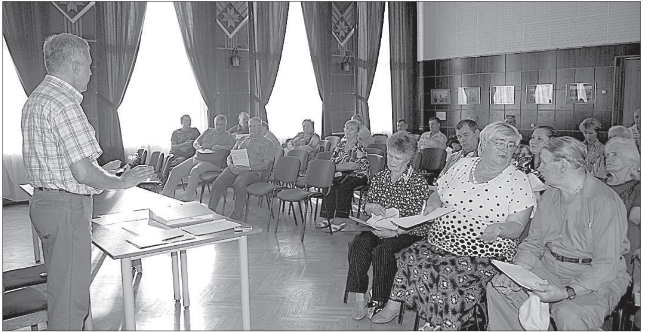
На собрание пришли 30 жителей волости.