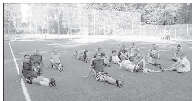
В Крае теперь единственное поле с искусственным покрытием.