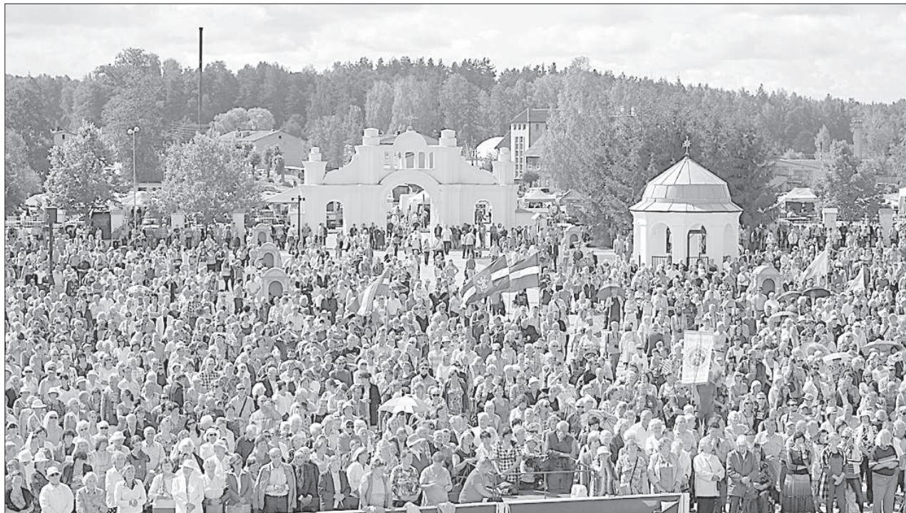
В великой святой мессе участвовали около 135 тыс. человек.