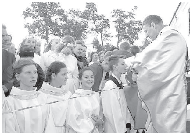
Збигнев Станкевич раздает святое причастие.

вали около 55 тыс. человек, он напомнил, что в молитве нужно осмысливать образ креста, он символизирует не только великую любовь Христа к нам, но и страдание, боль каждого человека, особенно жертв войны. Поэтому сейчас, смотря на крест, Бога нужно молить о мире в Сирии, Ираке, Израиле, Украине, где вместо звезд «у Донеца с неба падают дети». Епископ также спросил: хватит ли нам духа, мудрости и сил защитить Латвию, если возникнет такая необходимость?