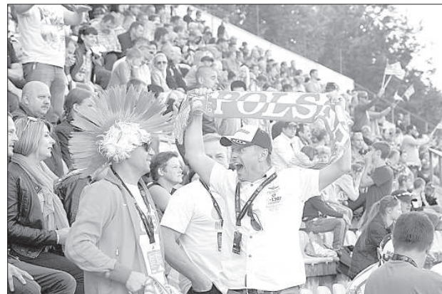
Польский сектор болельщиков радовался без конца.