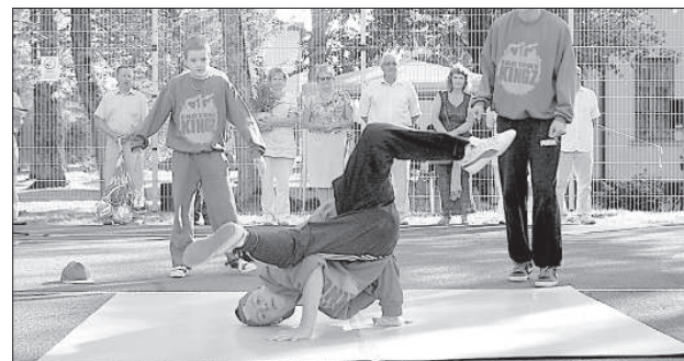
Выступление группы «Factory Kingz».