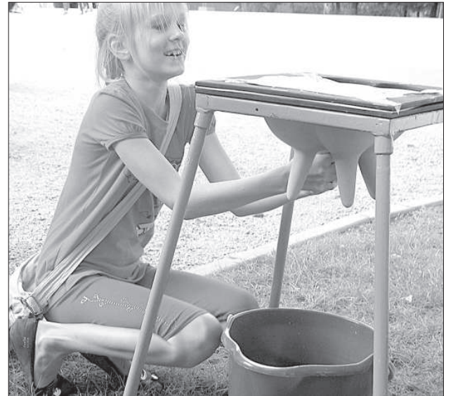
«Корова», которую можно подоить.

щина, которая здесь живет. Национальным меньшинствам тоже нужно думать на тему «Мы и государство», а не в категории «Я и государство», нужно обсуждать, какой вклад к юбилею Латвии могут дать национальные меньшинства», — сказала Д. Мелбарде. ■