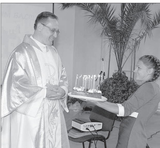
В подарок — торт со свечами.