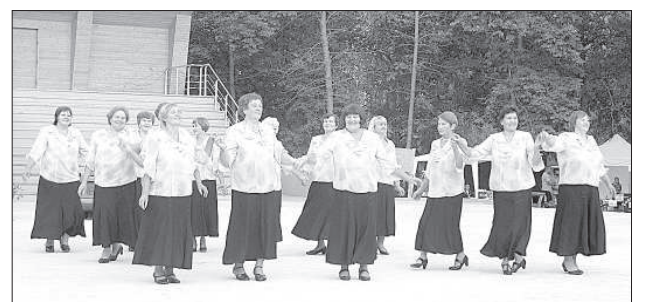
Выступают «Маки» из Вишек.

В ожидании 100-летия Латвии нам важно объединиться. Что для нас значит Латвия, что держит нас вместе? Важна каждая об-