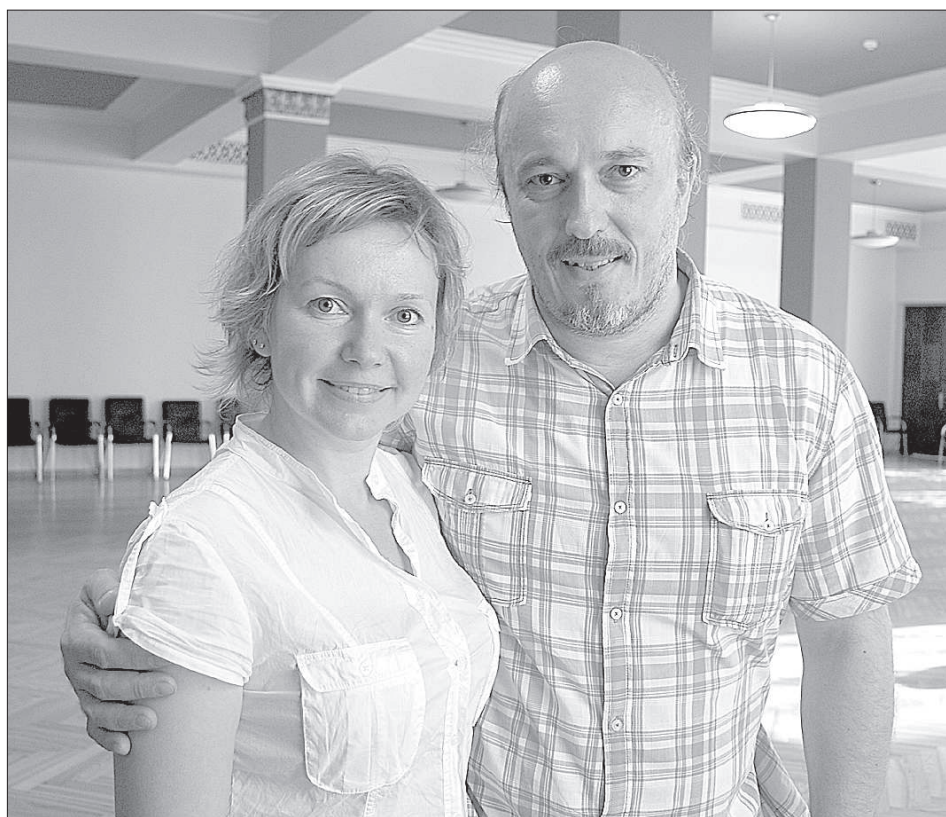
Супруги на Фестивале аккордеонной музыки в Даугавпилсе осенью 2013 года.