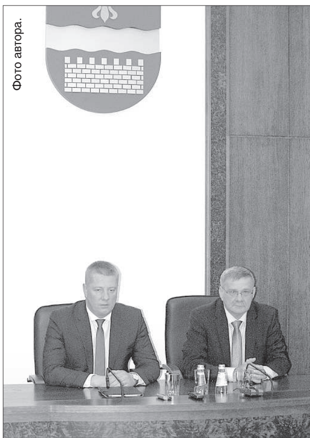
Анриис Матисс и Янис Лачплесис.

14 августа Даугавпилс с рабочим визитом посетил министр сообщения Латвии Анриис Матисс. На пресс-конференции министр рассказал, что в ходе визита успел обсудить с председателем Даугавпилсской гордумы Янисом Лачплесисом ряд вопросов об инвестиционных проектах и развитии инфраструктуры, а также проекты, касающиеся следующего периода планирования.