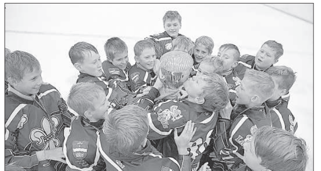
Сладкий вкус трофея.