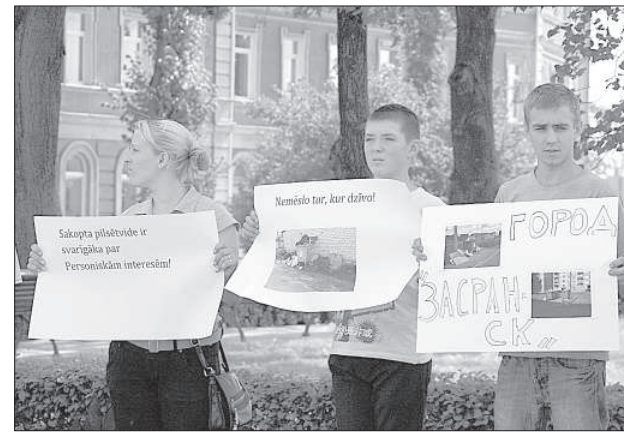
Участники пикета протестуют против замусоренного города.

У думы пока есть претензии к новому оператору по поводу несвоевременного вывоза мусора и