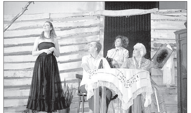
Ликсенский театр играет комедию Я. Яунсудрабиня «Jo pliks, jo traks».