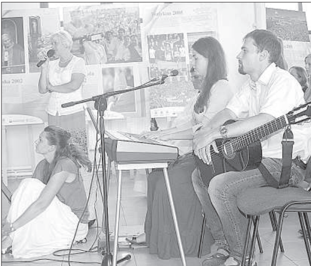
Презентация от приходской молодежи и хора.