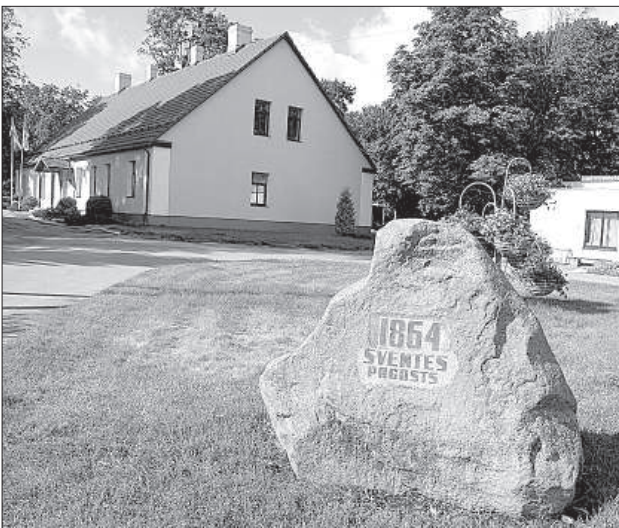
Возле здания волостного управления жители установили символический камень будущим поколениям.

Pasažieru vilciens напоминает, что за безбилетный проезд полагается штраф. Если он не оплачивается в течение месяца, информация о задолженности передается компании по взысканию долгов. ■