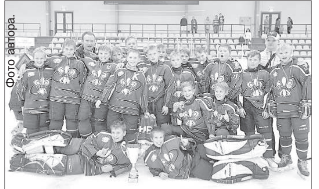
Победители турнира «ДЮСШ Даугавпилс».

В ледовом дворце в течение трёх дней с 14 августа проходил «Кубок Даугавпилса – 2014» по хоккею среди ребят 2002-2003 г.р. Шесть команд из трёх стран устроили яркие баталии, зарождая интригу от матча к матчу.