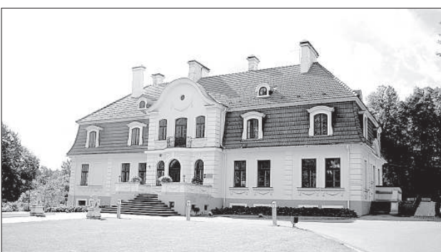
В здании, где сейчас располагается «Sventes muiža», долгие годы была школа.