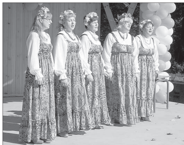
Вокальный ансамбль Скрудалиенской волости «Līgaviņas».