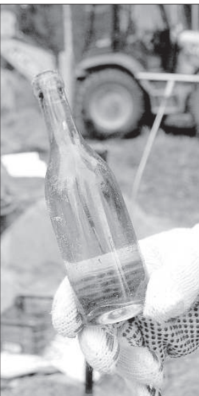
На кладбище нашли жидкость для обработки газовых масок.