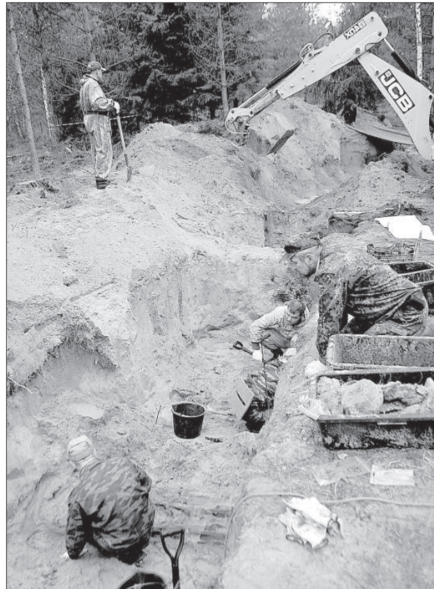
На кладбище работают техника и поисковики.

В конце августа возле кладбища появился ла-