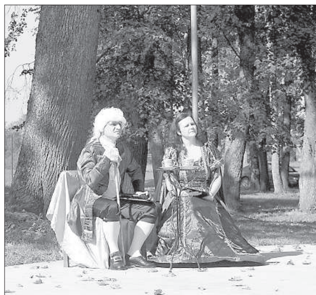
Барон с супругой наблюдают за праздником.

вокальные номера, юмористические сценки, выступили и приглашенные гости из соседних волостей.