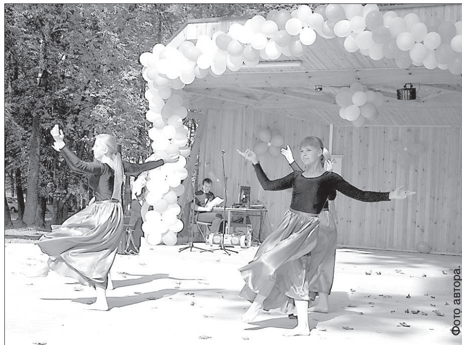
Танцевальный коллектив «Торнадо».

Для зрителей была подготовлена богатая программа: танцевальные и