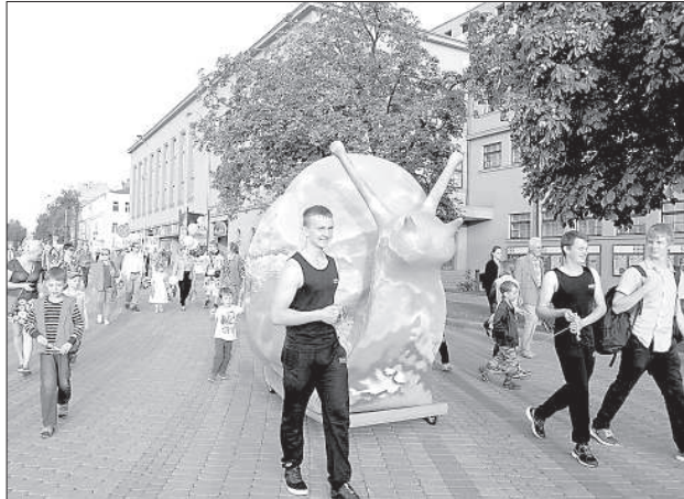
Новая скульптура Даугавпилса пришлась по вкусу.

13 сентября в Даугавпилсе впервые прошел праздник улицы Ригас. Организован он был в рамках 3-го международного музыкального и художественного фестиваля «ReStArt» и был приурочен к почетному званию Риги культурной столицы 2014 года.