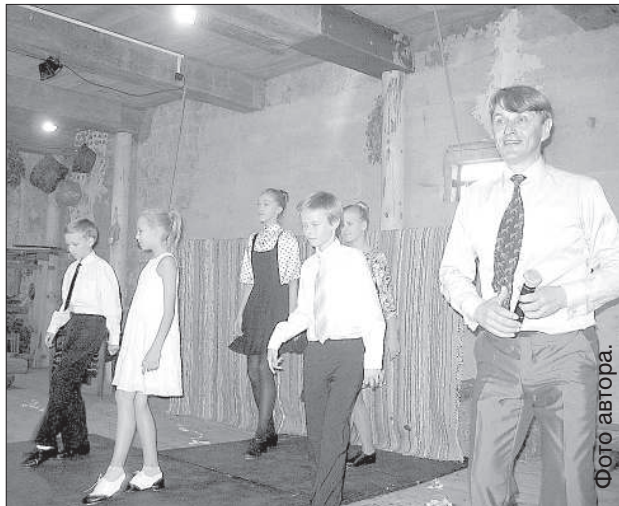
Марис Пурис и танцоры степа.

Традиционные Дни поэзии в Даугавпилсе и Даугавпилском крае проходили с 9 до 13 сентября, и, как обычно, было очень много встреч с авторами, поэтических чтений, презентаций и других мероприятий.