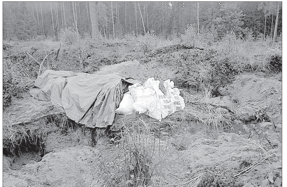
Кости пока складываются в мешки.