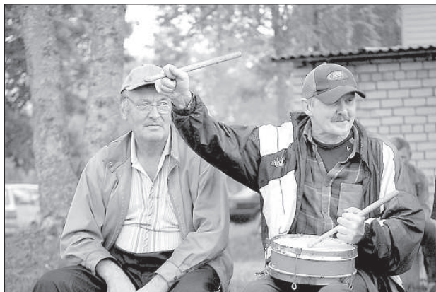
Команду Калупе поддерживали и барабанами.

В начале второго периода калупскую команду спасла только штанга, затем науенцы провели за короткое время