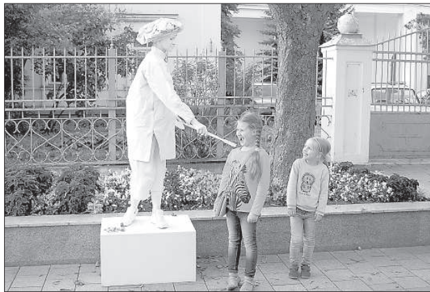
Художник прикасается на счастье.

Вечером главными героями праздника, конечно, стали большая скульптура улитки и живые скульптуры. Огромная розовая улитка авторства Олега