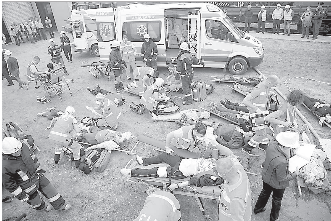
Бригады «скорой помощи» готовят «пострадавших» к транспортировке.