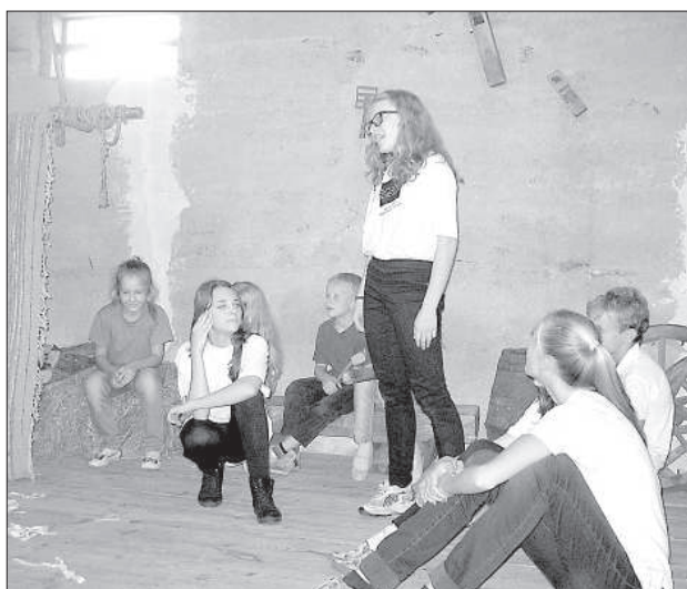
Спектакль «Ежовая шубка».