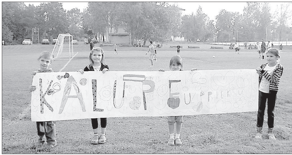
Болельщики пришли с плакатами.

И в полуфиналах, в которых «Калупе» со счетом 3:2 переиграла соперников из Амбелей, и команда «Науене» только по штрафным броскам победила Деменскую команду, и в малом полуфинале, где вновь по штрафным броскам деменцы были сильнее амбельских парней и завоевали бронзовые награды, можно было убедиться, что в этом году в турнире участвовали сильнейшие.