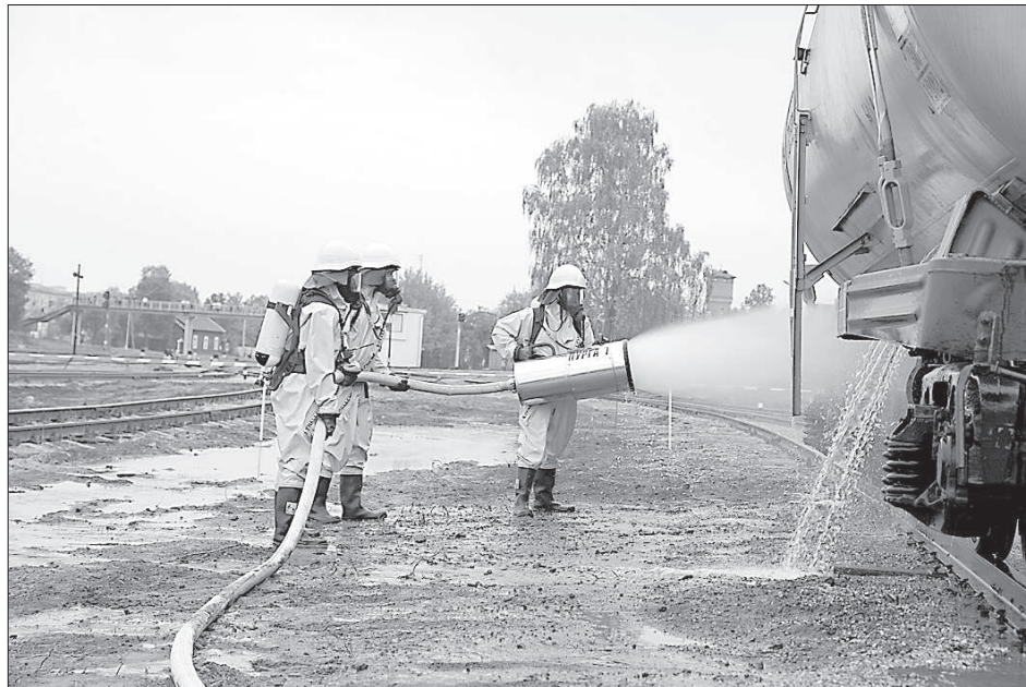
Работы по нейтрализации заражения территории.

Учения взбудоражили город, многие не понимали, почему без конца сиреной снуют «скорые». Что-то случилось? Кроме ГПСС и «скорой помощи», в уче-