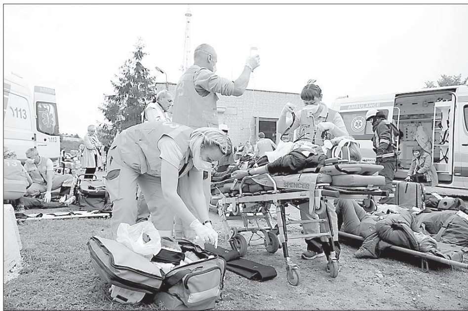
Медики бригад «скорой помощи» не знали отдыха.

ния были вовлечены полицейские. Стражи порядка осуществляли зелёный коридор. Были подключены вертолёты вооружённых сил и погранохраны, приземлившиеся на территории Слободки.