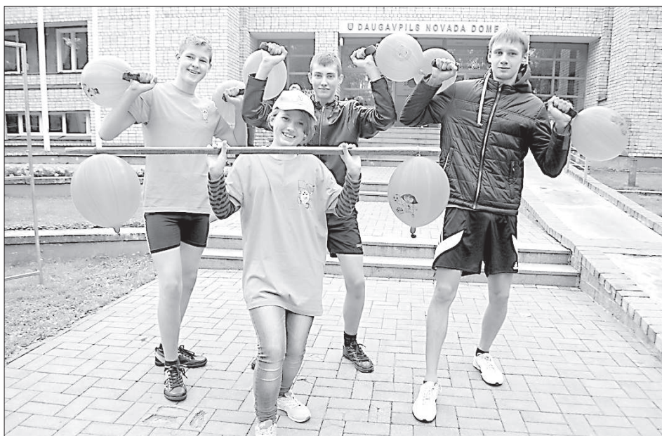
Молодежь рекламирует Медуми выступлением силачей.