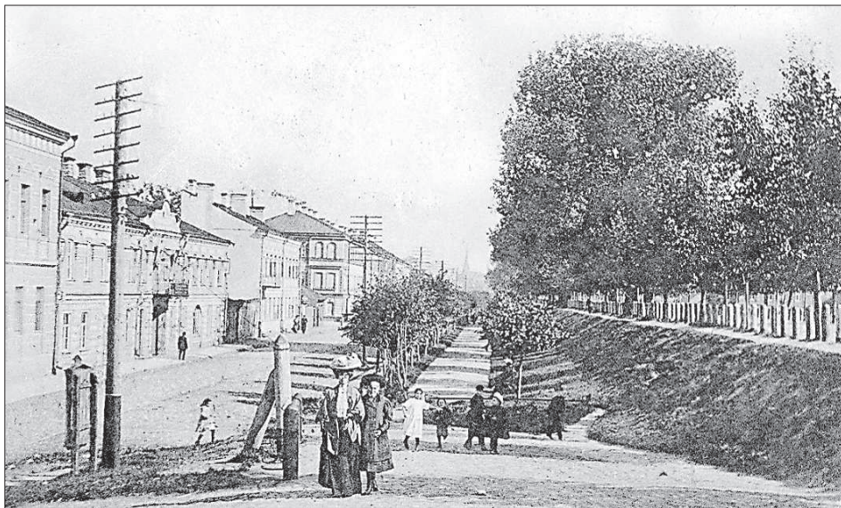
Выход на дамбу на рубеже 19-20 веков.

крыткам и фотографиям видно, что горожане гуляли по дамбе. Участок дороги не был оборудован специально, как пешеходная зона. Дело в том, что на рубеже веков движение транспорта не являлось та-