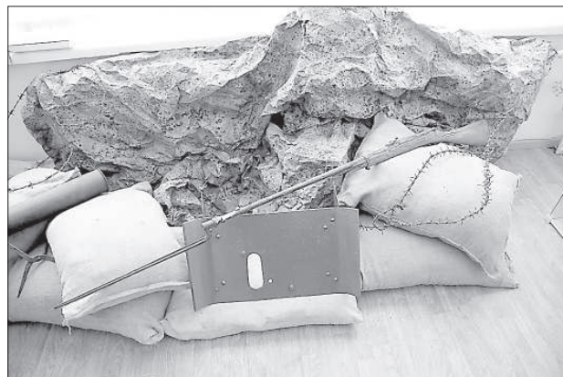
Винтовка первой мировой.