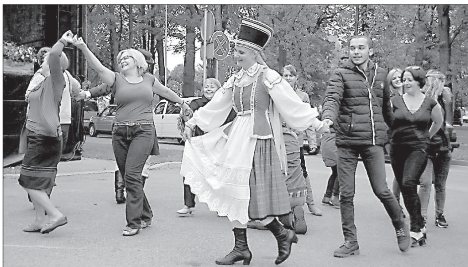
Танцует польский коллектив «Žurp Jovska».