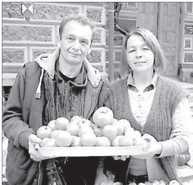
Семья Куракиных с урожаем этого года.