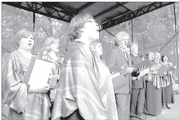
Демене гордится вокальным ансамблем «Aizturi elpu».