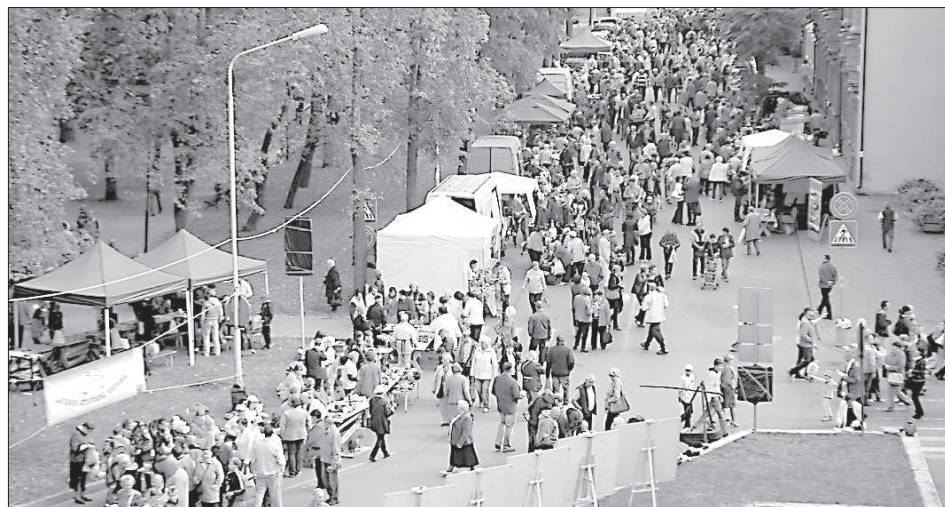
Улица Ригас напоминала реку.