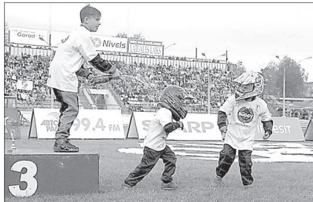
Гонщики багги по-взрослому праздновали победу с детским шампанским.