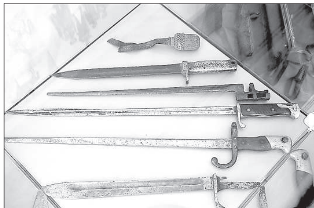
Штыки разных армий.