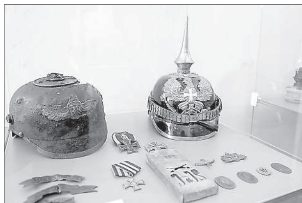
Шлем немецкого офицера.