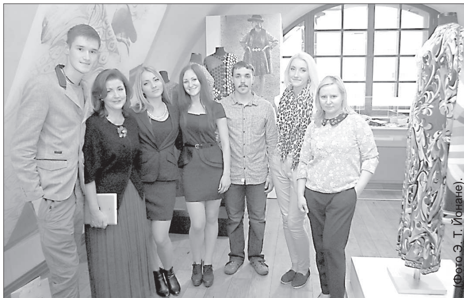
Воспитанники школы «Саулес» принимали участие в создании выставки.

фильм о Джеймсе Бонде «Из России с любовью», и модельеры тут же кинулись воссоздавать образ русской принцессы, (косоворотки, отделка мехами). В это же время наступил кубинский кризис, и в моду вошли «шпионки с севера». Политика влияла на моду не меньше, чем искусство.