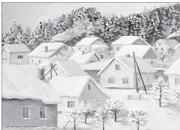
Вид на краславскую Берендеевку зимой.

Государство предложит школам пересмотреть пропорцию, но это только предложение, выполнение которого не будет контролироваться административно, сказала министр. Пропорция языков 80:20 действует сейчас в пяти школах нацменьшинств.