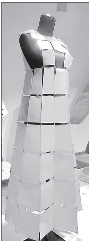
Революционное пластмассовое платье Пако Рабана.

На выставке представлены 90 нарядов «от кутюр» и около 100 аксессуаров. Костюмы были изготовлены прижизненными дизайнерами, т. е. не последователями модельеров, а ими самими, в единственном экземпляре для показов. «Шанель нередко шила вещи сама, и здесь есть костюмы, к которым прикасались ее руки», – рассказал А. Васильев. У каждого наряда своя неповторимая история, связанная не только с процессом его создания, но и значением в истории моды. Стоит отметить сложнейшую работу реставраторов: все костюмы, благодаря их таланту, выглядят как новые.