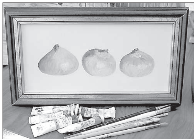
Первая картина у врача самая любимая.