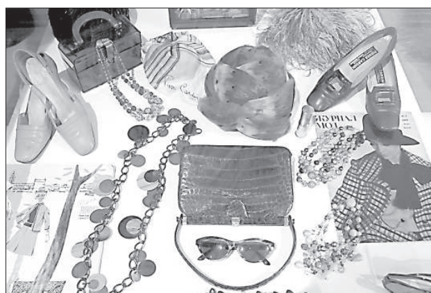
Аксессуары и журналы.