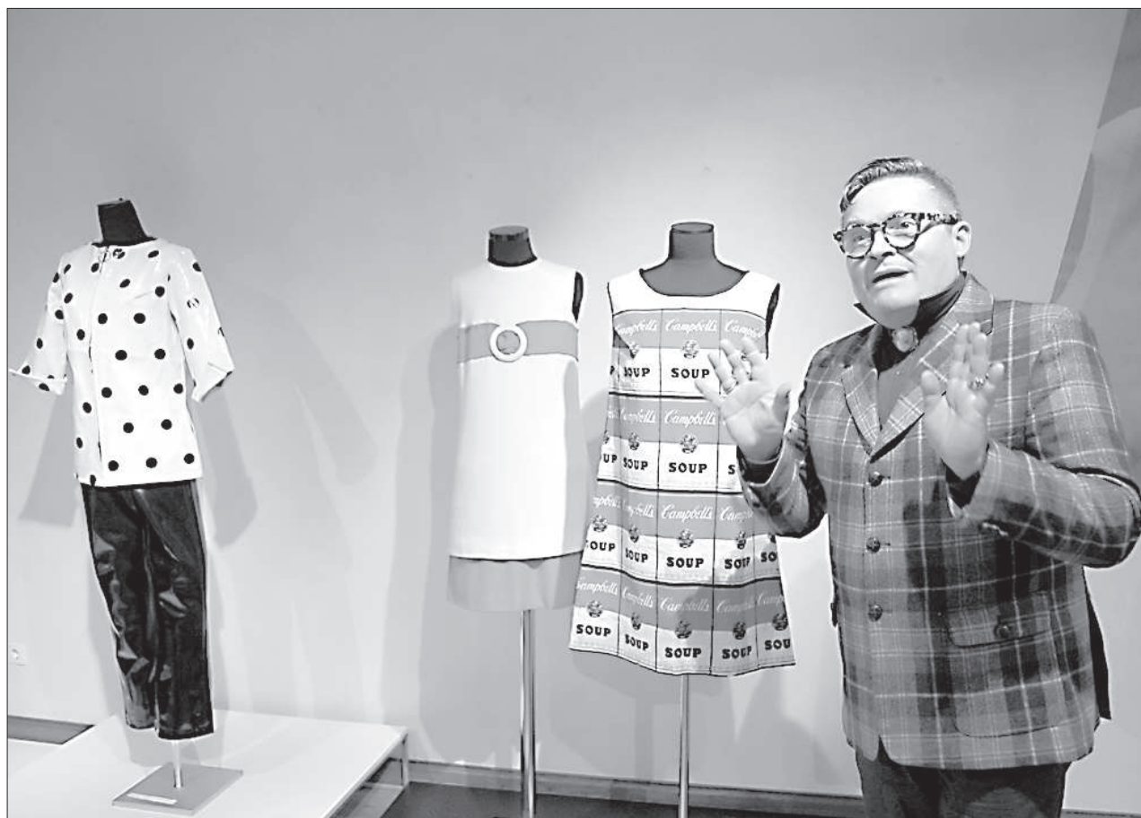
Александр Васильев рассказывает о бумажном платье, репродукции картины Энди Уорхола (справа).