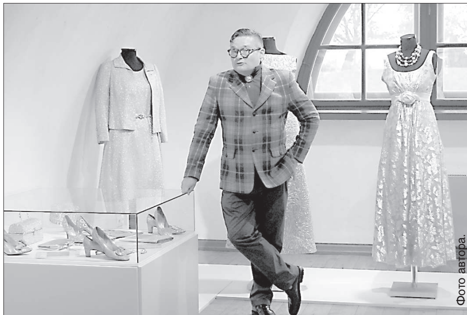
Историк моды провел экскурсию по всем залам.

Мода каждого периода уникальна тем, что она очень тесно взаимосвязана с историей эпохи, с искусством. «Мода 60-х создавалась в годы, когда жил и писал Ротко, очень большое влияние на нее оказал создатель поп-арта Энди Уорхолл, архитектор и модельер Пако Рабан и т. д. 60-е годы максимально точно и аккуратно рассказывают нам, как много мода сделала для искусства и наоборот», – подчеркивает А. Васильев. Так, благодаря историческому событию полета человека в космос в 1961 году, в моду вошел люрекс, «серебряные» колготки и платья, шляпы «летающие тарелки», металлические детали, форма круга и т. д. В 1963 году вышел