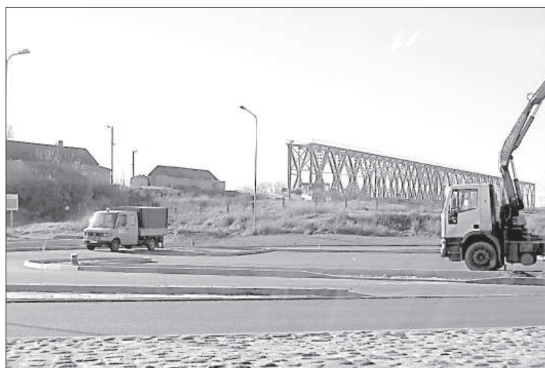
Стоянка возле крепости почти готова.

второго слоя асфальта на ул. Оду вдоль ул. Шуню. Сейчас здесь уложен первый слой асфальта. Мостик через Шуньупите для движения транспорта закроют, по нему будут ходить пешеходы, а в перспективе — ездить велосипедисты. Ремонт ул. Оду — Цесу осуществляется на сэкономленные средства от строительства третьей очереди транспортно-перехваточного узла, который проводился в рамках проекта европейского Фонда когезии (350 тыс. евро).