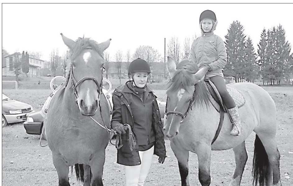
Дарта Плика с Астрой и Либа Апалите со Стеллой.