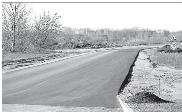
На улице Оду уложен первый слой асфальта.

Сейчас в городе в стадии завершения находятся проекты по реконструкции участка улицы Лиепаяс от ул. 18 Новембра до ул. Авоту. В начале ноября сдадут в эксплуатацию ул. Лиепаяс, а до конца года — ул. Вентас, Видзе-