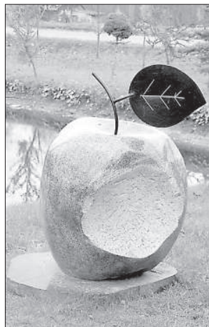
Надкушенное яблоко Евы из райского сада.