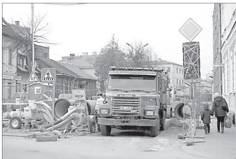
Улица Алеяс закрыта уже больше месяца.