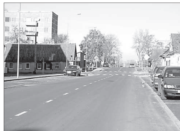
Улица Лиепаяс будет сдана в эксплуатацию в начале ноября.