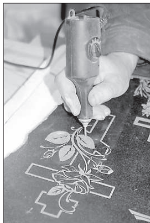
Альфред сам расписывает каменные таблички.

На территории мастерской составлен в ряд камень разной фактуры и цветов, есть и привезенный из Европы черный гранит. Мастер говорит, что сегодня большинство каменотесов работают с дешевым китайским гранитом, на изделия из которого дается только трехлетняя гарантия, они часто трескаются и меняют цвет. Альфред остался верен местному латгальскому камню, из