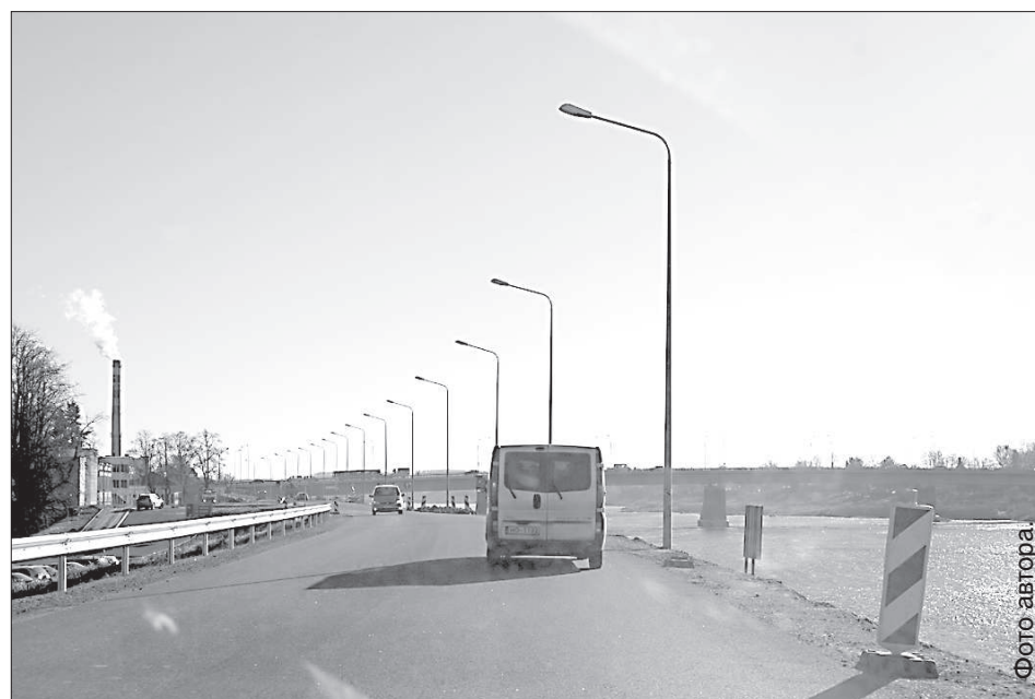
Двигаться в центр по дамбе без заграждения довольно рискованно.