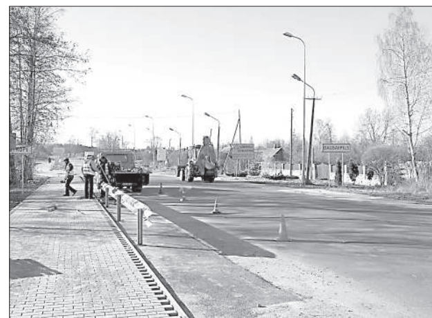
Участок до границы города отремонтируют в 2015 году.

«Дорожно-ремонтные работы в Даугавпилсе можно осуществлять вплоть до того времени, пока не установится среднесуточная температура -5», — сообщил неделю назад зам. председателя городской думы Петерис Дзалбе. Поэтому в ближайшие недели даугавпилчане еще будут видеть на улицах города строительную технику и строителей. ■