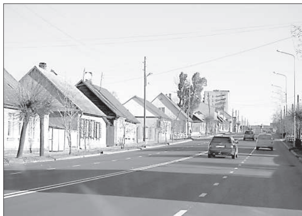
Улицу Смилшу самоуправление отремонтировало за собственные средства.

В планах на первую половину 2015 года — укладка