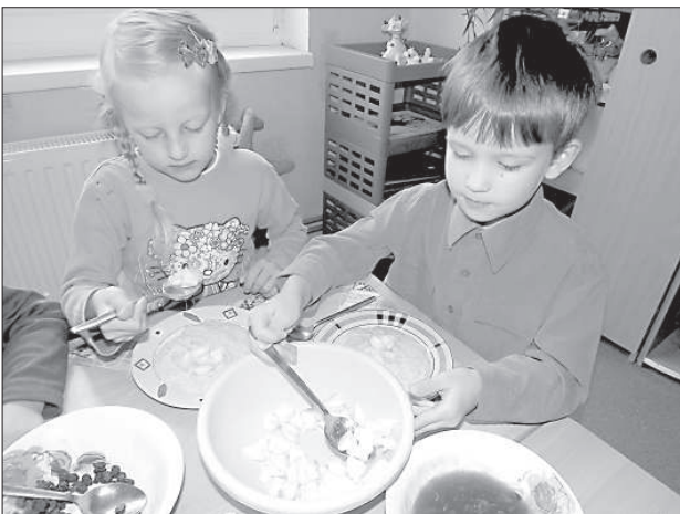
Малыши пробуют каши с разными добавками.

В Латвии на протяжении многих веков каша являлась основой меню наших предков, но сегодня это полезное и вкусное блюдо многие подзабыли. Специалисты по питанию говорят о том, что зерновые продукты должны составлять примерно половину нашего рациона.