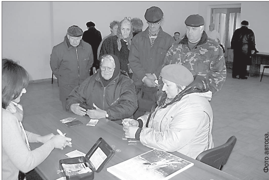
Наши преданные читатели в Калупской волости.