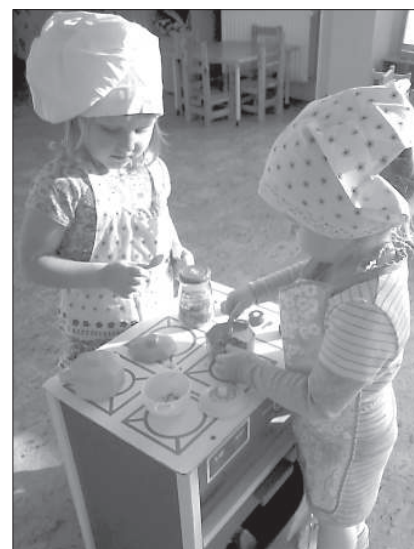
Во время игры дети осваивают поварское искусство.

До дня рождения детского сада 26 ноября детям будут предлагать разные каши и салаты, рецепты которых приложены на конкурс, потому что пройдет голосование и награждение авторов блюд.