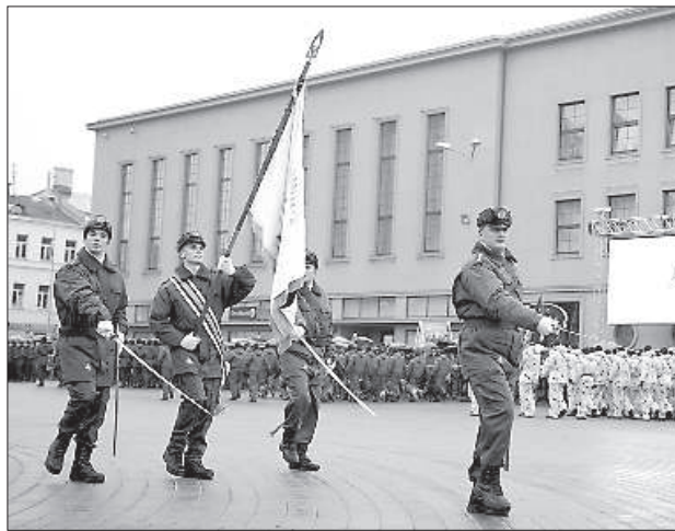
Гости из Эстонии.