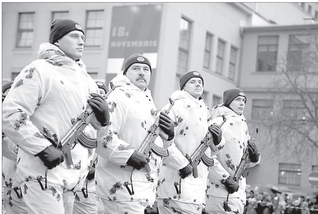
Зимние маскхалаты погранохраны.