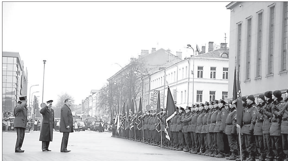
Министр внутренних дел Рихард Козловский принимает парад.

После официальной части техника вернулась на площадь, где была отдана «на растерзание» молодому поколению. Сфотографироваться на фоне различных аппаратов школьники стремились в самых различных вариациях: забраться в лодку, почувствовать, как сидится в квадратице, затем быстро сбежать в другой конец площади посмотреть в окуляры пушки и миномета и успеть подержать стрелковое оружие. ■