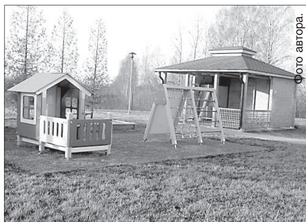
Детям нравится площадка для прогулок.