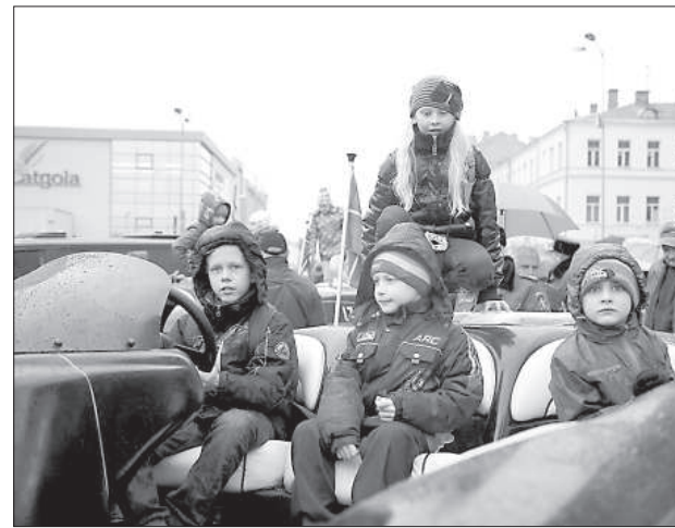
Катера пограничников удобны.