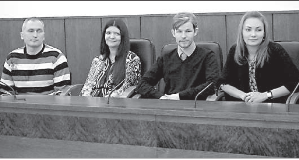
Молодые и смелые предприниматели Даугавпилса.

В городской думе прошло торжественное награждение победителей программы поддержки молодых предпринимателей Даугавпилса «Импульс».