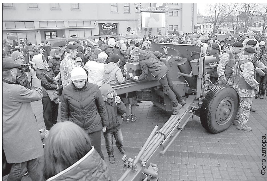
Пушка земессаргов в момент стала объектом пристального внимания.