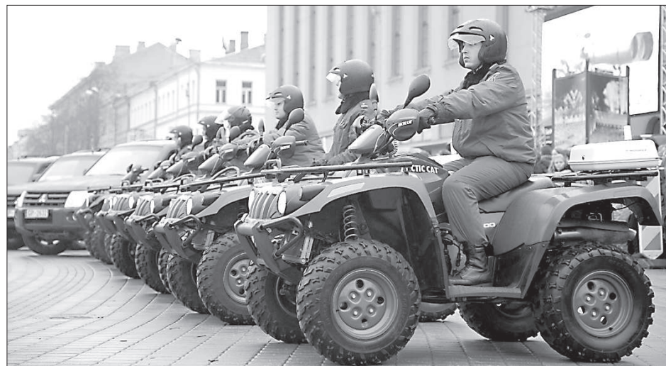
Квадрациклы – незаменимая техника на зеленой границе.