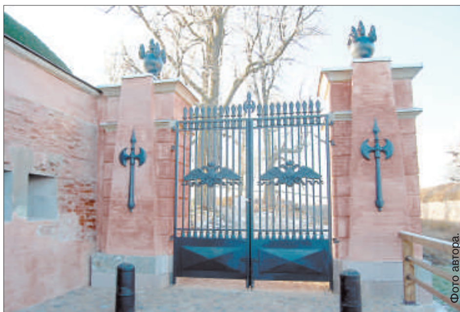
Барьерные ворота отстроили заново.

Реставрация люнета и караульни началась 10 марта текущего года, строители фирмы «Ditton Būve» управились раньше положенного срока. Перед ними стояла непростая задача – вернуть аварийному сооружению исторический облик, восстановить утраченные барьерные ворота с декоративными элементами: створками, алебардами и огненными шарами в форме гранаты с языками пламени. Эти шары (брандскугели) изготавливала фирма из Лиепаи, которая занималась литьем орлов для