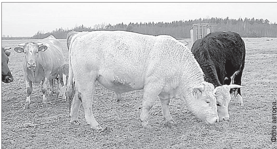
В стаде коровы герефордской породы и породы шароле.

натуральном хозяйстве. В 2007 году он принял участие в европейском проекте для новых крестьян, и появились три первых теленка герефордской породы. С этого все началось, а теперь поголовье дошло до 50-ти.