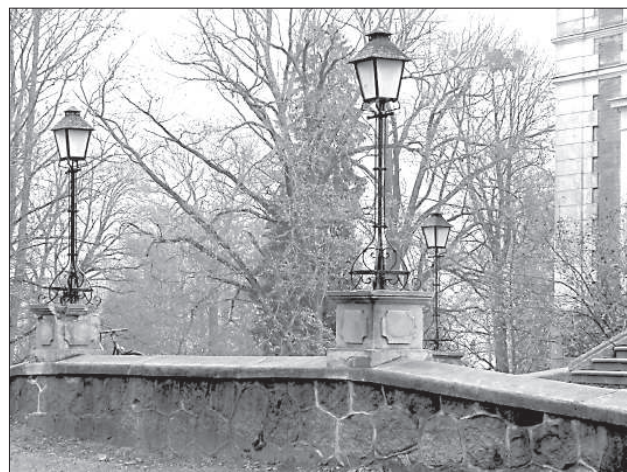
Отреставрированные фонари около Бебренской усадьбы.