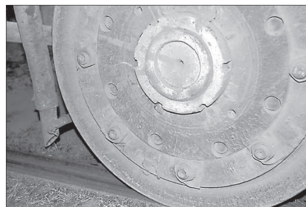
Трубочка возле колеса сыплет на рельсы песок.