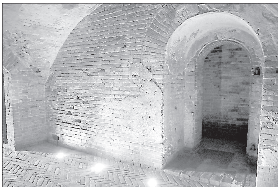
Внутри караульни тепло.

Официальное открытие объекта пройдет в рамках международной туристической конференции, которая состоится Даугавпилсе 24 апреля 2015 года. ■