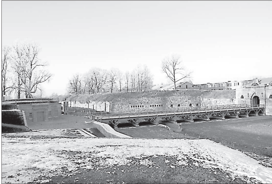
Исторический облик главного въезда в крепость воссоздан.

Строительные работы в крепости проводились в