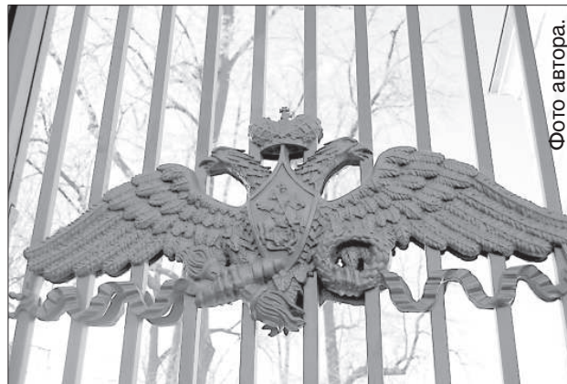
Двуголовый орел на барьерных воротах.