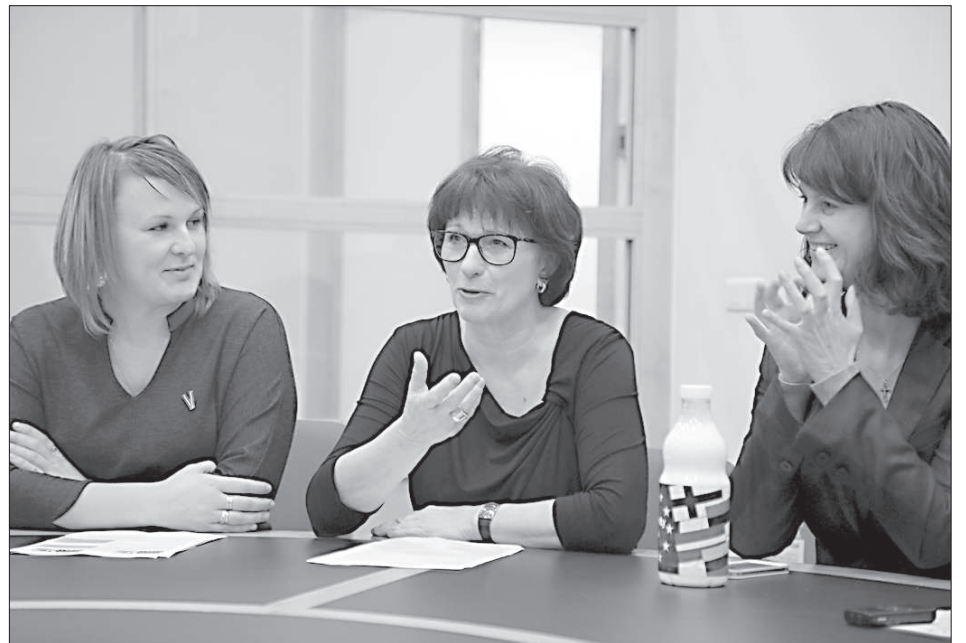
Сандра Калниете (в центре).

Каждый народный из- бранник кратко изложил, чем он занимается в Ев- ропарламенте, и ответил на актуальные вопросы.