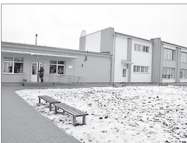
Обновленный фасад школы.

Здание начальной школы Вабольской средней после реконструкции стало оранжево-зеленым, в яркие цвета окрашены классы и коридоры, для каждого помещения найдено свое оригинальное цветовое решение.