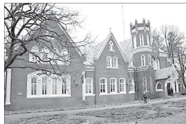
Замок постепенно восстанавливает свое величие.

Краевая дума планирует разработать новый проект