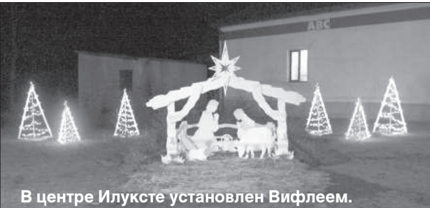
В центре Илуксте установлен Вифлеем.