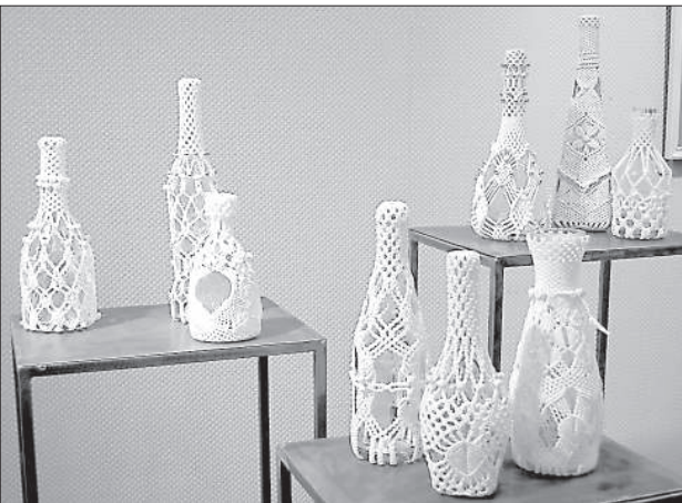
Работы учениц кружка на первом году обучения.

В двух залах Даугавпилсского краеведческого и художественного музея открылась интересная выставка изделий одного из самых загадочных и в то же время недооцененных видов декоративно-прикладного искусства – макраме или узелкового плетения.