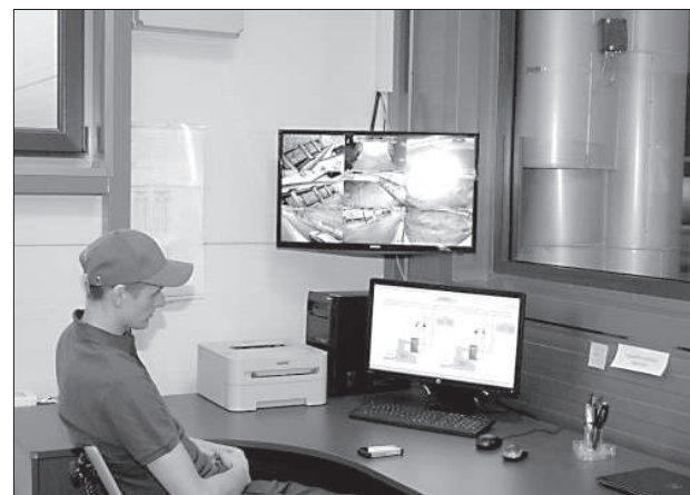
Оператор следит за процессом на мониторах.

ное устройство, которое загружает щепу на гидравлические полы, откуда она уже попадает в котлы. Всего в котельной работают 5 человек, четверо операторов трудятся по сменам сутки через трое. Создана специальная компьютерная программа, при помощи которой можно наблюдать за производственным процессом из любой точки, где есть Интернет. За тем, как щепа сгорает в котлах, можно наблюдать через специальное окош-