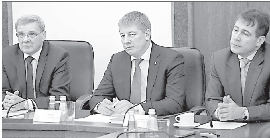
Самоуправление, министерство и «LDZ» думают, как спасти ЛРЗ.

У. Магонис сообщил, что в недалеком будущем в Даугавпилсе планируется ремонт вагонного парка, сортировочной станции. Здание вокзала пока в этом списке не значится, хотя этот вопрос время от времени поднимается. В некоторых городах вокзалы отремонтировали, и они успешно действуют как многофункциональные. Например, в Сигулде, Цесисе и Елгаве вокзал совмещен с автостанцией,