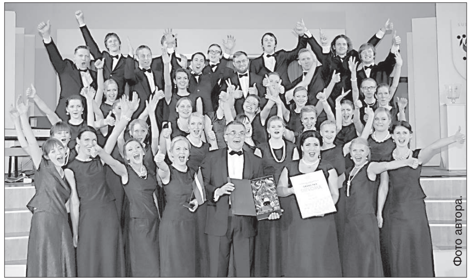
Обладатели Гран-при — хор «Atvars».

Разнообразие репертуара в очередной раз опровергло стереотип о том, что хоровая музыка скучна или монотонна, напротив, экспрессия здесь была через край и впечатляла гораздо сильнее, чем эпатаж или яркие костюмы. Очень эмоциональное выступление молодежного хора «Atvars» из центра культуры Сигулдского края, переходящее от шепота к кри-