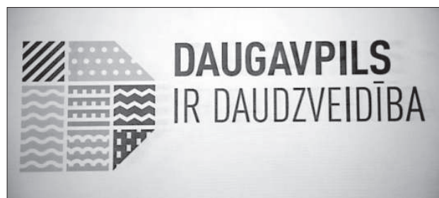
Семь цветов и орнаментов в букве «D» олицетворяют многообразие Даугавпилса.