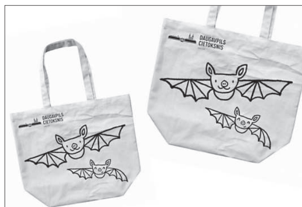
Сувениры с изображением крепости.

По заказу думы молодой человек, получивший образование в Латвии, России и Великобритании, в течение года занимался разработкой знака, который стал бы отличительной, узнаваемой «фишкой» города, не просто логотипом, а целой философией, способной лаконично и в то же время всесторонне отражать весь смысл его самобытности и потенциала.