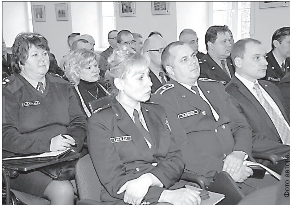
Полиция обобщила данные за год.