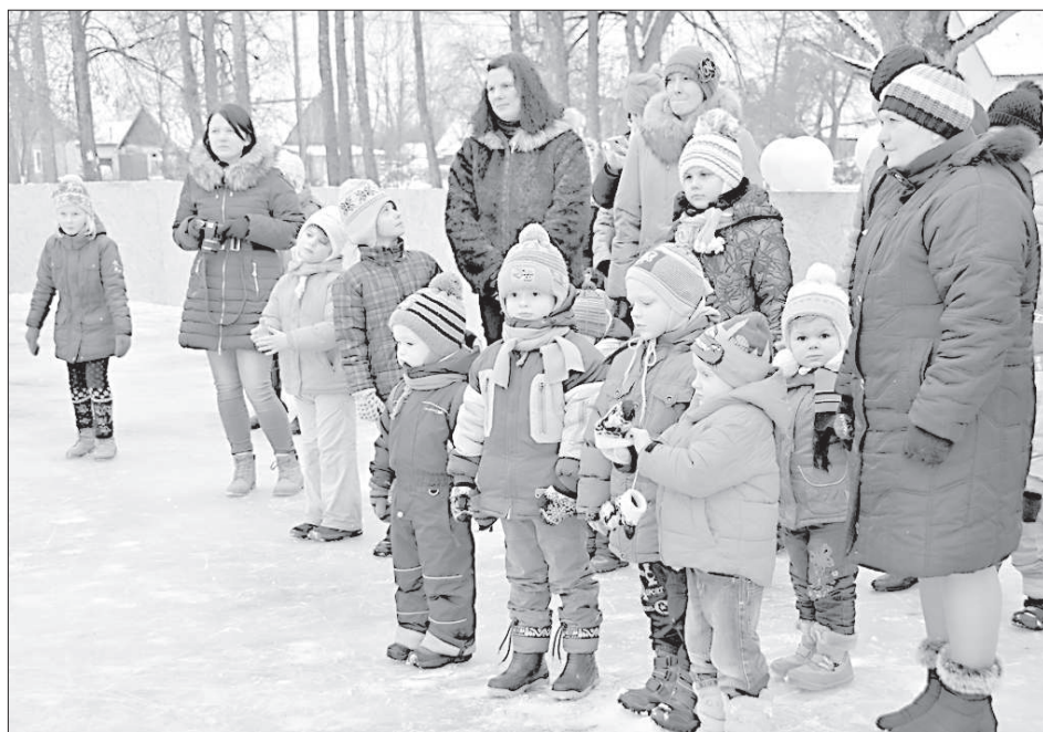
На хоккейном поле будут заниматься и детсадовцы.