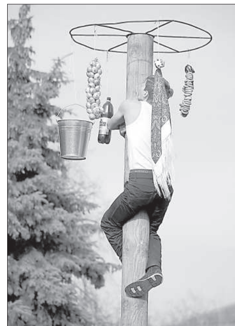
Горячий и сильный парень лезет за баранками.