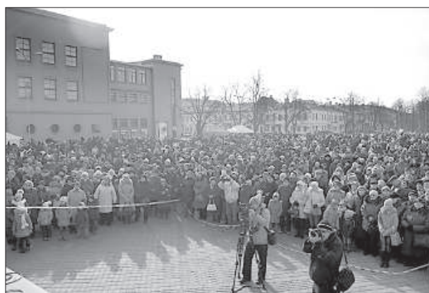
Праздник собрал целую площадь людей.