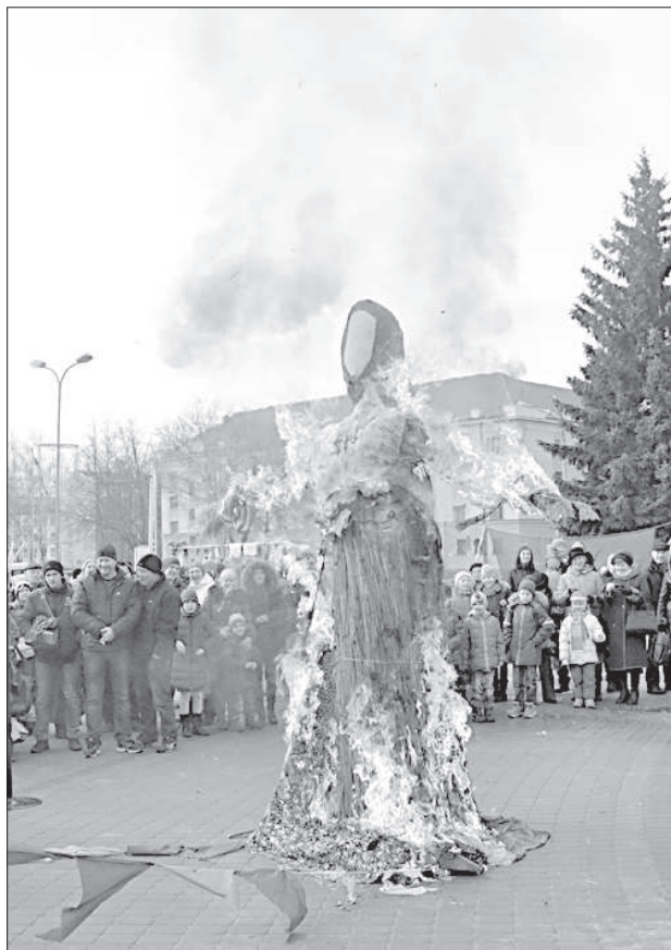
Кульминация масленичных гуляний.