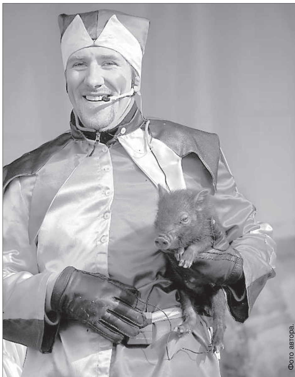
Поросенок не очень хотел продаваться.