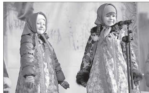
Песни о весне пели и малые, и большие.