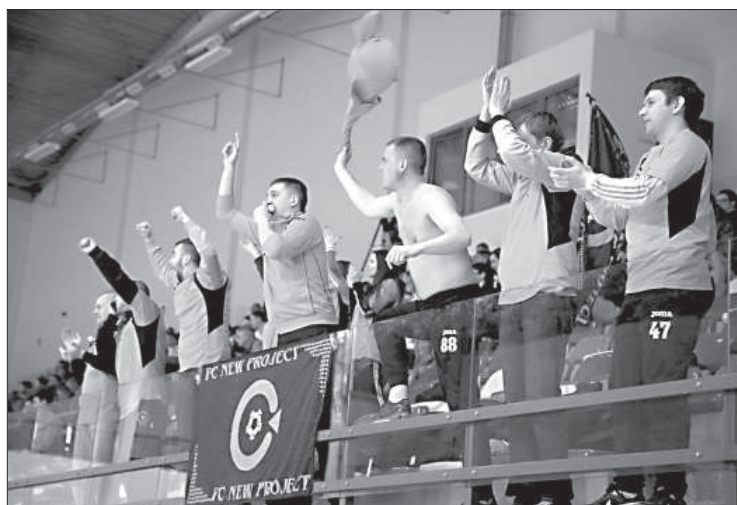
Болельщики «Райта/ New Project» радуясь голу своей команды, ещё не знают, чем завершится матч.

Неругала пала – 1:1, но, к счастью, голкипер не увлёкся самокопанием, а методично выполнял свои прямые обязанности.