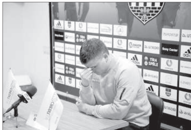
Главный тренер «Метта/ЛУ» Андрис Рихерт в тяжёлых раздумьях.

манда «Метта/ЛУ» имела реальный шанс сравнять счёт, произошёл за несколько минут до свистка на перерыв. Игрок «белозелёных», стоявший на дальней штанге, не справился с мячом, смазав точный пас от партнёра.