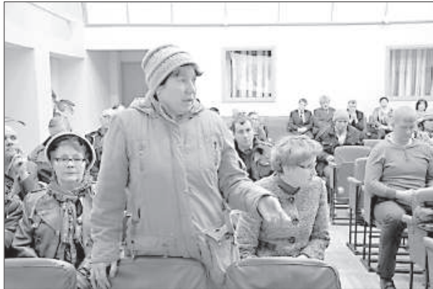
Надежда спрашивает, когда улучшится качество воды.

Год назад на собрании жителей в Деменской волости самой актуальной темой было создание пожарно-спасательного пункта, люди даже собирали подписи, и вот спустя год такое подразделение создано – 12 активистов объединились в добровольное пожарно-спасательное общество, чтобы помогать жителям окрестности в тяжелых ситуациях.