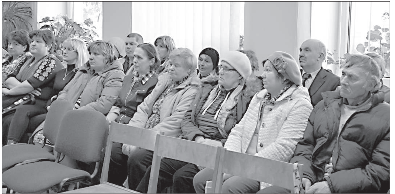
Жители Лауцеской волости активно задавали вопросы.