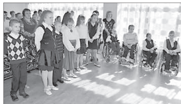
Дети участвуют в богослужении.

когда на богослужения будут приходиться старики Калкунской волости, семьи, тогда алтарь можно будет устанавливать в большом зале для мероприятий, как это было на святой мессе, проводимой деканом.