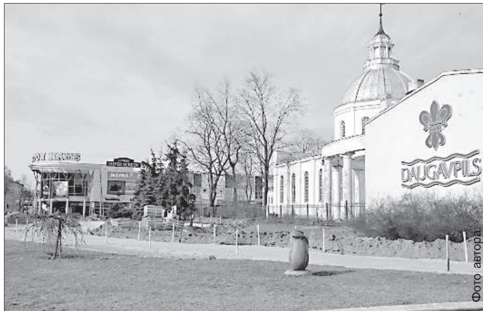
Вся территория вокруг собора принадлежит церкви.

Депутаты городской думы дважды за последние 2 недели обсудили юридические отношения с Латвийской Римско-католической церковью. Дело в том, что вся территория перед собором (напротив гостиницы) и за ним (парк скульптур) принадлежит церкви. Приход обратился в строительный департамент