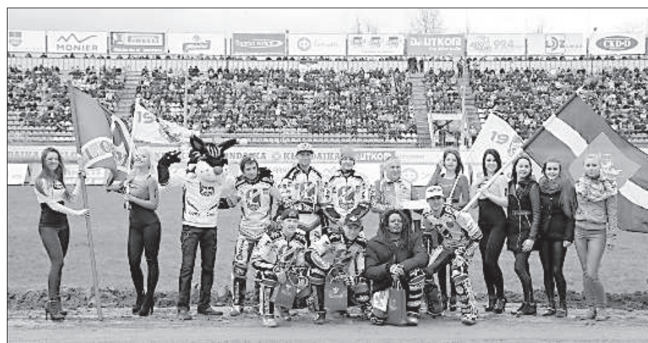
СК «Локомотив» – состав первой гонки сезона.