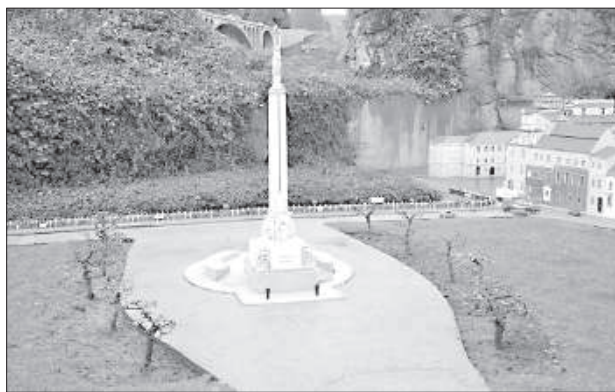
В Брюсселе в парке «Мини-Европа» есть макет памятника Свободы.