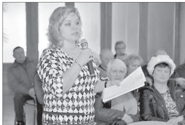
Г. Сурговте собрала почти 1000 подписей против проекта нового тарифа.