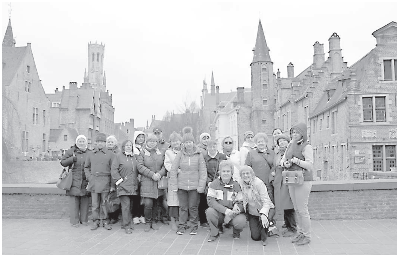
Даугавпилсская группа на экскурсии в Брюгге.