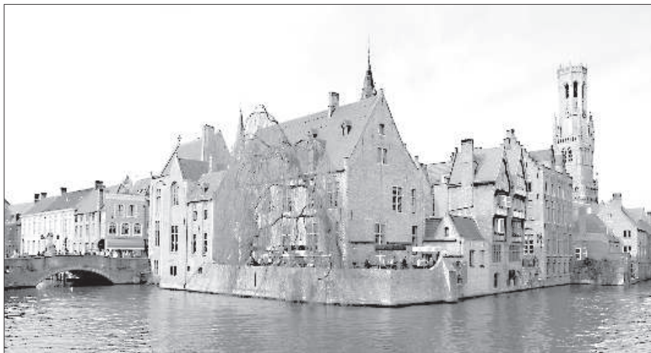
Брюгге – очень живописный город.