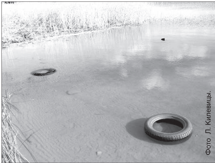
Пляж на озере Шуню.

Старая истина банальна и проста: «Чисто не там, где убирают, а там, где не мусорят».