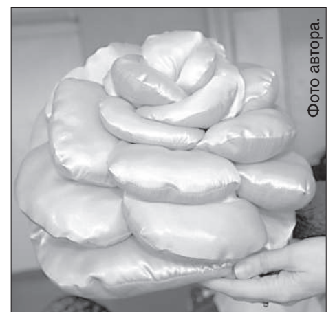
Символ Индры — роза — перерождился в красивую подушку.