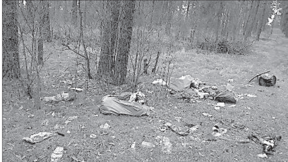
Лес на Новом Форштадте.

В этом году будут использоваться синие и бе-