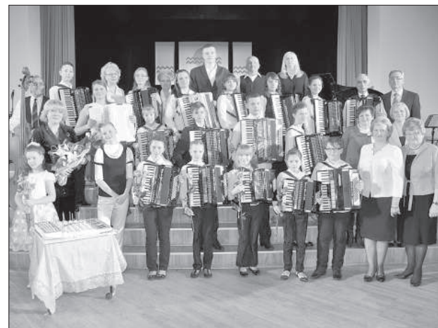
Друзья и гости Науенского оркестра аккордеонистов.