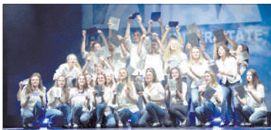
Солнечные зайчики зрителям от «Лаймы».