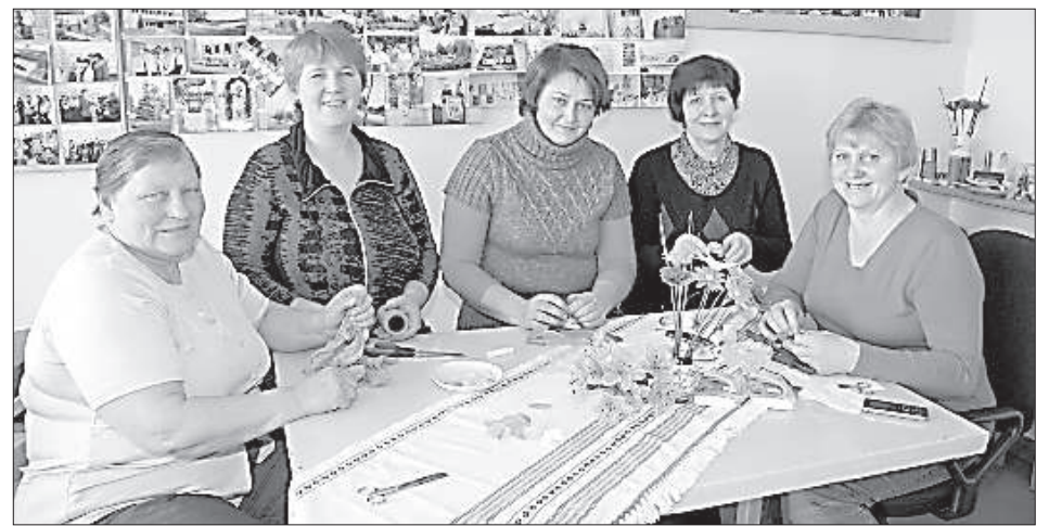
Кружок рукодельниц «Золушка».

«Но у нас есть много хорошего, не так уж всё и плохо. В прошлом году утеплили музыкальную и художественную школу, в центре поселка оборудовали место для отдыха — Парк Отечества, продол-