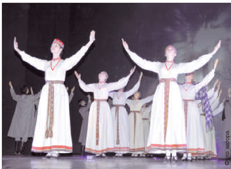
«Pi Dīveņa gari goldi».

вальные программы. Венок танцев «Rīti, rīti» получил признание в 1997 году на международном театральном фестивале «Желтый дятел». Тогда танцоры «Лаймы» выступили в обновленном кафедральном соборе Мартина Лютера. Они подчеркнули, что небо и земля, женщина и мужчина, солнце и человек, также как танец, уже сначала мироздания находятся в творческом взаимодействии.