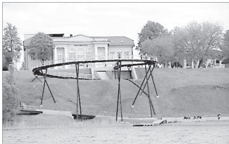
Туристов привлекает панорамное колесо.