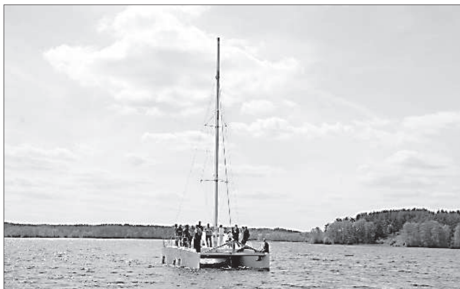
По Зарасайскому озеру можно прокатиться на современном катамаране.

Мэр города настоятельно рекомендует посетить самые интересные объекты в окрестностях Зарасая, например, осмотреть 2000-летний дуб в Стелмуйже и построенную без гвоздей деревянную церковь. Недалеко от них в парке находится отреставрированная башня Вергу, где помещики в свое время держали в заключении и судили провинившихся крепостных. Н. Гусев приглашает посетить историческую водяную мельницу в Шлининкае, где до сих пор действуют 300-летние жернова и печется хлеб по старинным рецептам. ■