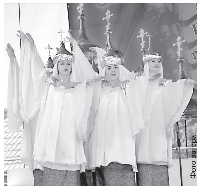
Хореографический ансамбль «Лада».

Интересными выступлениями зрителей, среди которых был и епископ Даугавпилсский и Резекненский Александр, порадовал хор музыкальной ср. шко-