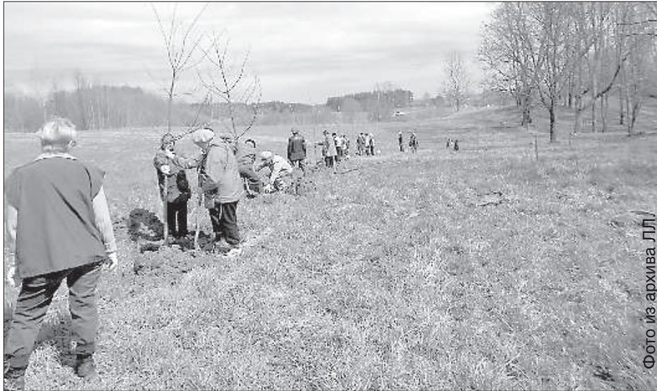
Во время Большой толоки сажали яблоневый сад.