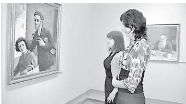
Зрители смотрят картины «Слепой со скрипкой» и «После обеда».