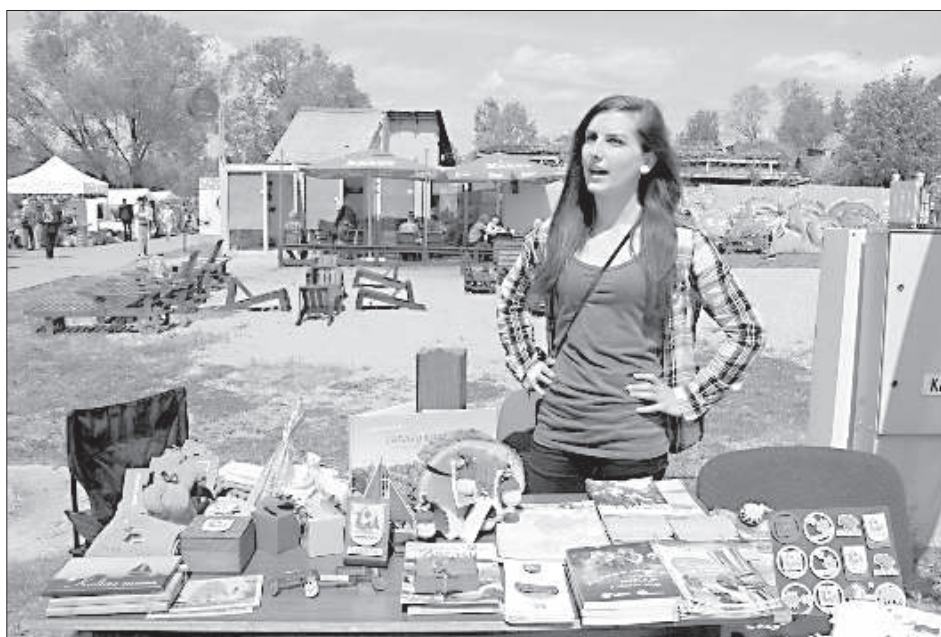
Зарасайский ЦТИ предлагает сувениры с городской символикой.

рос с сообщением. В прошлом году каждое воскресенье по инициативе гостиницы «Latgola» в Зарасай курсировал автобус, чтобы отвезти туристов на отдых.