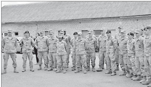
Латвийские и американские солдаты полны решимости приступить к работе.

Солдаты собираются реконструировать здание детского дома, где для двух подростковых групп обеспечат семейную атмосферу, и где они будут жить самостоятельно. В свою очередь, победившая в конкурсе Посольства США даугавпилская SIA "Ditton būve" доставит материалы и будет следить за