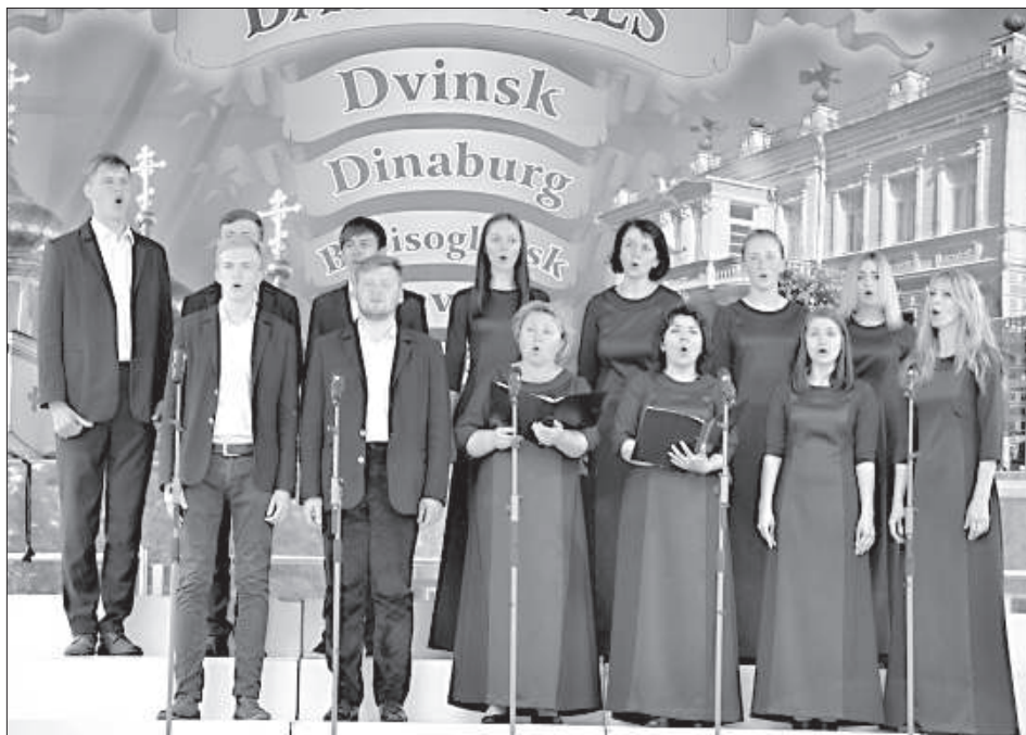
Хор Русского лицея.