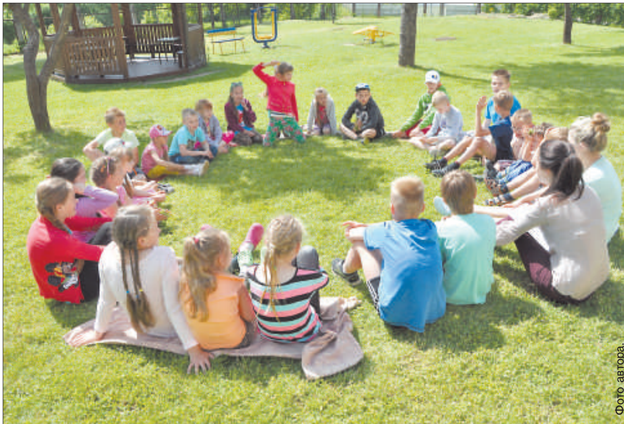
Дети участвуют в игре «Познай свой край!»