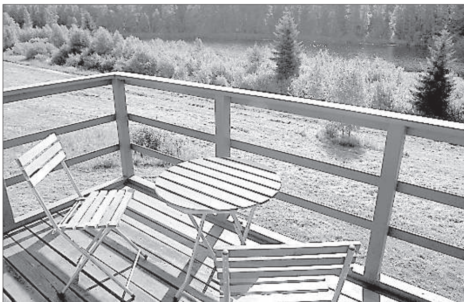
«Межаскуки» приглашают отдохнуть на природе.

13 и 14 июня по всей Латвии будет проходить акция «Открытые дни на селе», организуемые организацией «Lauku ceļotājs». Цель мероприятия — популяризировать в среде городских жителей выращенные, произведенные, приготовленные на селе продукты и предлагаемые услуги, а также живущих на селе животных и различные возможности активного отдыха.