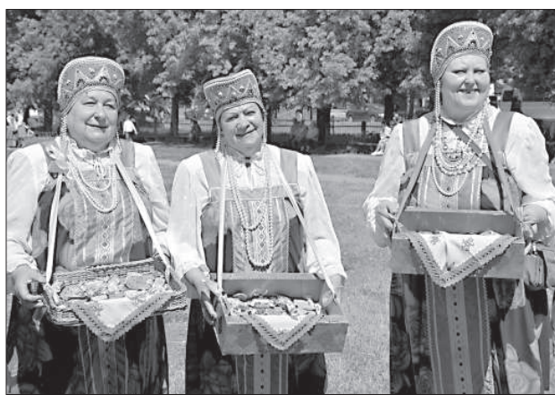
Сладости были нарасхват.

Для участия в фестивале в Даугавпилс впервые приехали несколько коллективов из Пскова – народный коллектив молодежного хореографического ансамбля «Лада» и детский хор Псковского Свято-Троицкого собора. «Лада» поразила зрителей очень красивыми костюмами – специально для своих номеров на духовную тематику девушки изготовили необычные головные уборы в виде золотых куполов. «Латгалес Лайкс» участницы рассказали, что сделаны купола из пенопласта, а сверху покрыты золотистой