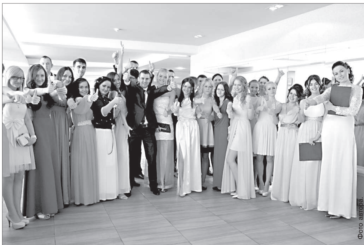
Выпускники вместе с любимым «классным».