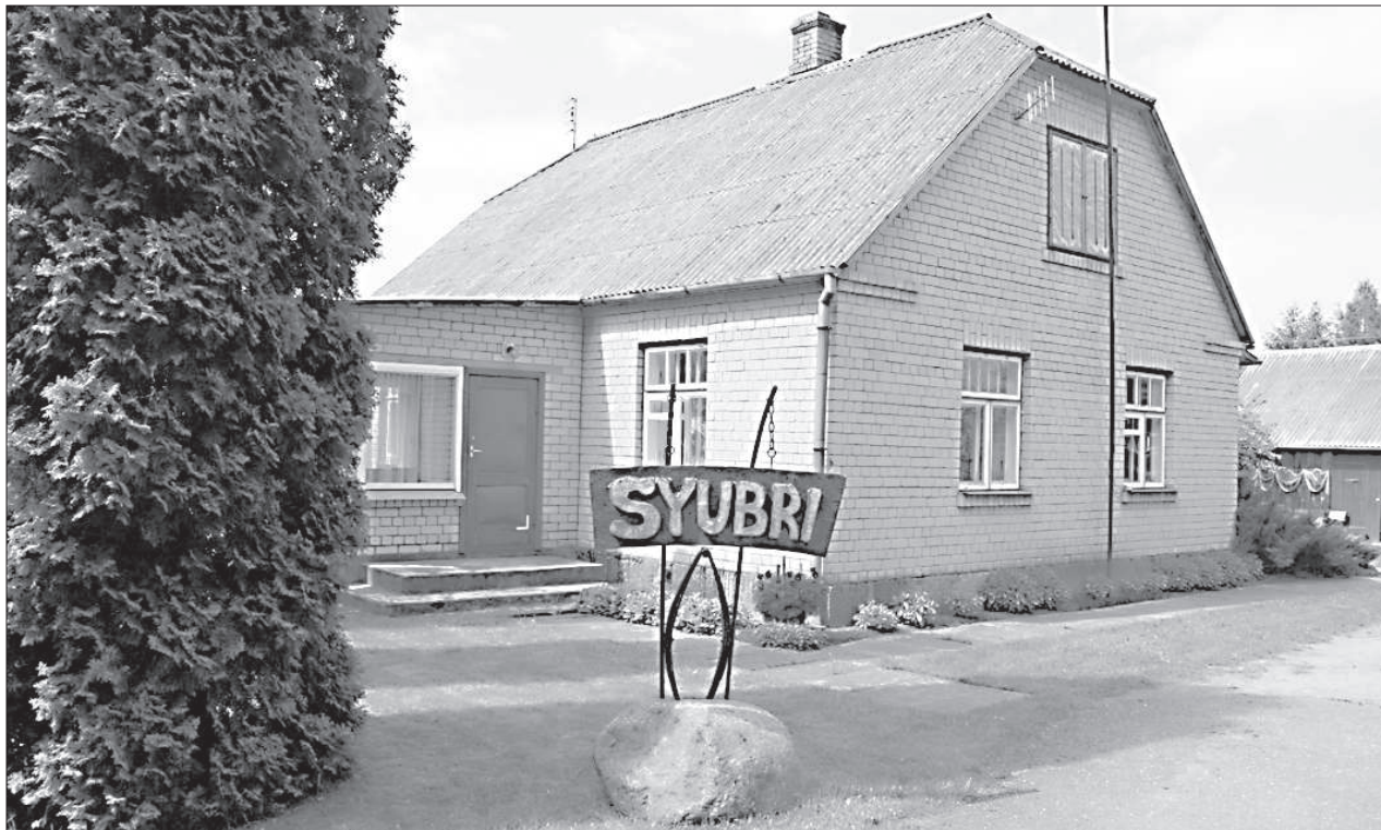
Дом строился почти всю жизнь.

На международном уровне пенсионная система Латвии оценивается очень высоко, отметил Силиньш. Но очень многие жители страны ей не доверяют, а Сейм своими решениями часто только увеличивает это недоверие. Итогом становятся недостаточные платежи в социальный бюджет, отметил Силиньш. ■