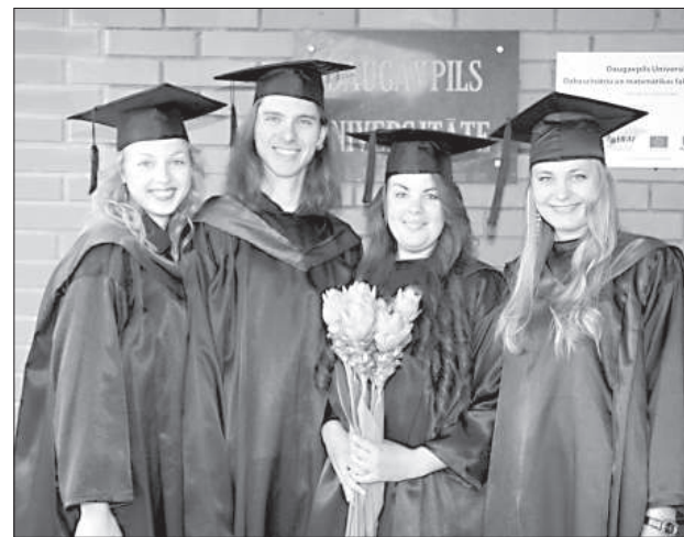
Магистры математики этого года.