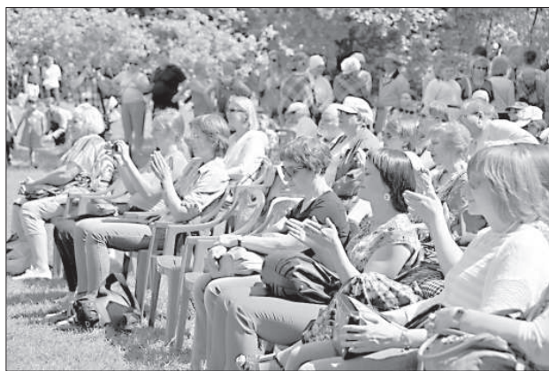
Жители Санкт-Петербурга аплодируют латгальцам.