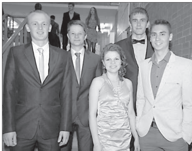
Выпускники факультета естественных наук и математики.