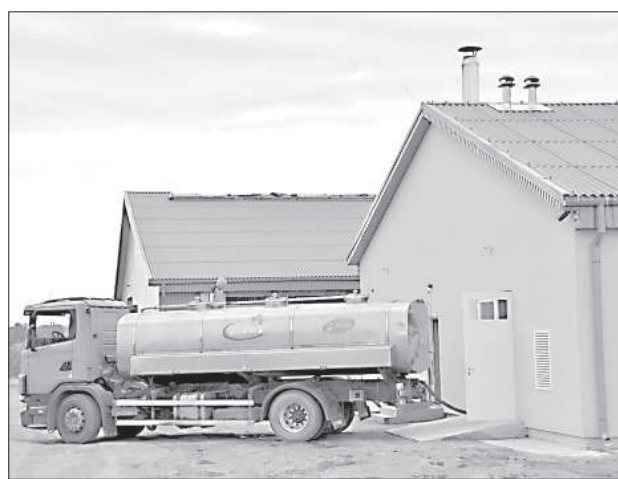
Машина «Preiļu siers» приезжает каждый день.