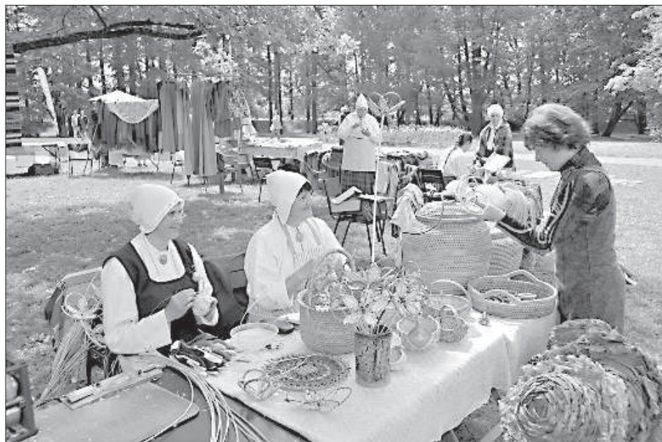
В Вишском ремесленном поселке удивляют плетеные изделия.