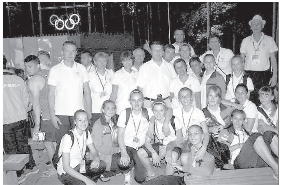
Баскетболистки Даугавпилса с новым президентом Латвии Раймондом Вейонисом.