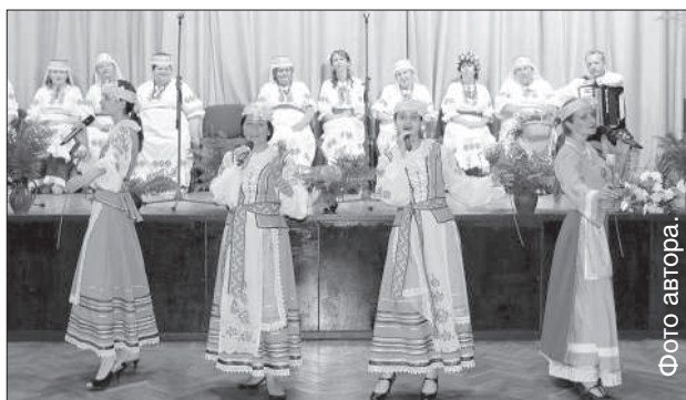
Коллективы ЦБК исполнили народные песни и танцы.

Накануне любимого славянским народом праздника Ивана Купалы во Дворце культуры прошел праздничный концерт «Белорусское Купалле».