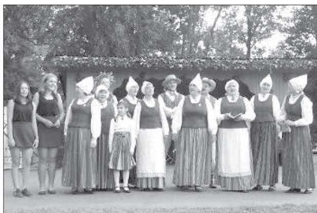
Фольклорный коллективы Дубны «Atzola».

Дубне пели и танцевали. На праздничном концерте выступили волостные любительские коллективы и гости из соседних волостей и краев. Особая дружба связывает Дубну с Зарасаем, каждый год на праздник сюда приезжают литовские коллективы. На