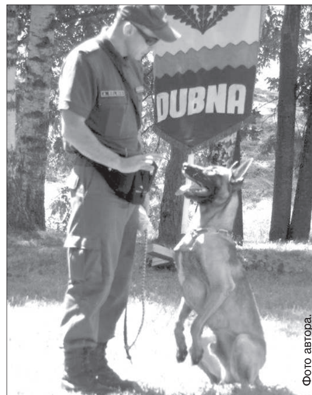
Служебные собаки показывают свои умения.