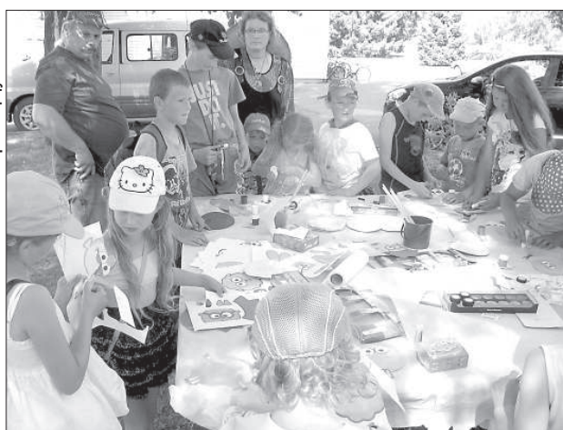
Дети занимаются в творческих мастерских.