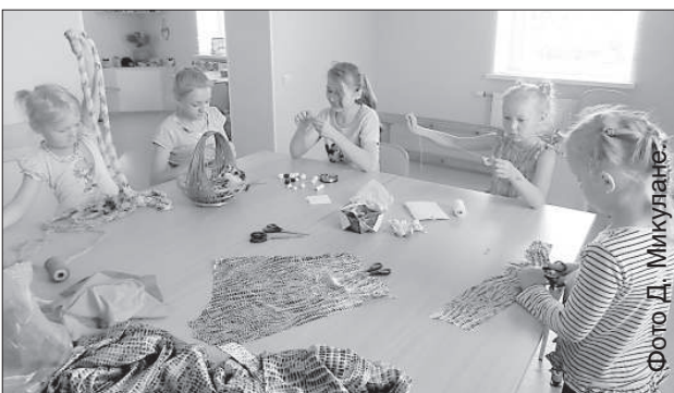
Создаются текстильные работы.